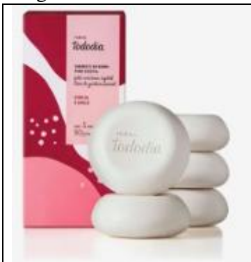
CAIXA DE SABONETES 90g COM 5 UNIDADES