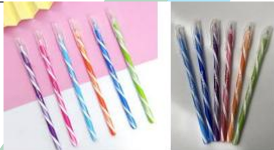
CANETA ESFEROGRAFICA 1.0 mm