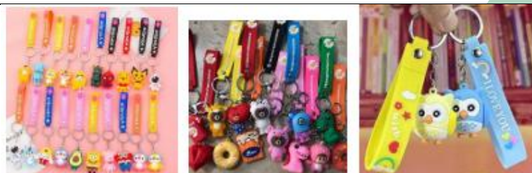
CHAVEIRO DE SILICONE SORTIDO