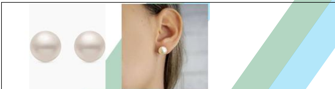
BRINCO DE PÉROLA