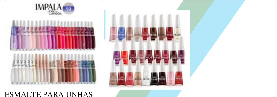
ESMALTE PARA UNHAS