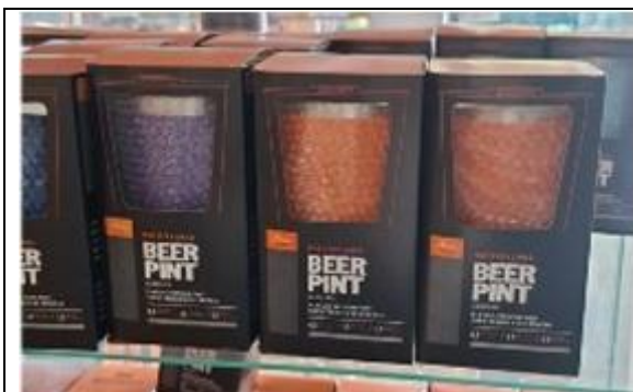
COPO TÉRMICO COLORIDOS COM TAMPA