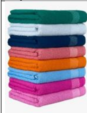
TOALHA DE BANHO EM TECIDO ATOALHADO 60X120