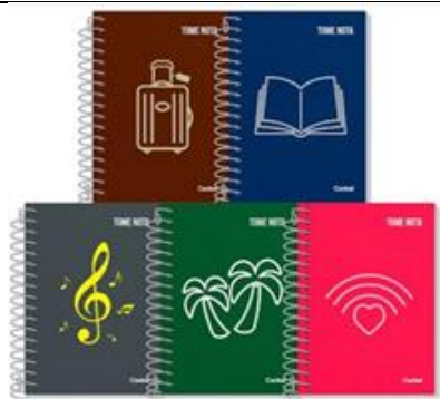
CARDENETA CAPA FLEXÍVEL ESPIRAL 48 FOLHAS