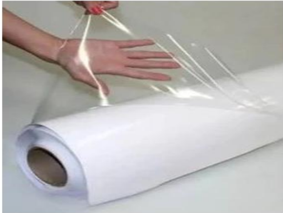
Plástico Cristal Grosso Transparente PVC 0,50mm Medidas: 100 cm x 320 cm