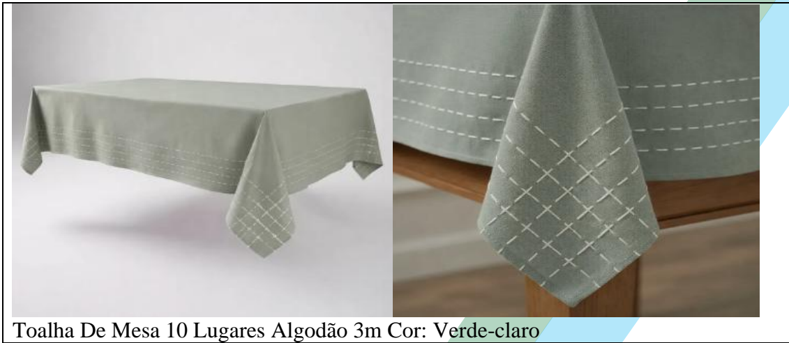
Toalha De Mesa 10 Lugares Algodão 3m Cor: Verde-claro