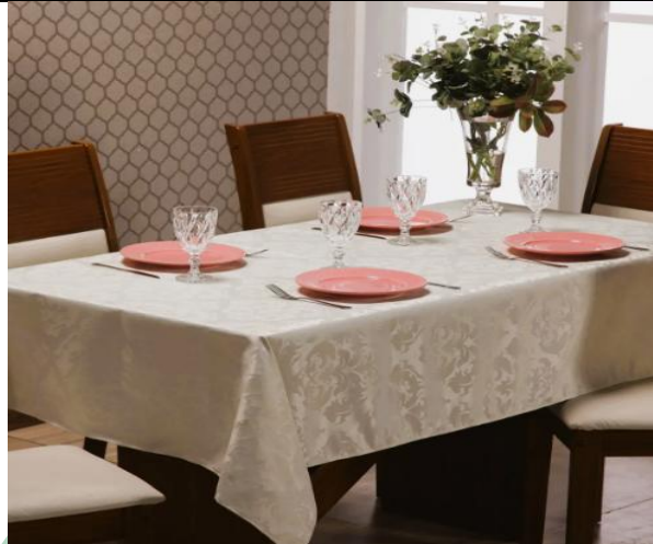
Toalha De Mesa Jacquard Texturizado