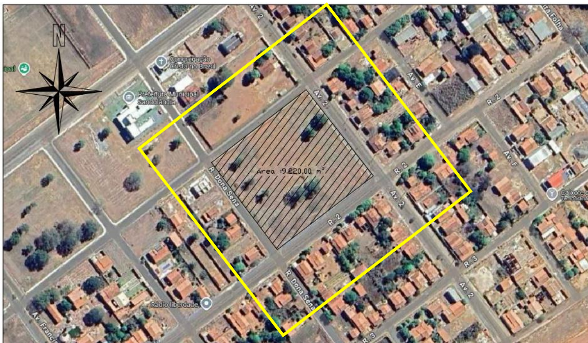
FIGURA 1 – TERRENO PARA CONSTRUÇÃO DA ESCOLA (DEMARCADO EM LINHA AMARELA)

A referida Unidade Escolar encontra-se na cidade de Sandolândia, na Avenida 02, Gleba 02, Quadra n° 26.