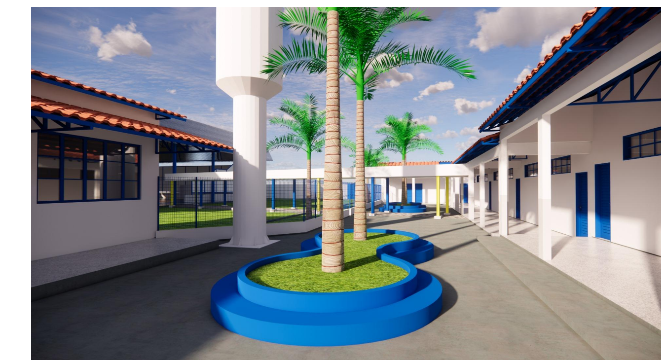
02 PERSPECTIVA (PAISAGISMO EXISTENTE) Escala: 1:500