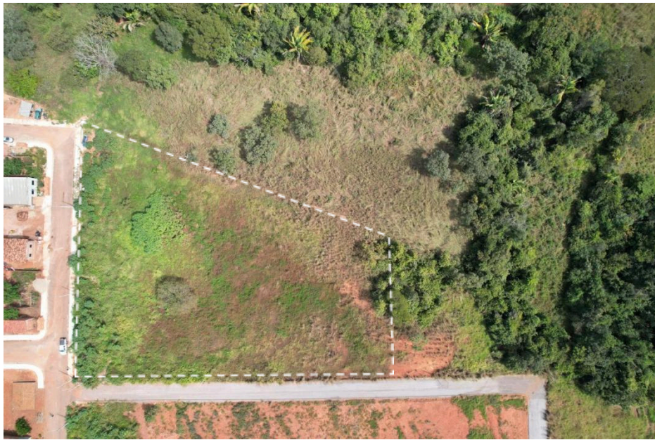
FIGURA 1 – TERRENO PARA CONSTRUÇÃO DA NOVA UNIDADE ESCOLAR – PAIMEIRÓPOLIS/TO