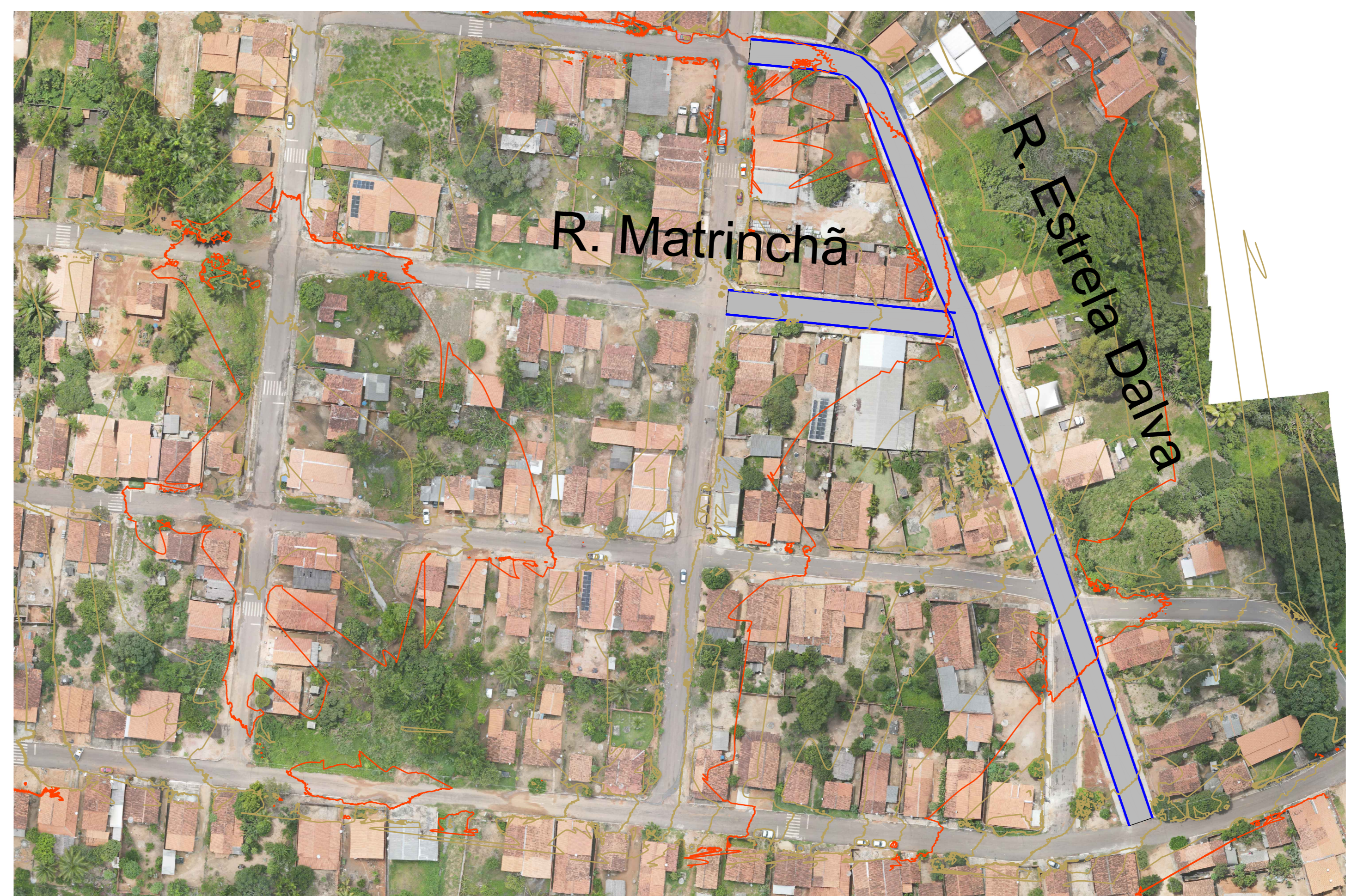
PLANTA BAIXA COM ORTOFOTO ESCALA 1:1000