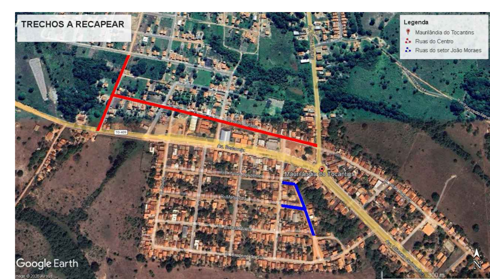
CROQUI DE RUAS A PAVIMENTAR ESCALA 5/E