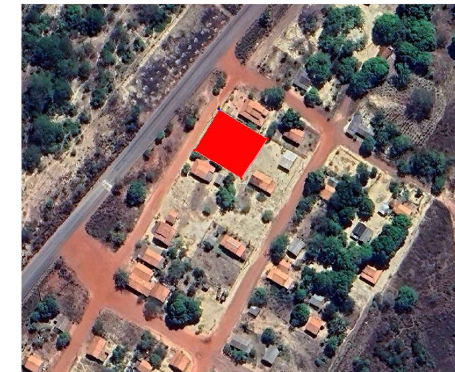
4 LOCAÇÃO 1 : 150