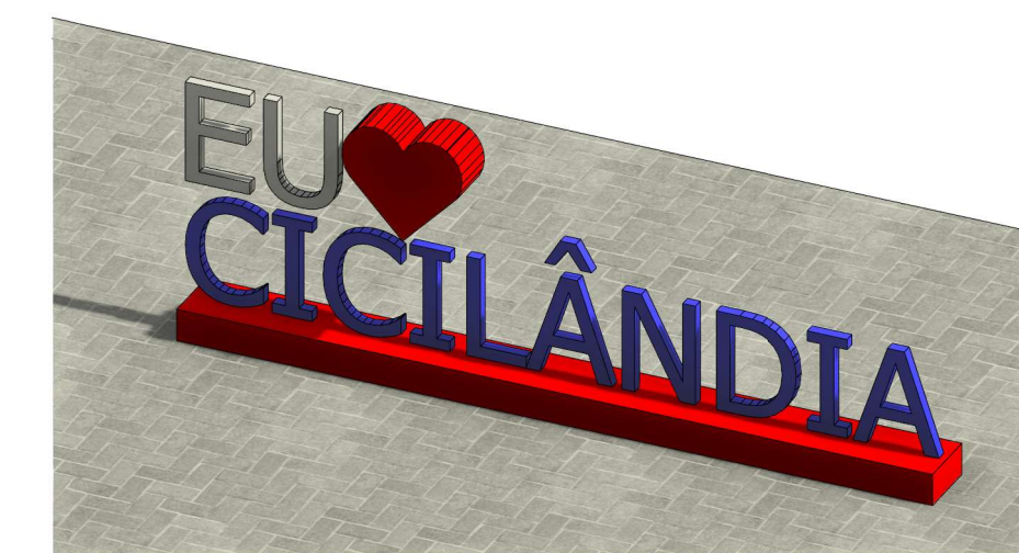
3 DET. LETREIRO