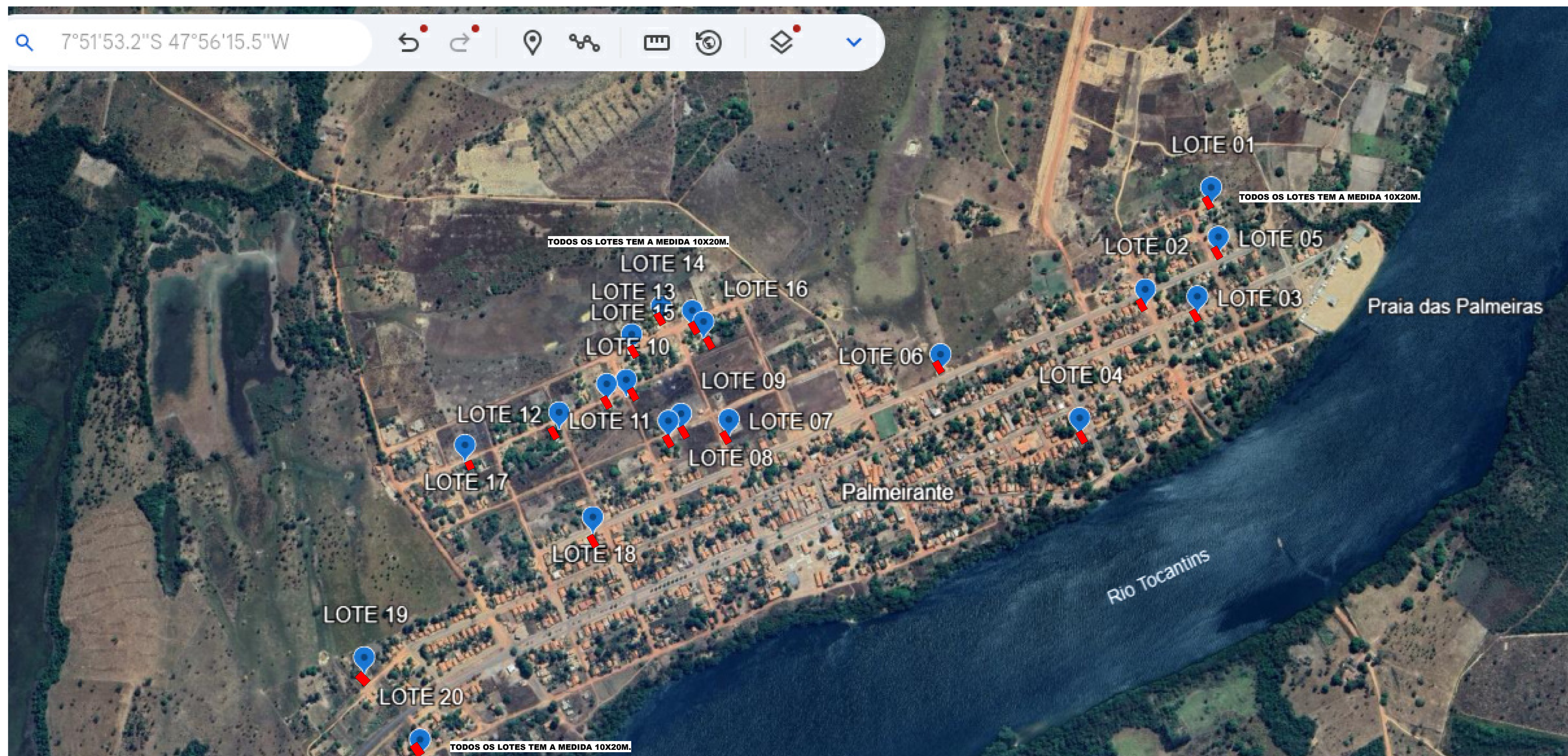
1 PLANTA DE LOCALIZAÇÃO E SITUAÇÃO 1:100