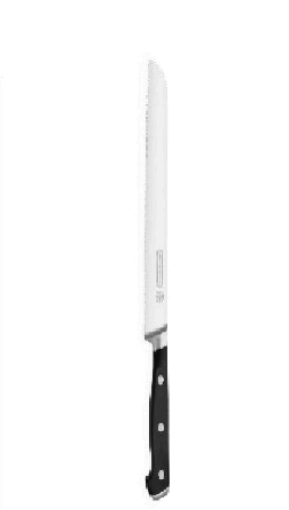
FACA DE PÃO