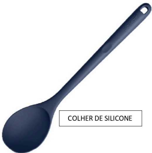
COLHER DE SILICONE