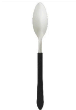
COLHER DE MESA