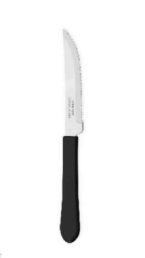
FACA DE MESA