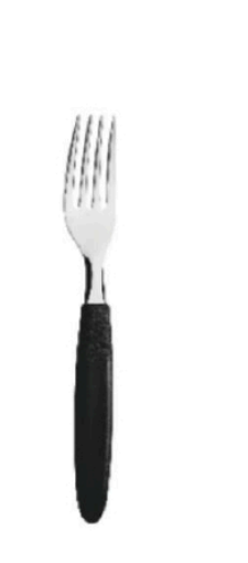
GARFO DE MESA