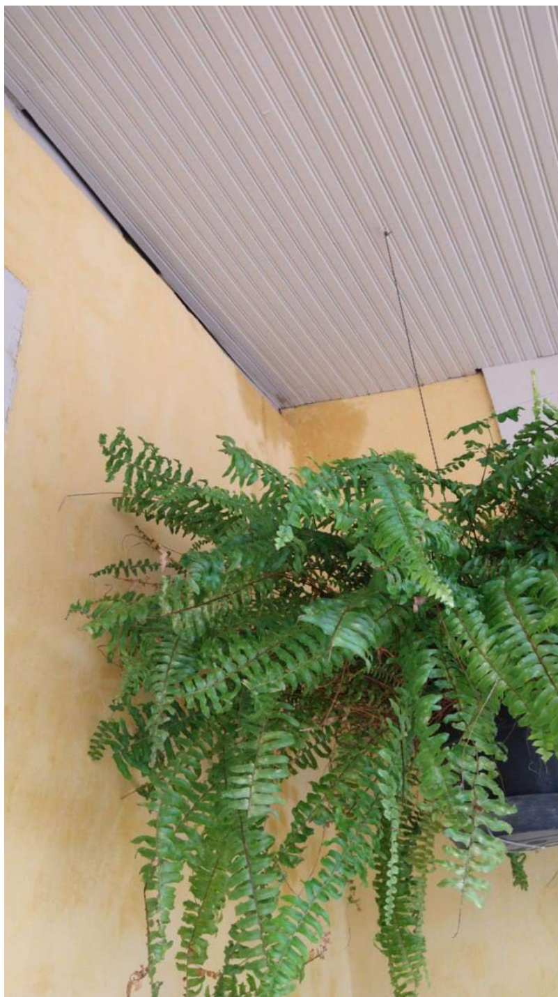
Figura 5 - Infiltração pelo telhado