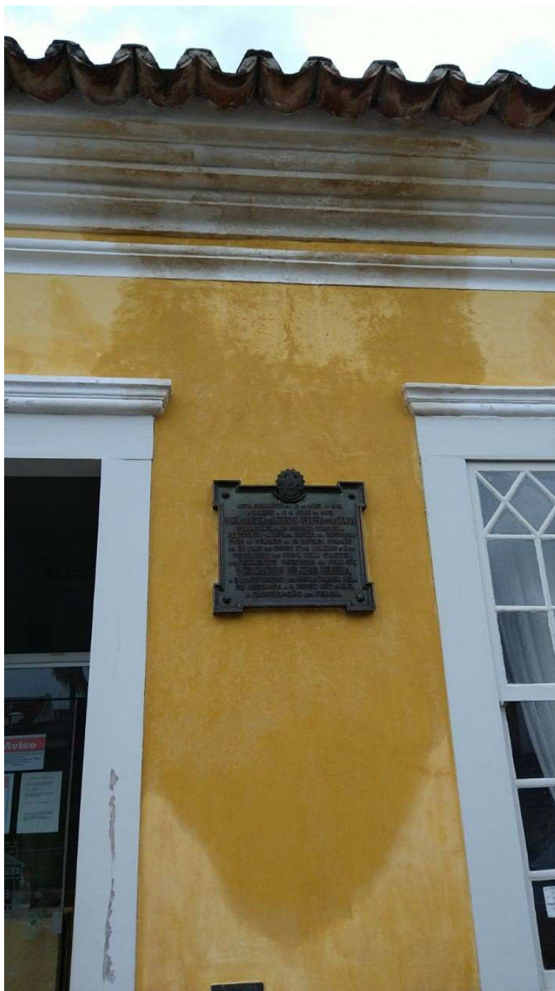
Figura 10 - Mancha de infiltração de água, comprometendo a pintura e a cimalha da edificação