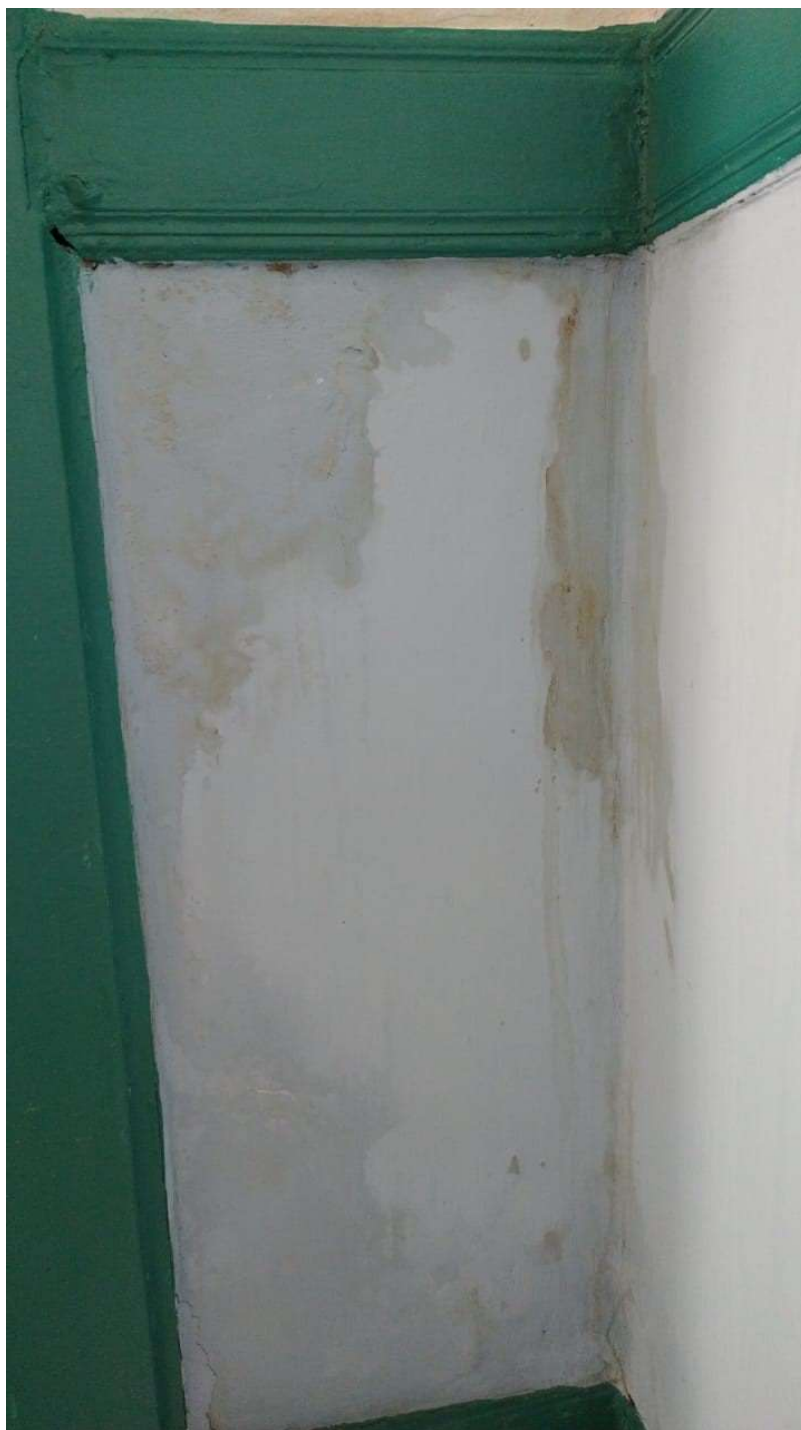
Figura 2 - Manchas de infiltração