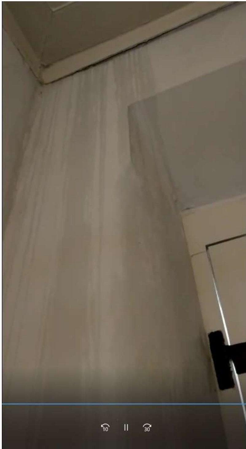
Figura 17 - Água escorrendo pela parede do acesso do museu.