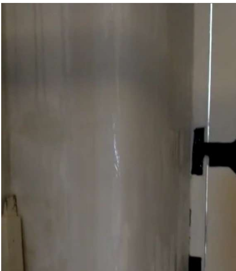
Figura 16 - Água escorrendo no acesso do Museu