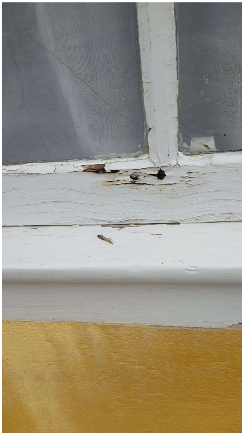
Figura 3 - Podridão nas esquadrias