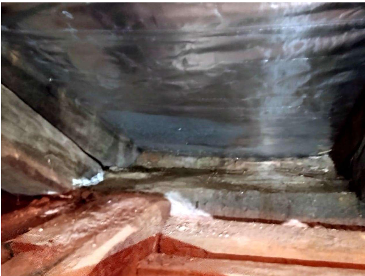
Figura 11 - Manchas de podridão e fungos na madeira