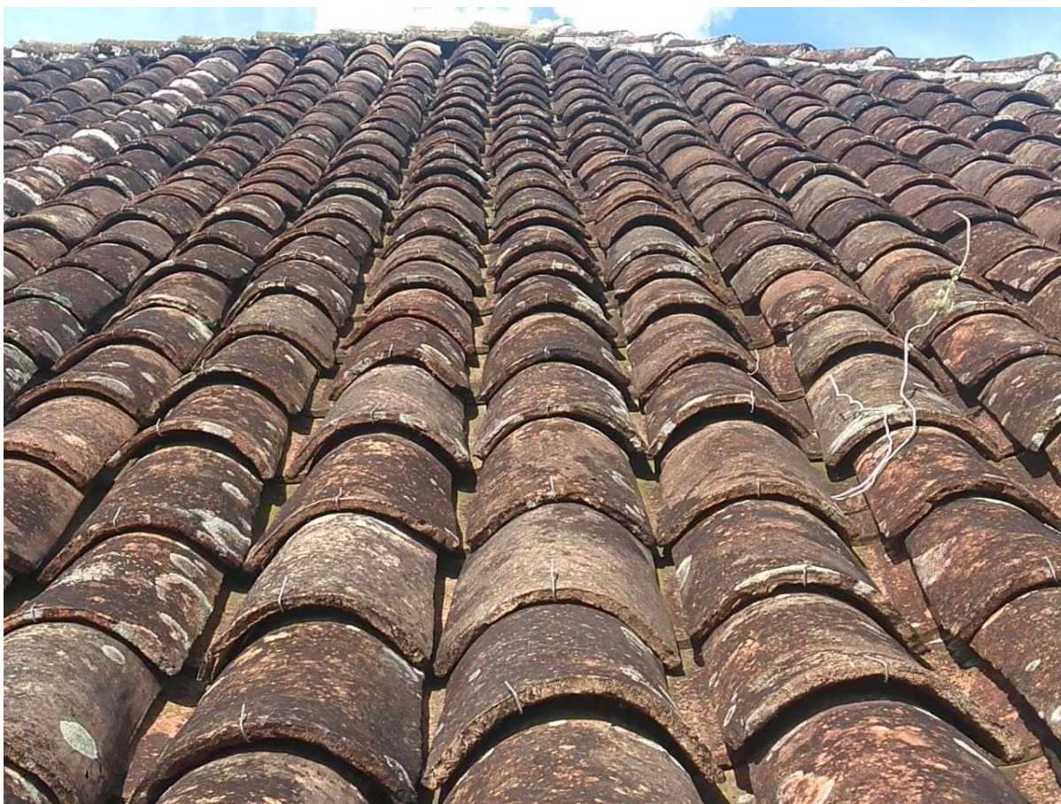
Figura 8 - Entelhamento desalinhado com ganchos soltos e argamassa da cumeeira rachada e com lacunas em alguns locais.