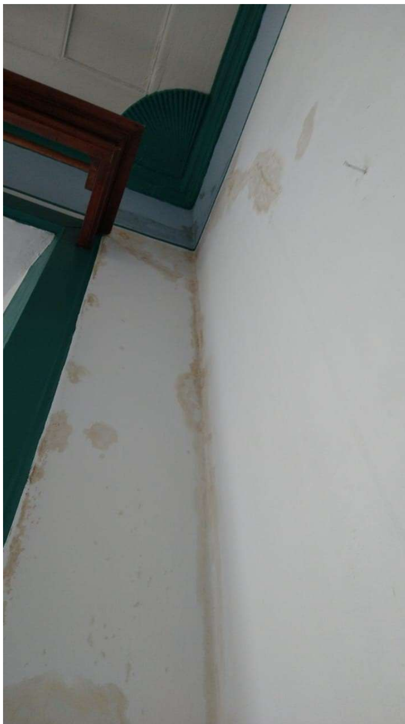
Figura 1- Manchas de infiltração