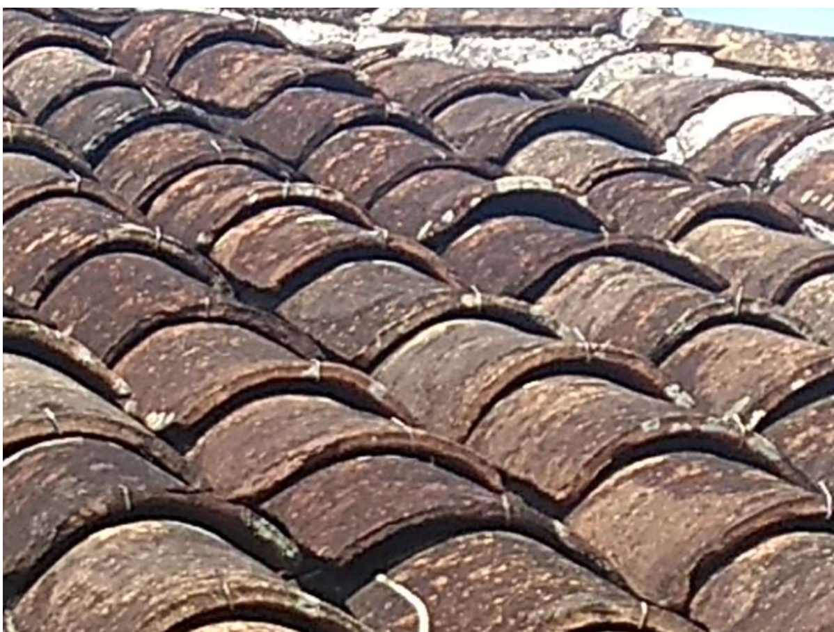
Figura 7 - Entelhamento desalinhado com ganchos soltos e argamassa da cumeeira rachada e com lacunas em alguns locais.