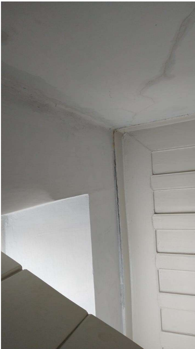
Figura 4 - Mancha de infiltração ao longo da parede