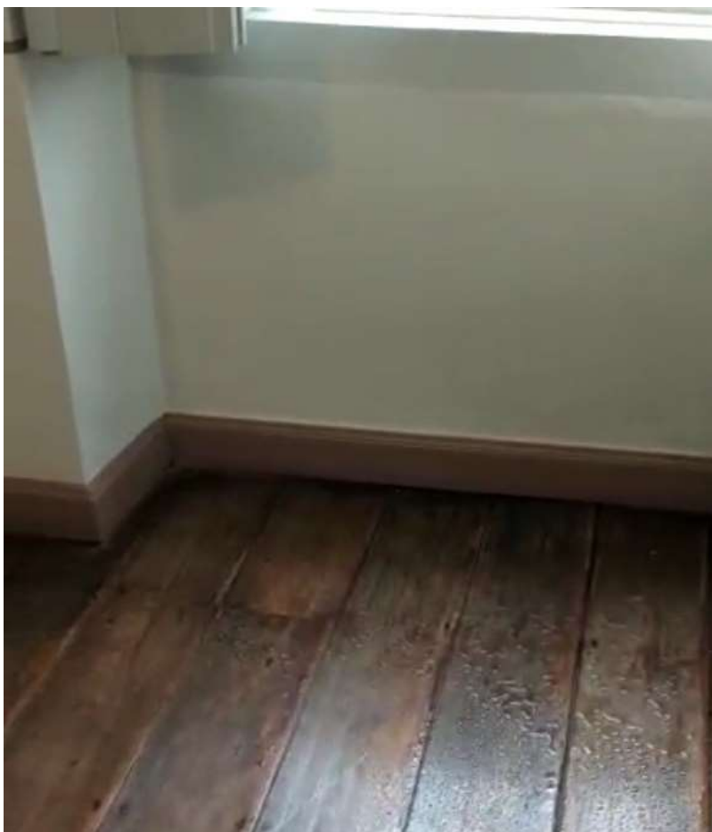
Figura 15 - Quarto rosa (ver Mapa de Danos 1 (SEI nº 2487558))