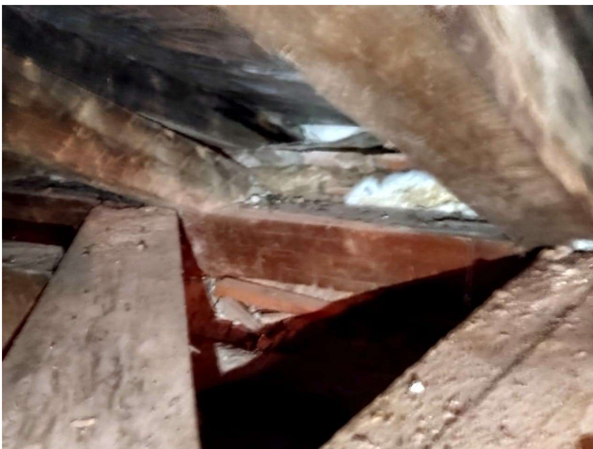
Figura 12 - Manchas de podridão e fungos na madeira

11. As imagens acima, foram realizadas em um dia sem chuva, abaixo, seguem imagens dos dias de chuva para identificação dos danos que a edificação vem sofrendo, as imagens foram retiradas de