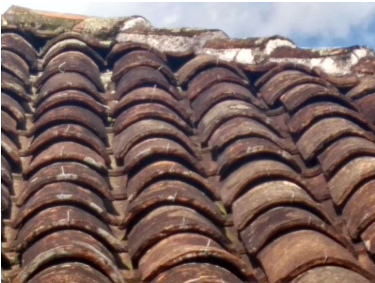
Figura 6 - Entelhamento desalinhado com ganchos soltos e argamassa da cumeeira rachada e com lacunas em alguns locais.