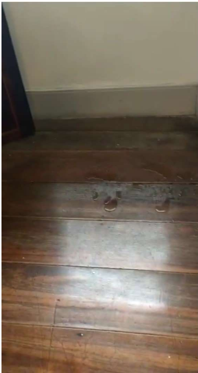
Figura 14 - Goteira moderada (ver Mapa de Danos 1 (SEI nº 2487558))