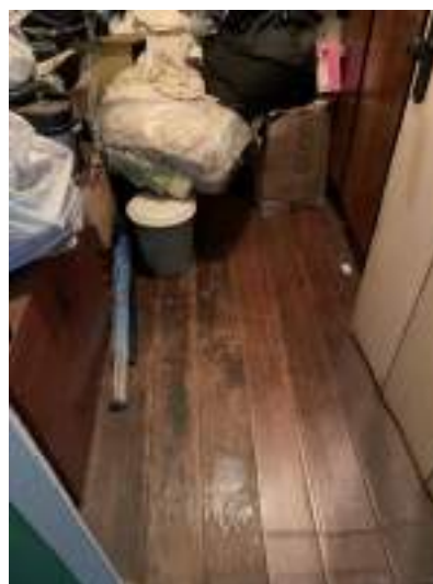
Imagem 18 – Piso original (2021).