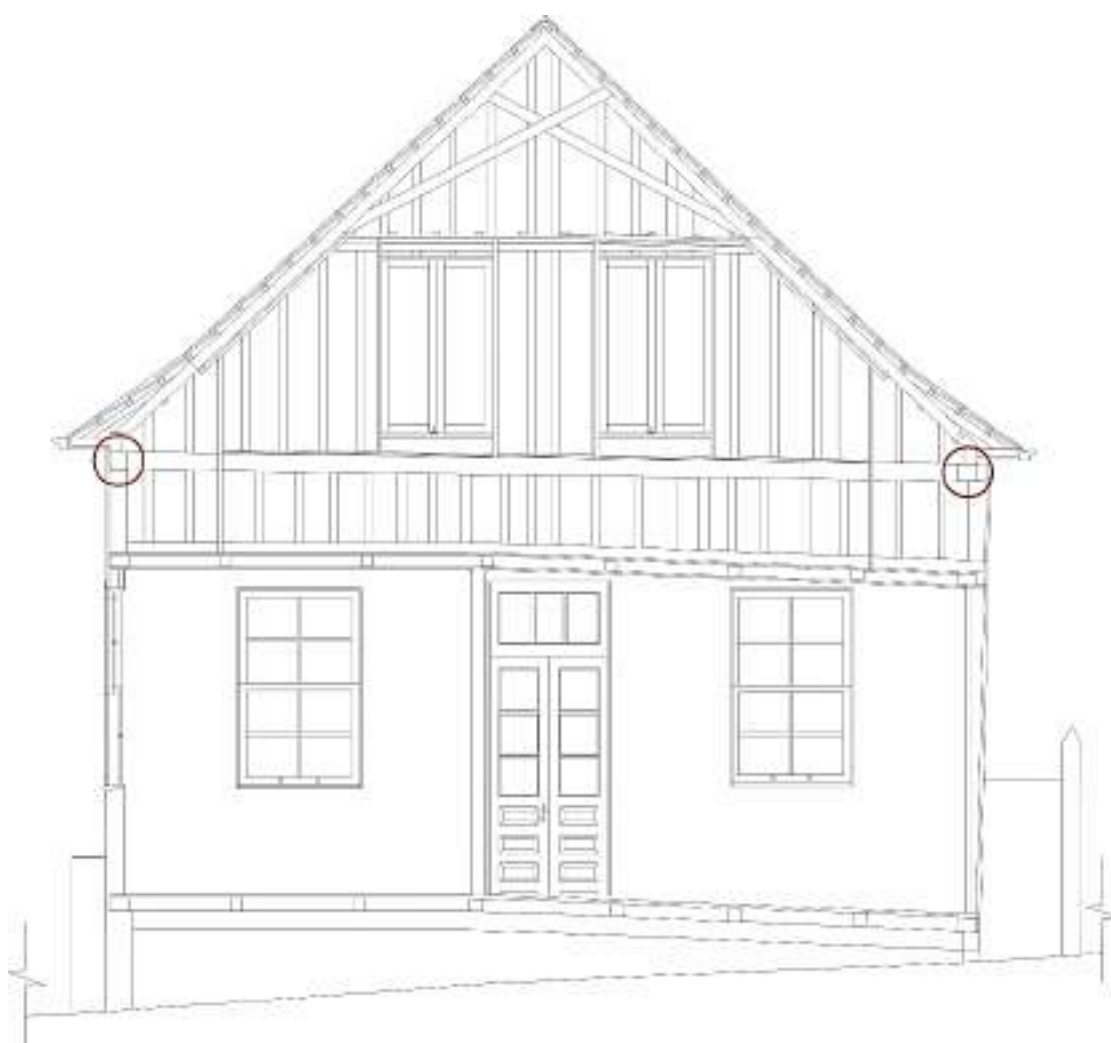
Figura 2 – Corte transversal (2021).

Possui uma linha ao redor de toda a edificação, baldrame, fazendo o quadro da residência e uma viga transversal, no outro sentido os barrotes dispostos lado a lado. É possível perceber que as vigas possuem uma curvatura, gerada pelo assentamento dessas fundações de pedra no solo. Essa inclinação é perceptível no interior da casa, onde há um desconforto no piso, uma vez que ele se encontra inclinado, assim como na fachada oeste, onde é possível notar a parede também inclinada.