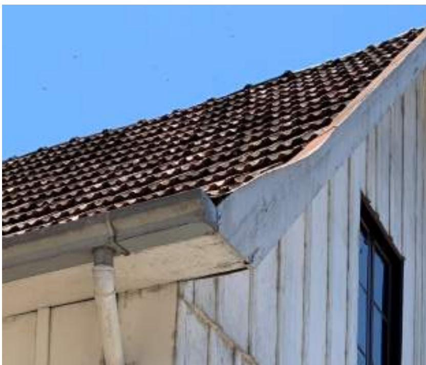
Imagem 16 – Foto do beirado da edificação. (2021)