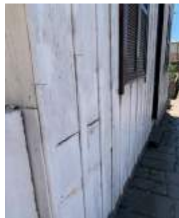
Imagem 7 – Foto da fachada sul (2021).