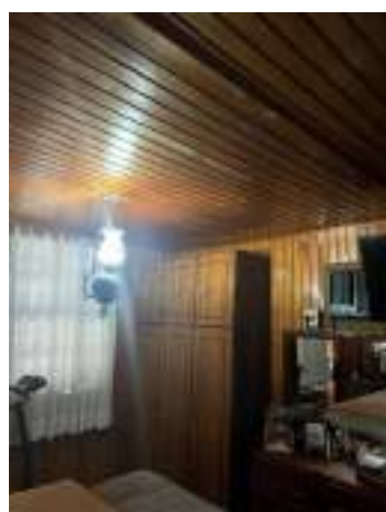
Imagem 19 – Forro do pavimento térreo (2021).

Os forros também são de tábuas de madeira, porém, assim como as paredes, no pavimento térreo também foi revestido de lambril, de encaixe macho e fêmea. No pavimento superior, os forros permanecem originais, com as tabuas dispostas lado a lado e junta seca.