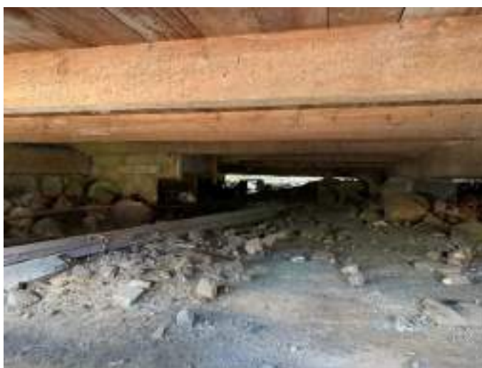
Imagem 8 – Foto da parte da estrutura inferior da casa (2021).

As fundações da residência são de pedras basalto irregulares, assentadas no barro. Em cima dessas pedras, são apoiadas as vigas de madeira, que fazem a sustentação da casa.