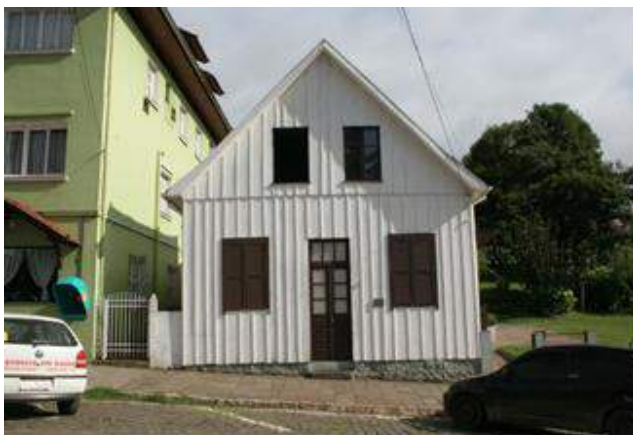
Imagem 6 – Foto da fachada sul (2010).