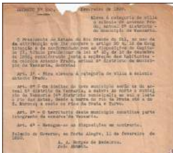
Imagem 2 – Decreto de emancipação do município de Antônio Prado (1899)

Neste período, o povo pradense começou a buscar oportunidades de trabalho e estudos em outras cidades, e com isso a população de Antônio Prado começou a diminuir, e entre 1970 e 1980 teve o seu período mais crítico. Porém, esse isolamento e afastamento da cidade, resultou em uma involuntária preservação do patrimônio histórico da cidade uma vez que as casas permanecem intactas (ROVEDA, 2003). Com o passar dos anos Antônio Prado começou a evoluir, e o comércio estava ascendendo novamente devido a construção da Estrada Júlio de Castilhos, que cortava Antônio Prado e fazia ligação entre Porto Alegre e Caxias do Sul.