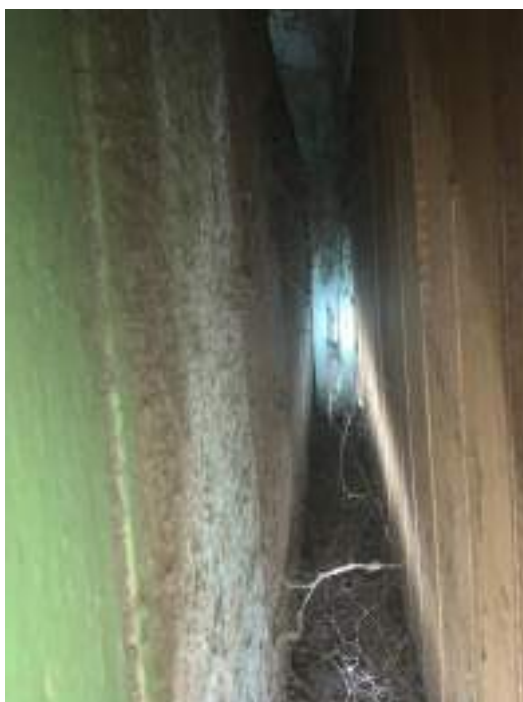
Imagem 13 – Foto da parede externa com o revestimento de lambril internamente, na escada. (2021)

As paredes externas, são simples (não duplas) são em tábuas de pinheiro, disposta com junta seca e com mata-junta pelo lado externo.