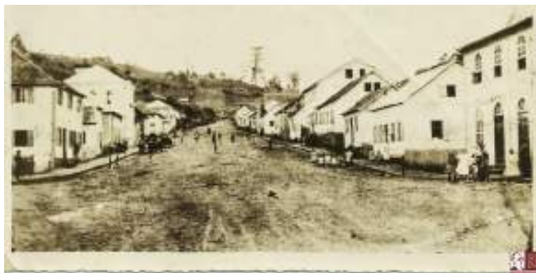
Imagem 4 – Vista da Rua Valdomiro Bochesse e suas edificações de madeira (1911).