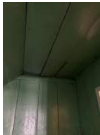
Imagem 20 – Forro do pavimento superior (2021).