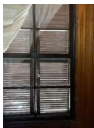
Imagem 23 – Foto da janela do pavimento térreo, com veneziana externa (2021).