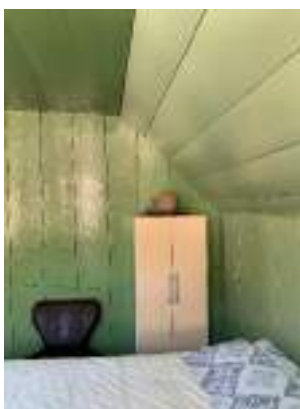
Imagem 11 – Foto interna do pavimento superior (2021)