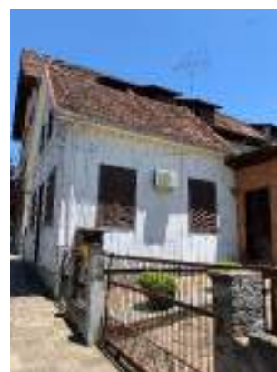
Imagem 12 – Foto externa da fachada leste (2021)

As paredes externas, são simples (não duplas) são em tábuas de pinheiro, disposta com junta seca e com mata-junta pelo lado externo.