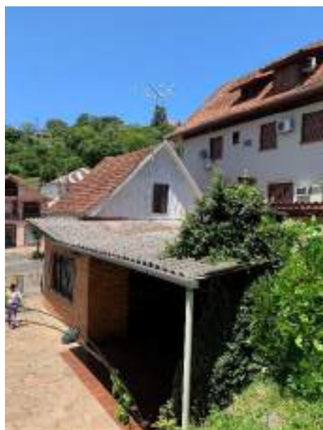
Imagem 14 – Foto externa da cobertura (2021).

A cobertura de duas águas é de telha cerâmica francesa e sua estrutura (caibros e ripas) é de madeira, usualmente conhecida por caibro armado. É possível perceber uma flambagem na cumeeira, que ocorre possivelmente pelo peso da própria cobertura, assim como o grande espaçamento que existe entre os caibros armados, bem como pela perda de resistência das peças de madeira ao longo dos anos e a inclinação pelo recalque do solo.