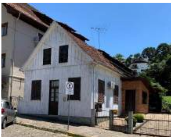
Imagem 5 – Casa Giuseppe Deluchi (2021).

A edificação foi reformada em 1977, onde a cozinha, que era de madeira, foi refeita de alvenaria, e com o passar dos anos, mais alguns anexos foram construídos na parte de trás da casa. Atualmente, os descendentes de Anunciata utilizam a casa somente para moradia da família.