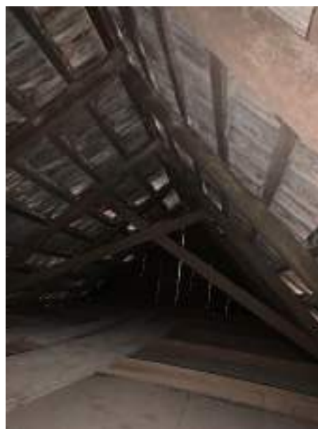
Imagem 15 – Foto interna da cobertura (2021).

O beirado do telhado em madeira, possui um avanço de aproximadamente 35cm com uma tábua fazendo o forro e uma peça de madeira formando a testeira e mais a calha em aço.