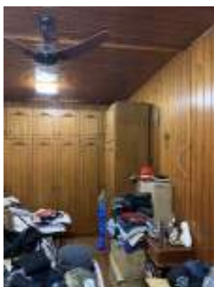
Imagem 10 – Foto interna do térreo (2021)