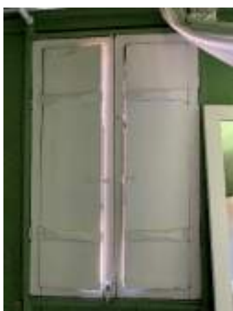
Imagem 24 – Foto da janela do pavimento superior, com fechamento interno (2021).