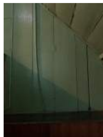
Imagem 25 – Foto da porta de acesso a área residual, identificada pela dobradiça. (2021).