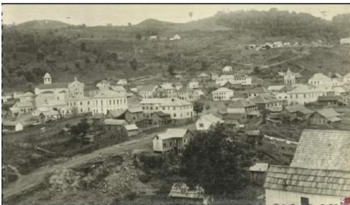
Imagem 3 – Vista aérea da cidade de Antônio Prado (1917).

Possui um traçado quadriculado urbano, com destaque da homogeneidade conjuntos de casas que não comprometem a visual da paisagem existente, criando um complexo harmônico e um dos mais importantes testemunhos do legado cultural da imigração italiana no Brasil (ROVEDA, 2003).