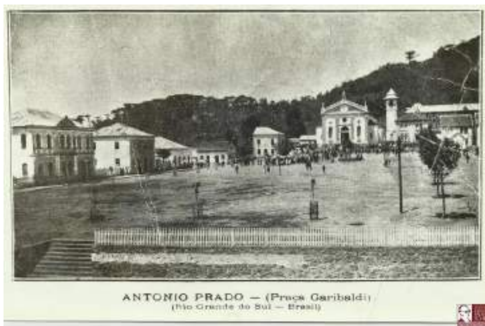
Imagem 1 – Praça Garibaldi. Nota-se que no entorno da Praça está localizada a Igreja Matriz, bem como importantes prédios públicos.