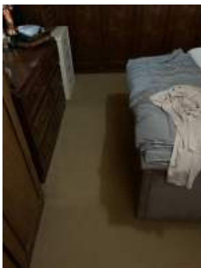
Imagem 17 – Piso do dormitório térreo com carpete (2021).