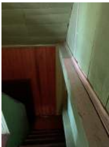
Imagem 9 – Foto da escada interna da residência, onde é possível ver o pilar no canto do ambiente e a viga (2021).

A estrutura é composta por vigas e pilares de madeira. Os pilares estão posicionados nos quatro cantos da casa, e as vigas, no perímetro da casa e uma no meio, no sentido leste-oeste, fazendo a função de amarração como um frechal da estrutura do telhado.