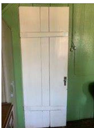
Imagem 22 – Foto da porta do pavimento superior (2021).