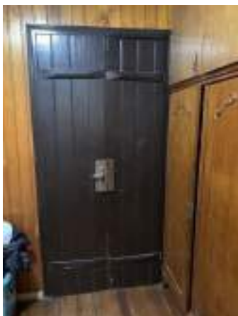
Imagem 21 – Foto da porta do pavimento térreo (2021).