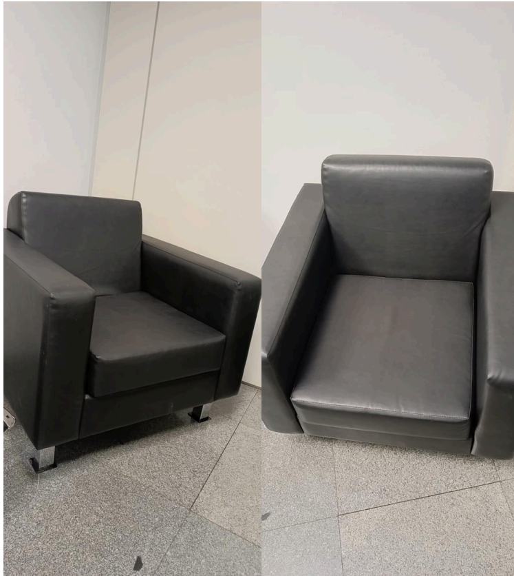
Fig. 3 - Foto ilustrativa: poltrona em couro preto- 1 lugar

OBS: O dimensionamento dos componentes da poltrona pode variar em até 5% para mais ou para menos.