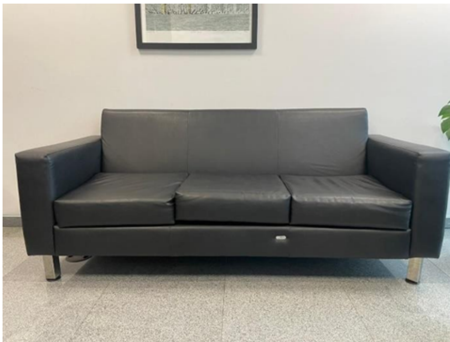
Fig.1 - Foto ilustrativa: sofá em couro preto - 3 lugares

OBS: O dimensionamento dos componentes do sofá pode variar em até 5% para mais ou para menos.