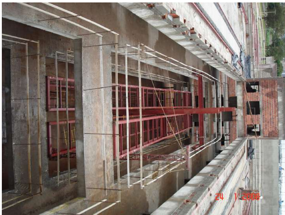
Imagem 16 - Obra de Impermeabilização (Ano 2007)