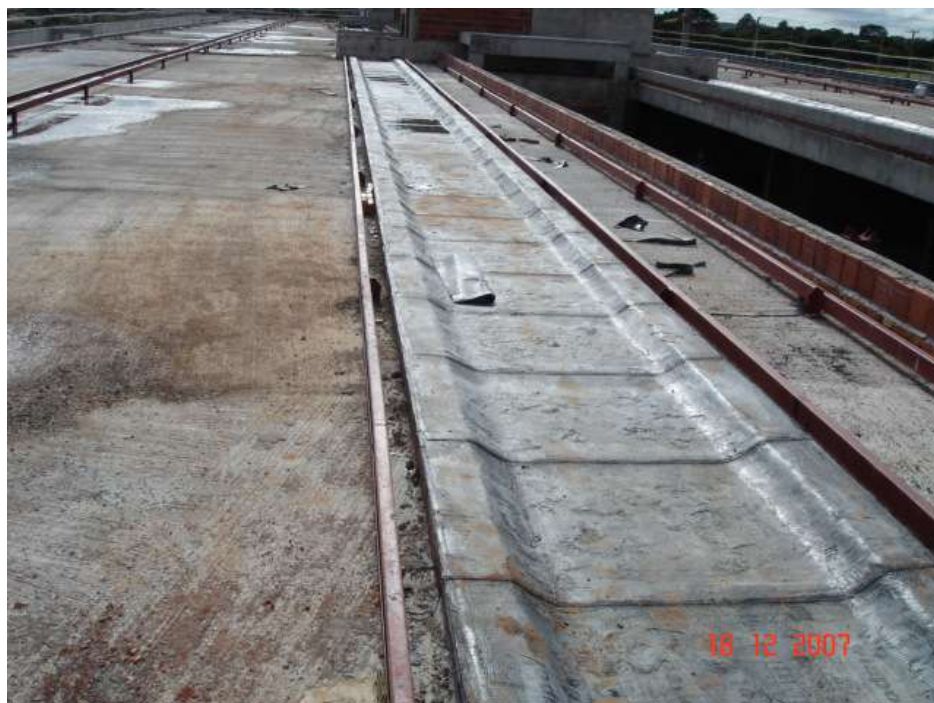
Imagem 31 - Obra de Impermeabilização (Ano 2007)