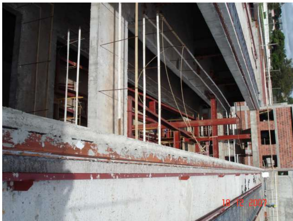
Imagem 35 - Obra de Impermeabilização (Ano 2007)