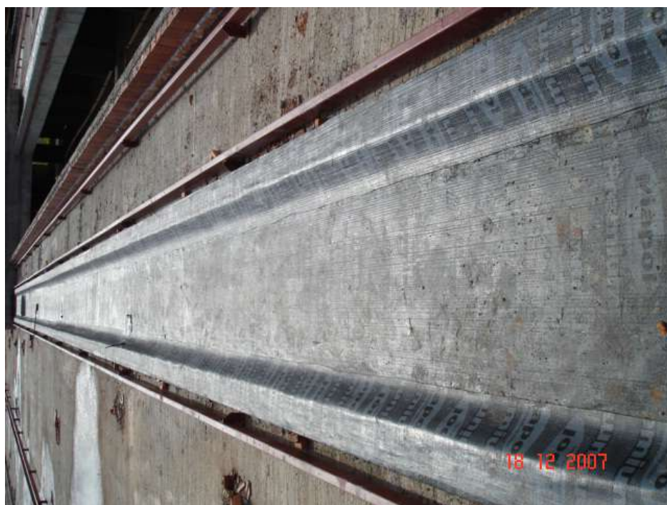
Imagem 34 - Obra de Impermeabilização (Ano 2007)