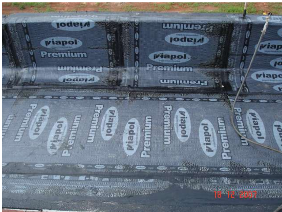
Imagem 41 - Obra de Impermeabilização (Ano 2007)