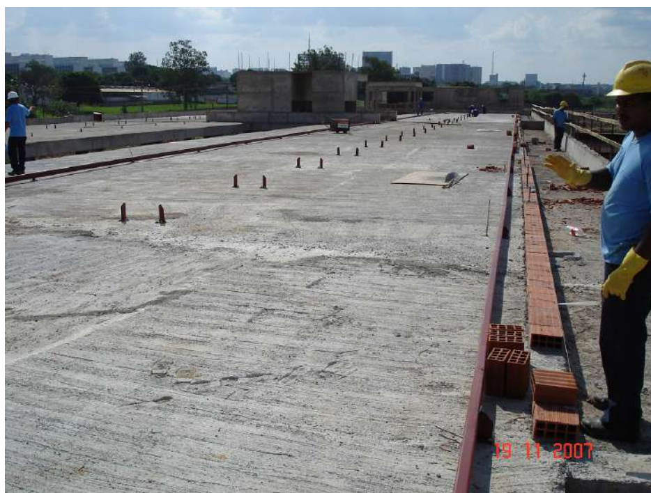
Imagem 4 - Obra de Impermeabilização (Ano 2007)