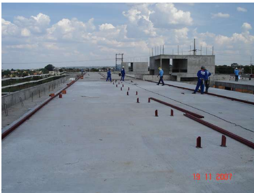
Imagem 1 - Obra de Impermeabilização (Ano 2007)