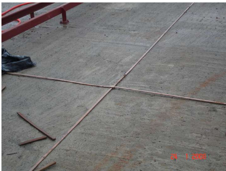
Imagem 12 - Obra de Impermeabilização (Ano 2007)