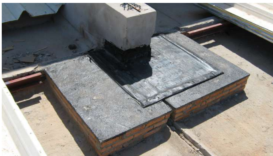
Imagem 28 - Obra de Impermeabilização (Ano 2007)