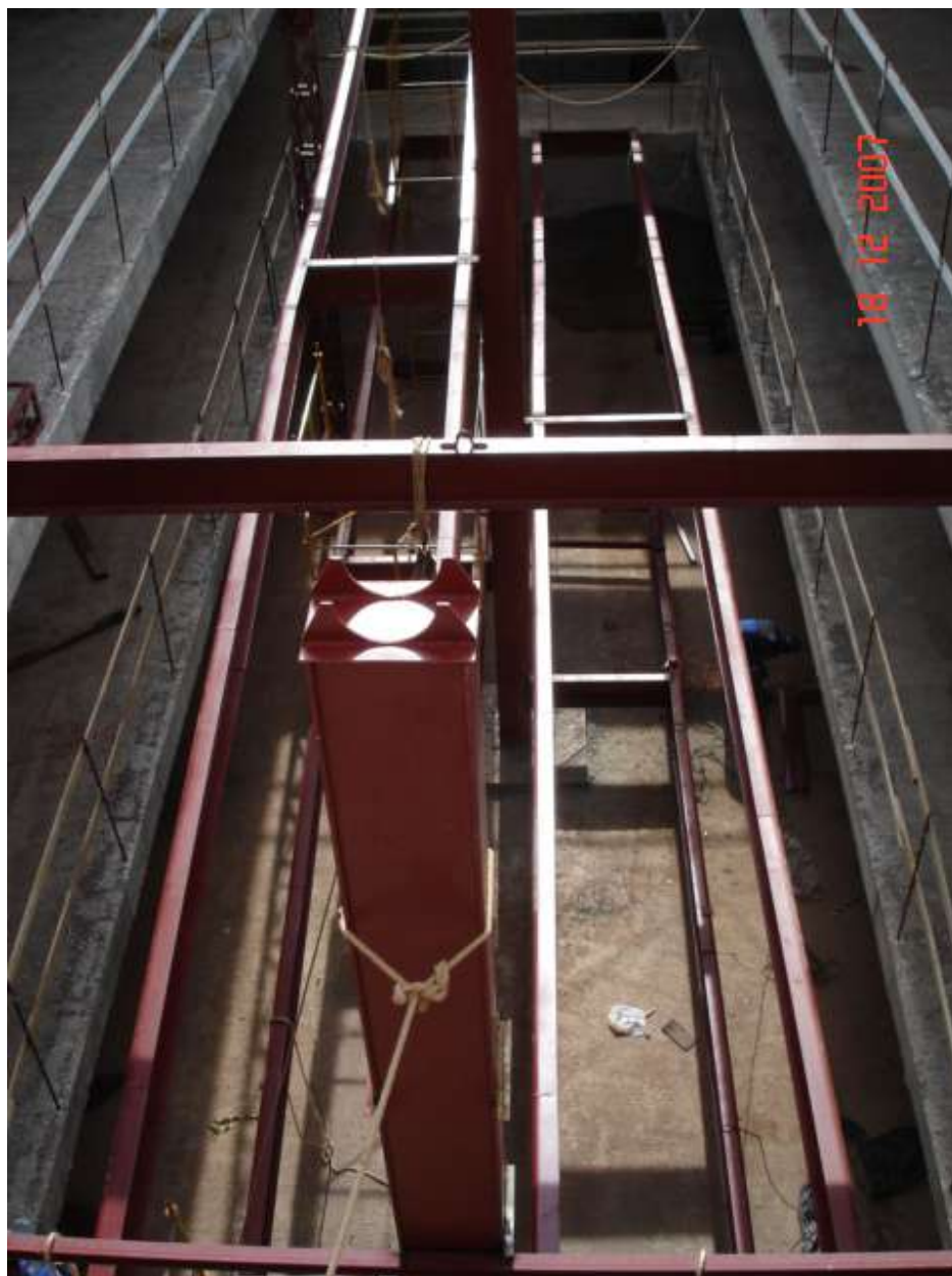
Imagem 30 - Obra de Impermeabilização (Ano 2007)