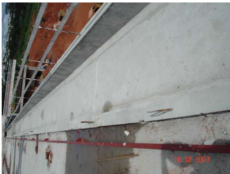
Imagem 36 - Obra de Impermeabilização (Ano 2007)