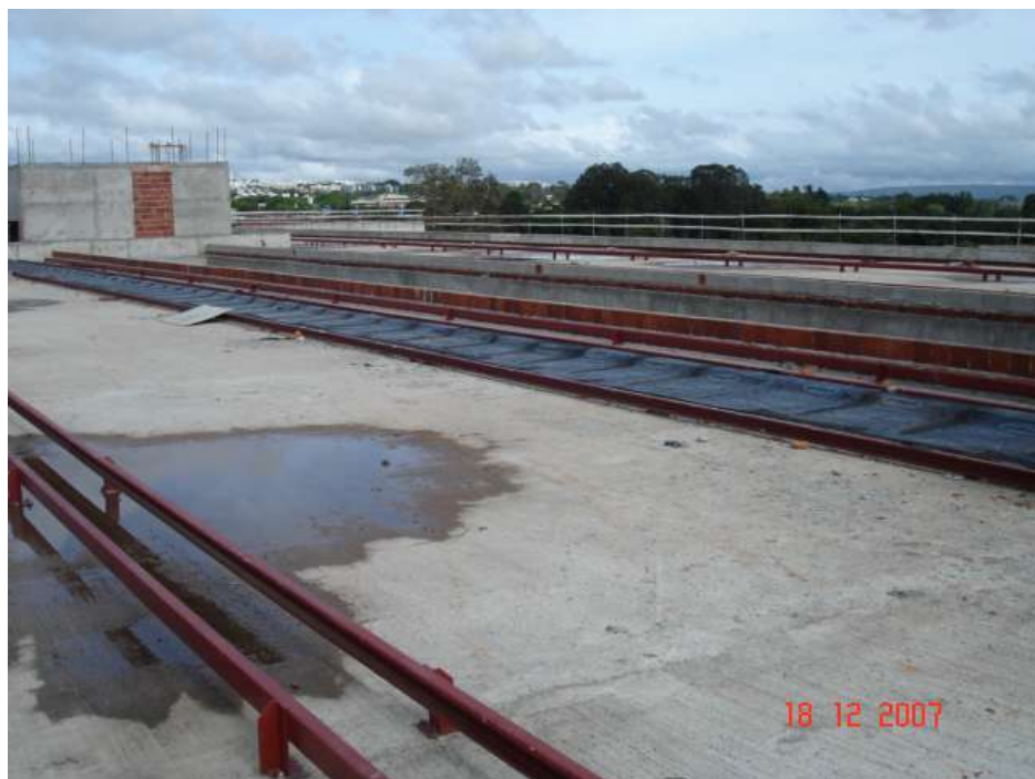
Imagem 37 - Obra de Impermeabilização (Ano 2007)