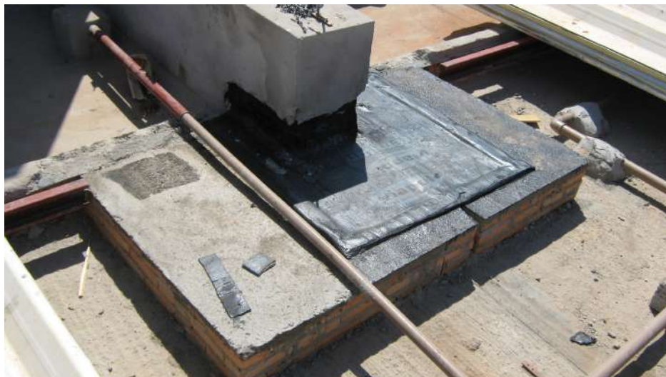
Imagem 29 - Obra de Impermeabilização (Ano 2007)