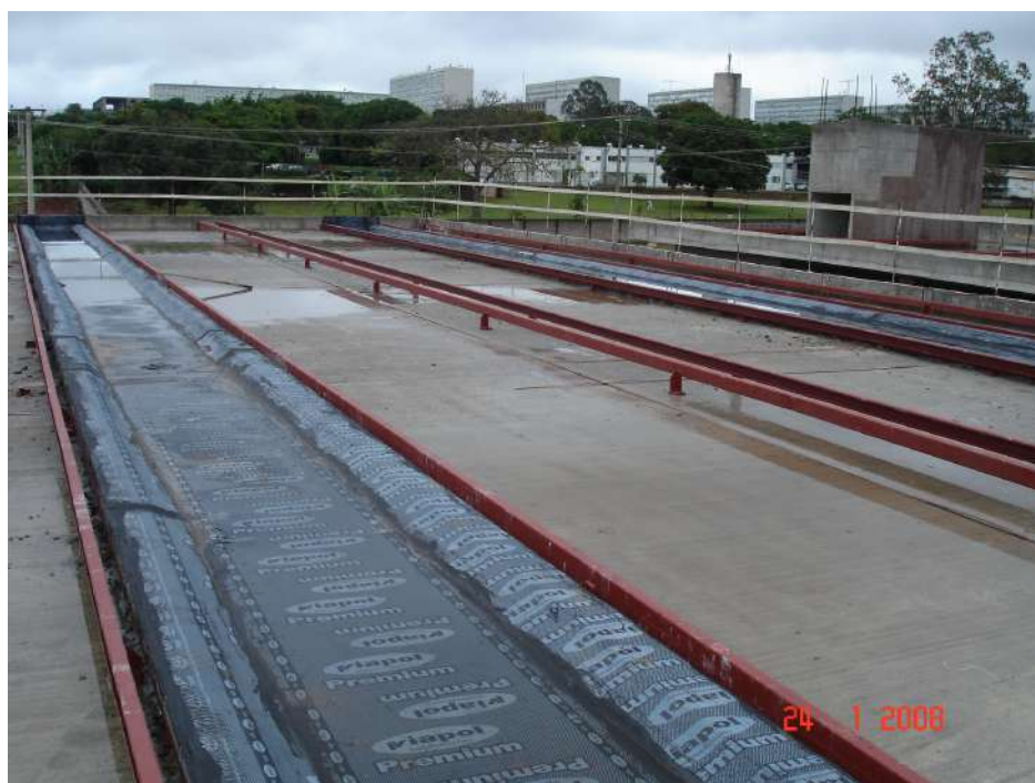
Imagem 8 - Obra de Impermeabilização (Ano 2007)