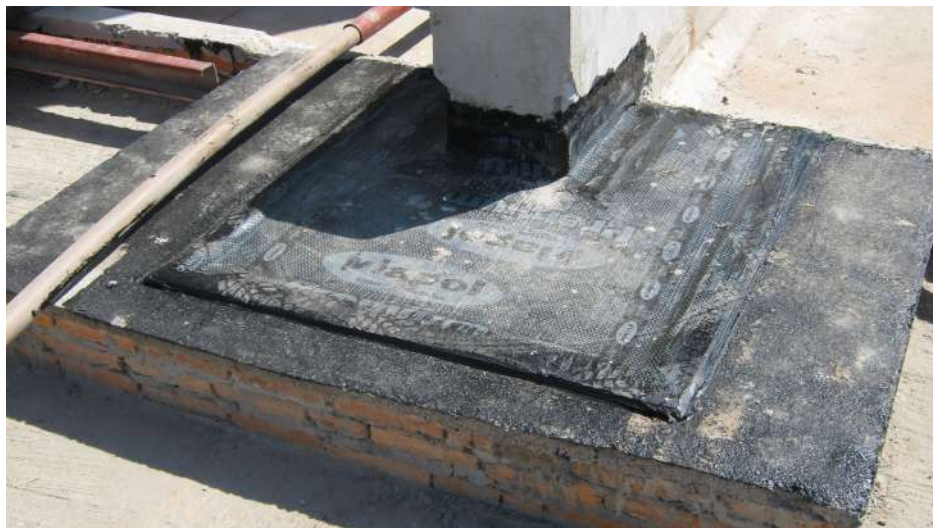
Imagem 25 - Obra de Impermeabilização (Ano 2007)