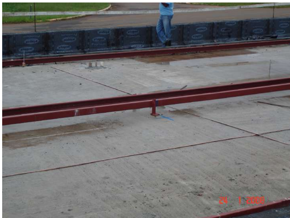
Imagem 17 - Obra de Impermeabilização (Ano 2007)