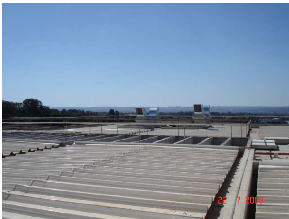
Imagem 20 - Obra de Impermeabilização (Ano 2007)