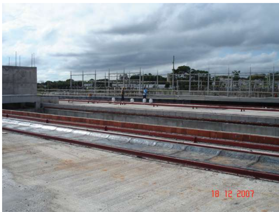
Imagem 32 - Obra de Impermeabilização (Ano 2007)