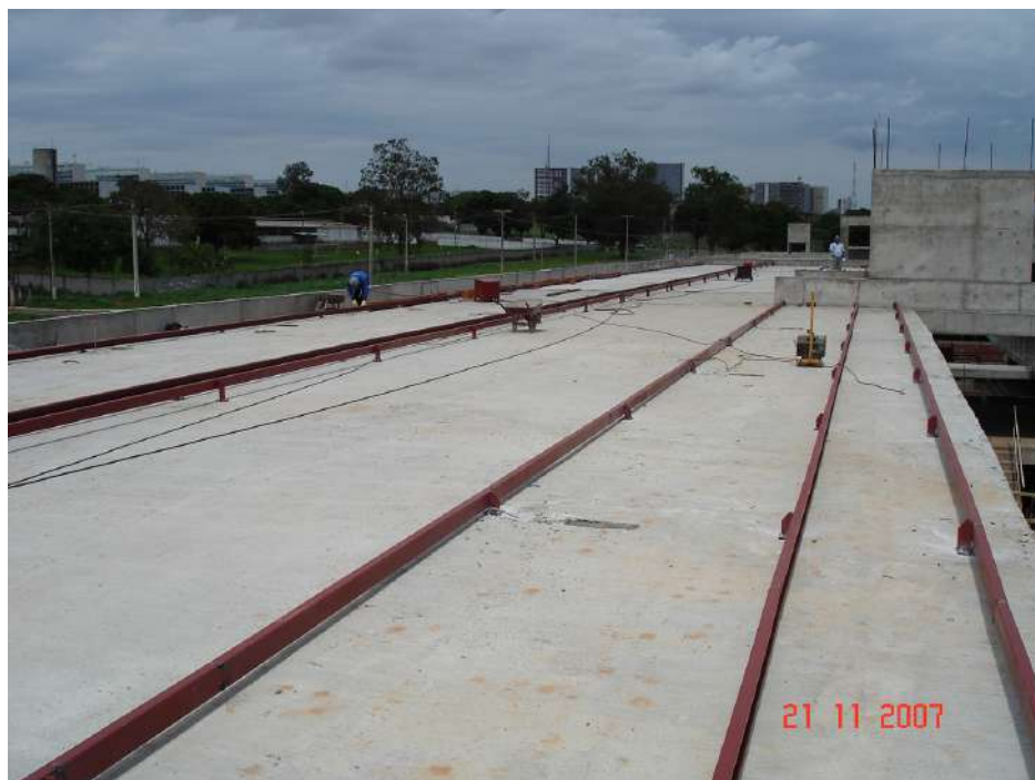
Imagem 7 - Obra de Impermeabilização (Ano 2007)