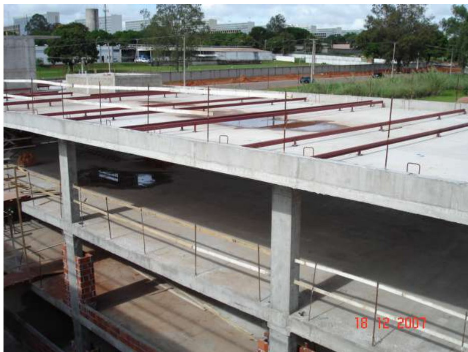
Imagem 49 - Obra de Impermeabilização (Ano 2007)