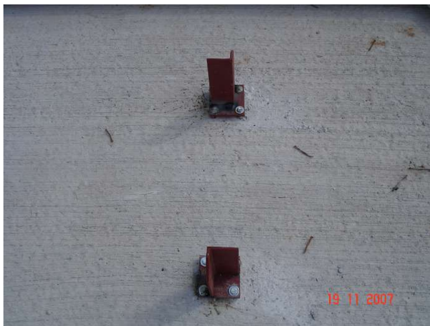
Imagem 2 - Obra de Impermeabilização (Ano 2007)