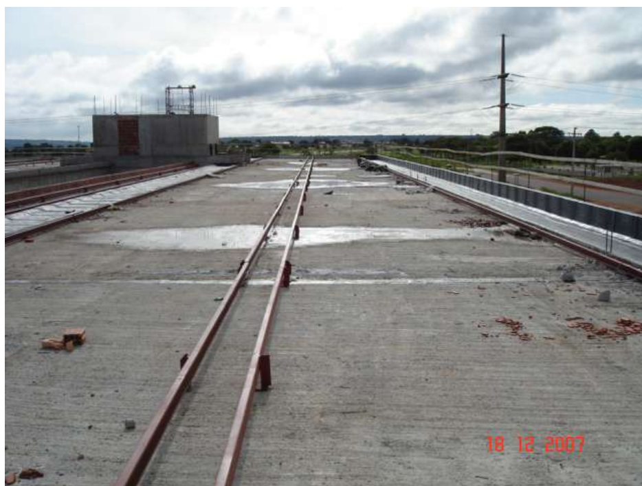
Imagem 38 - Obra de Impermeabilização (Ano 2007)