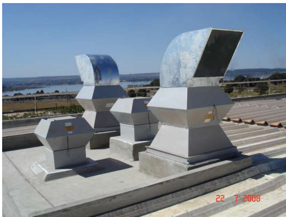
Imagem 22 - Obra de Impermeabilização (Ano 2007)