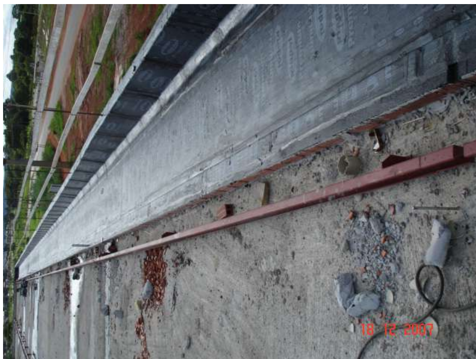
Imagem 39 - Obra de Impermeabilização (Ano 2007)