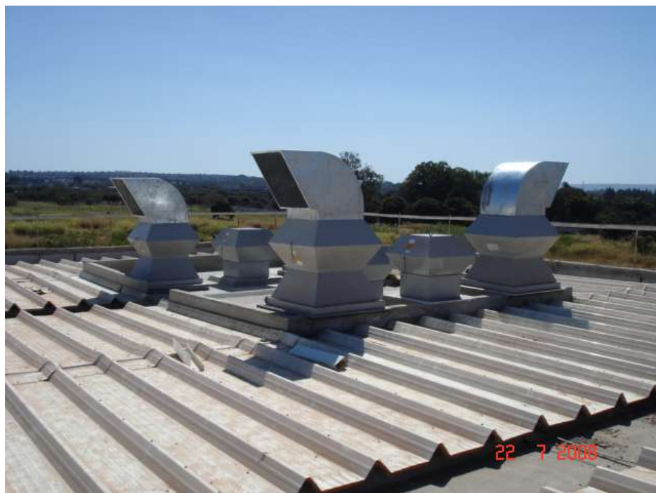
Imagem 21 - Obra de Impermeabilização (Ano 2007)