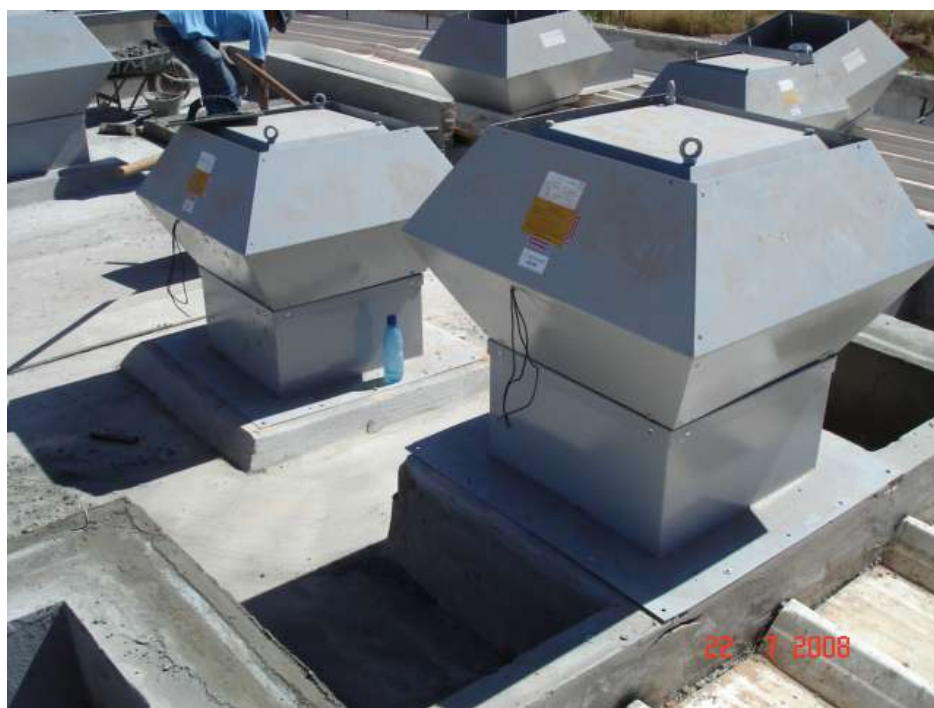
Imagem 18 - Obra de Impermeabilização (Ano 2007)