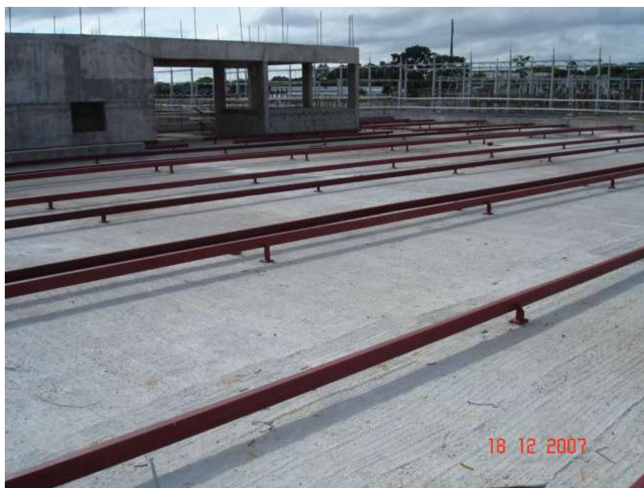
Imagem 50 - Obra de Impermeabilização (Ano 2007)