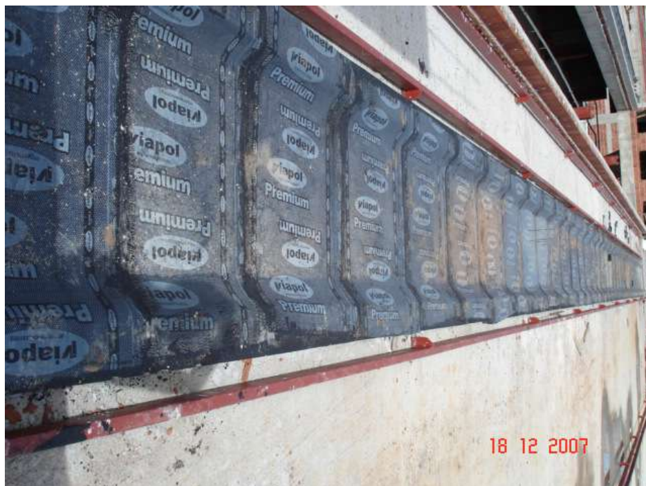
Imagem 33 - Obra de Impermeabilização (Ano 2007)