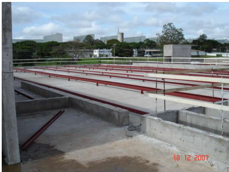
Imagem 45 - Obra de Impermeabilização (Ano 2007)