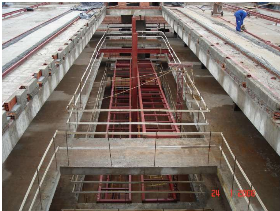
Imagem 15 - Obra de Impermeabilização (Ano 2007)