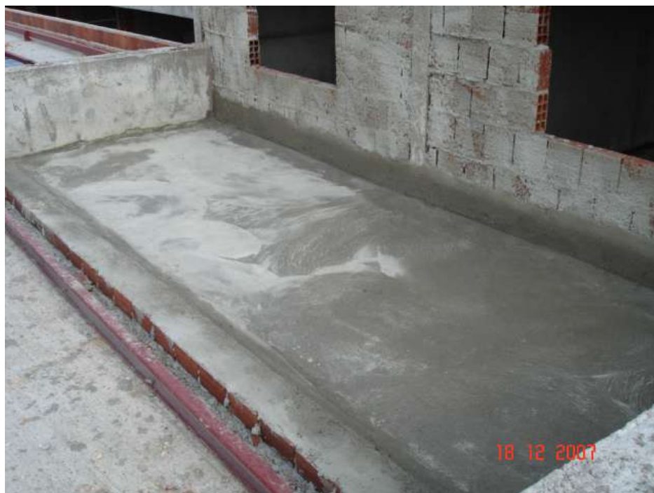
Imagem 43 - Obra de Impermeabilização (Ano 2007)