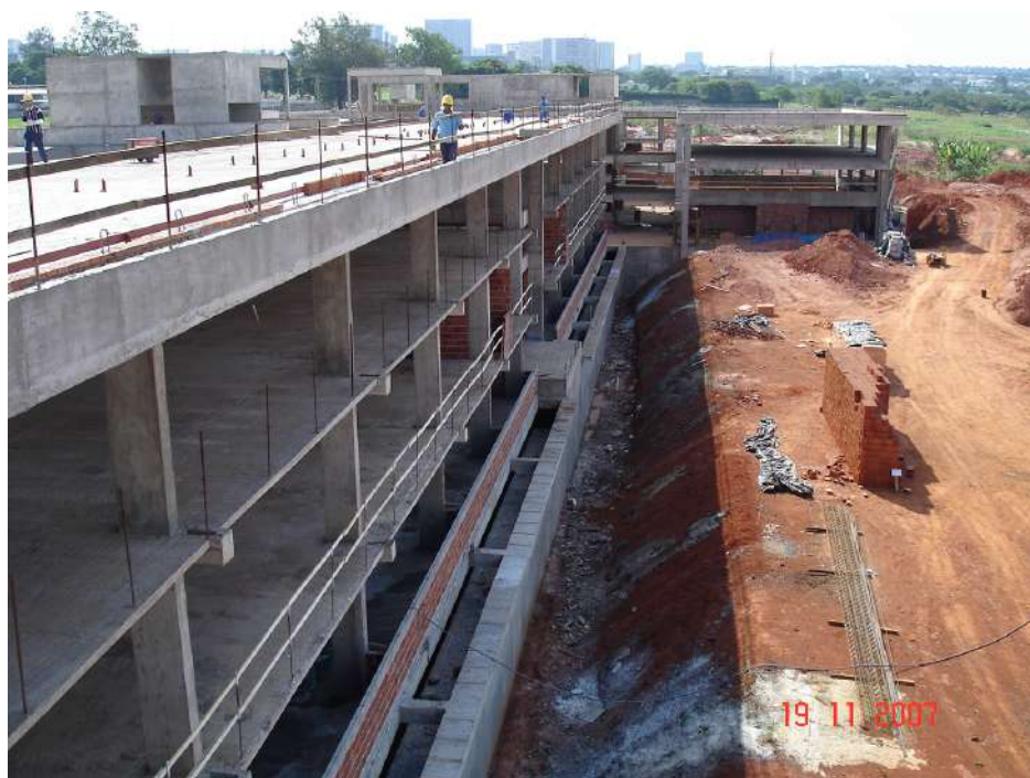
Imagem 3 - Obra de Impermeabilização (Ano 2007)