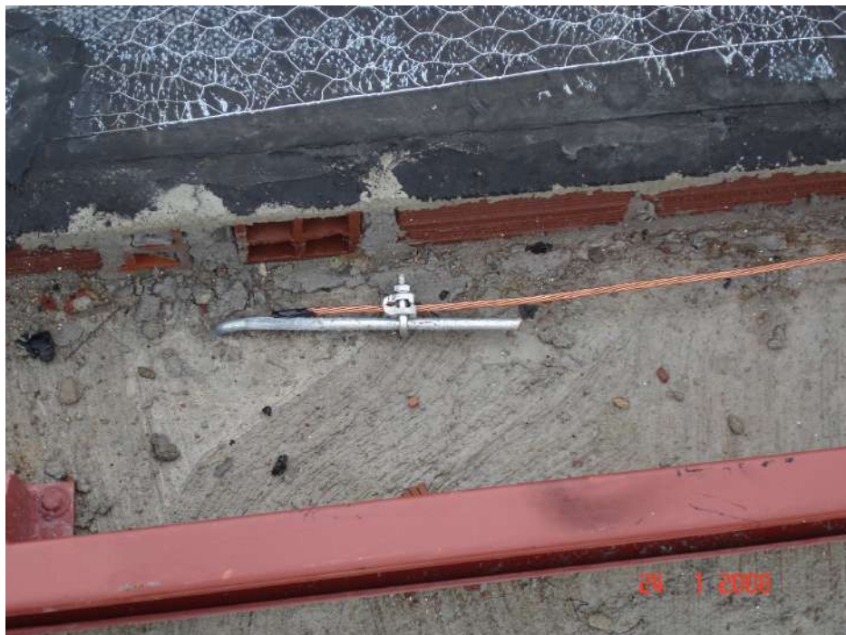
Imagem 11 - Obra de Impermeabilização (Ano 2007)