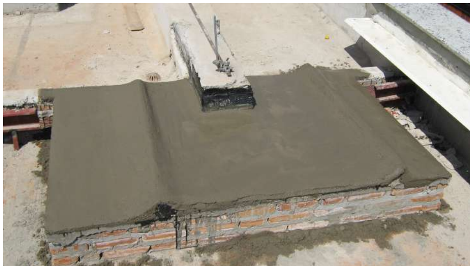
Imagem 27 - Obra de Impermeabilização (Ano 2007)