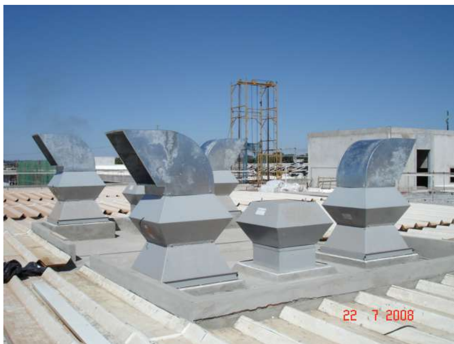
Imagem 24 - Obra de Impermeabilização (Ano 2007)