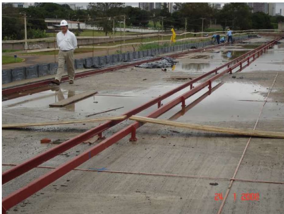
Imagem 13 - Obra de Impermeabilização (Ano 2007)