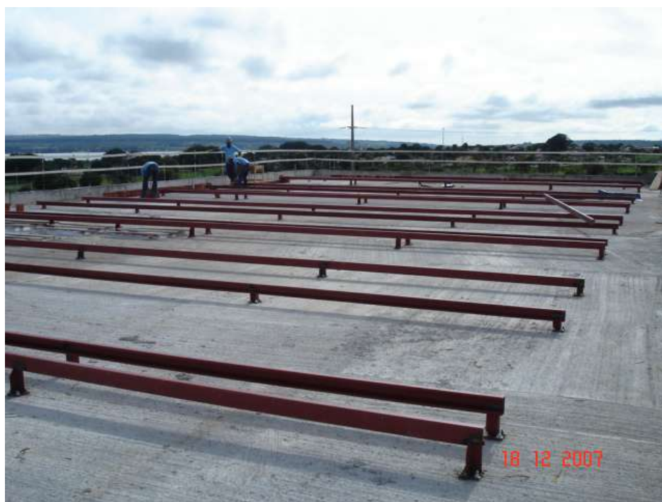
Imagem 46 - Obra de Impermeabilização (Ano 2007)