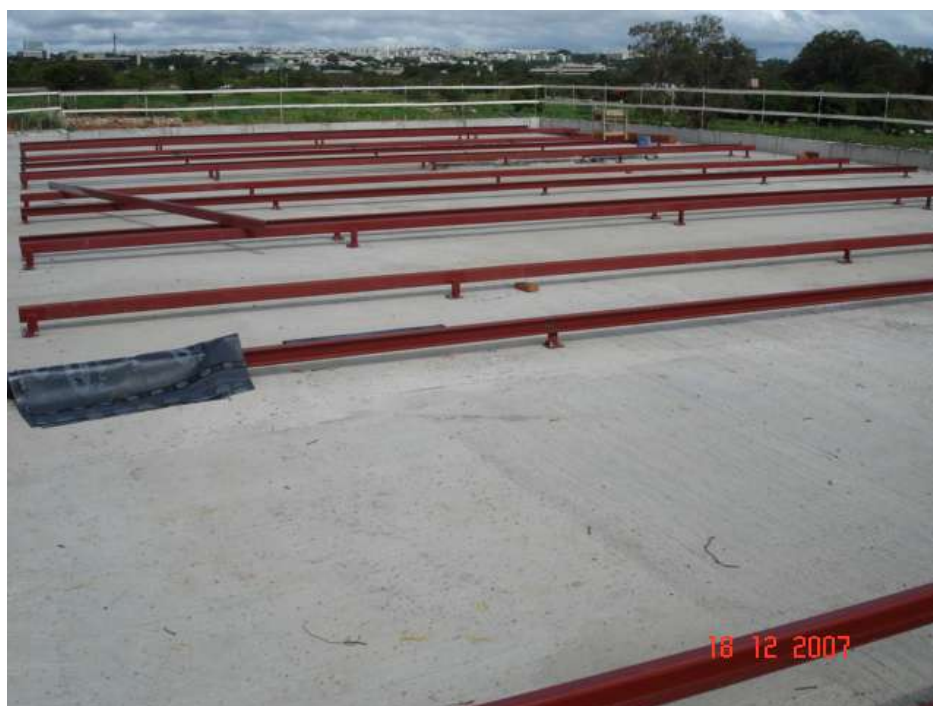
Imagem 44 - Obra de Impermeabilização (Ano 2007)