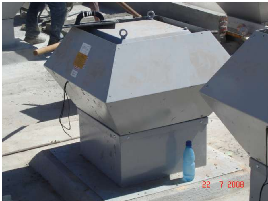
Imagem 19 - Obra de Impermeabilização (Ano 2007)