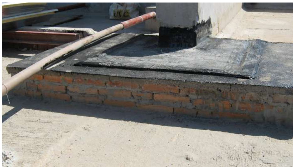
Imagem 26 - Obra de Impermeabilização (Ano 2007)