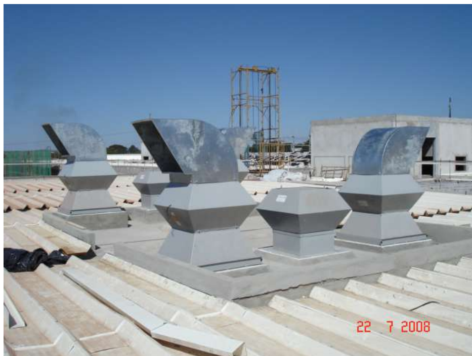
Imagem 23 - Obra de Impermeabilização (Ano 2007)