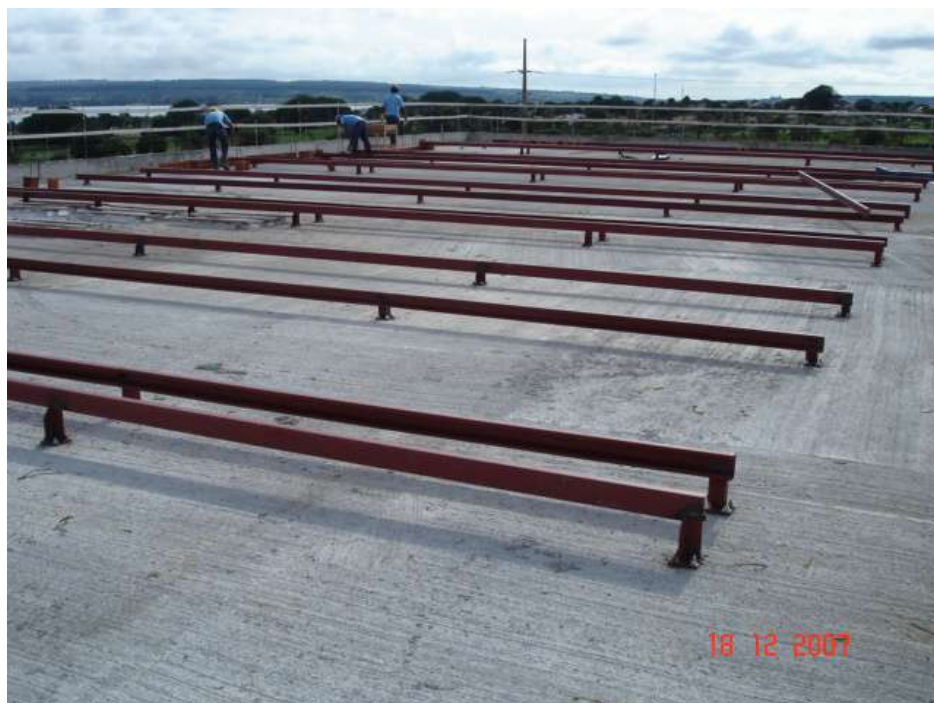
Imagem 47 - Obra de Impermeabilização (Ano 2007)