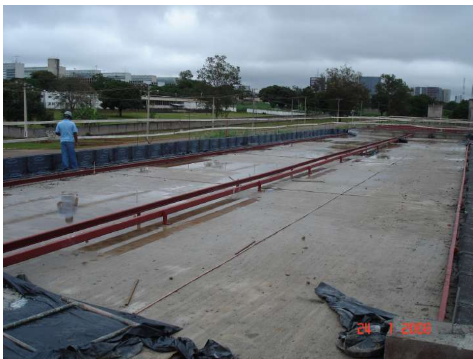
Imagem 14 - Obra de Impermeabilização (Ano 2007)