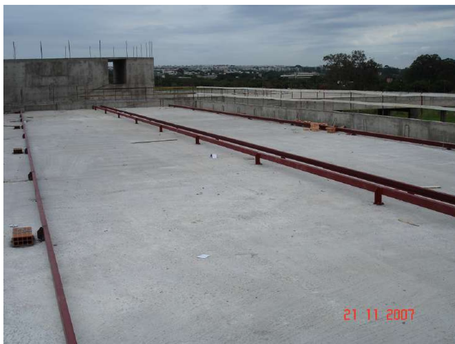
Imagem 6 - Obra de Impermeabilização (Ano 2007)