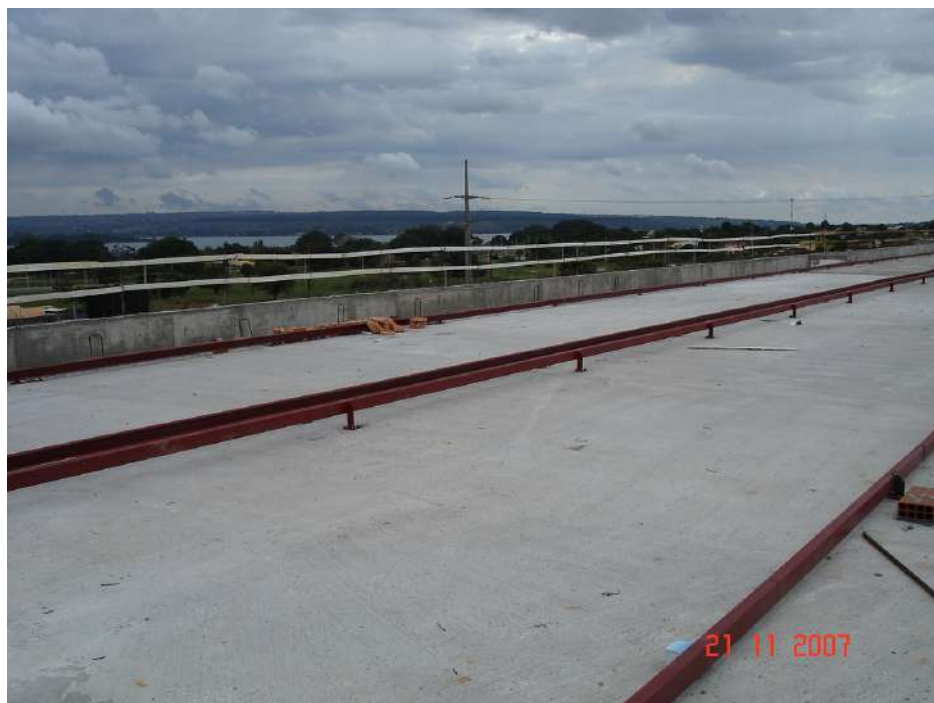
Imagem 5 - Obra de Impermeabilização (Ano 2007)