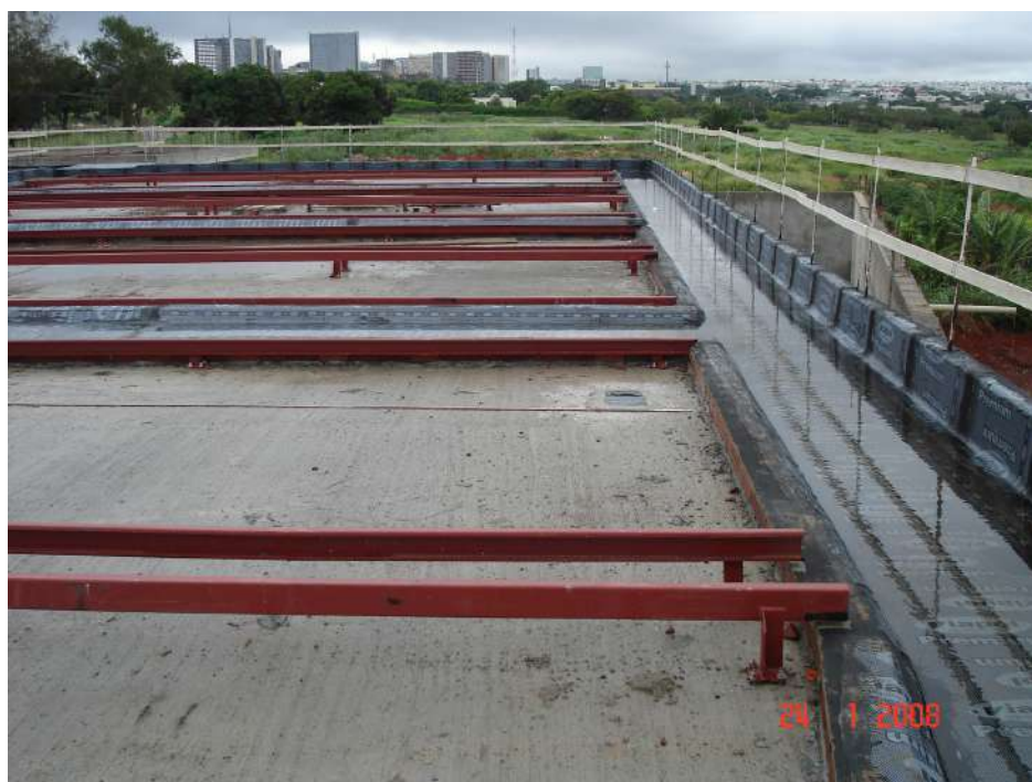
Imagem 10 - Obra de Impermeabilização (Ano 2007)