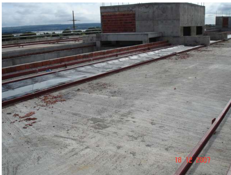
Imagem 42 - Obra de Impermeabilização (Ano 2007)