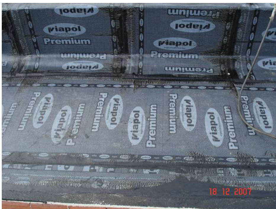
Imagem 40 - Obra de Impermeabilização (Ano 2007)