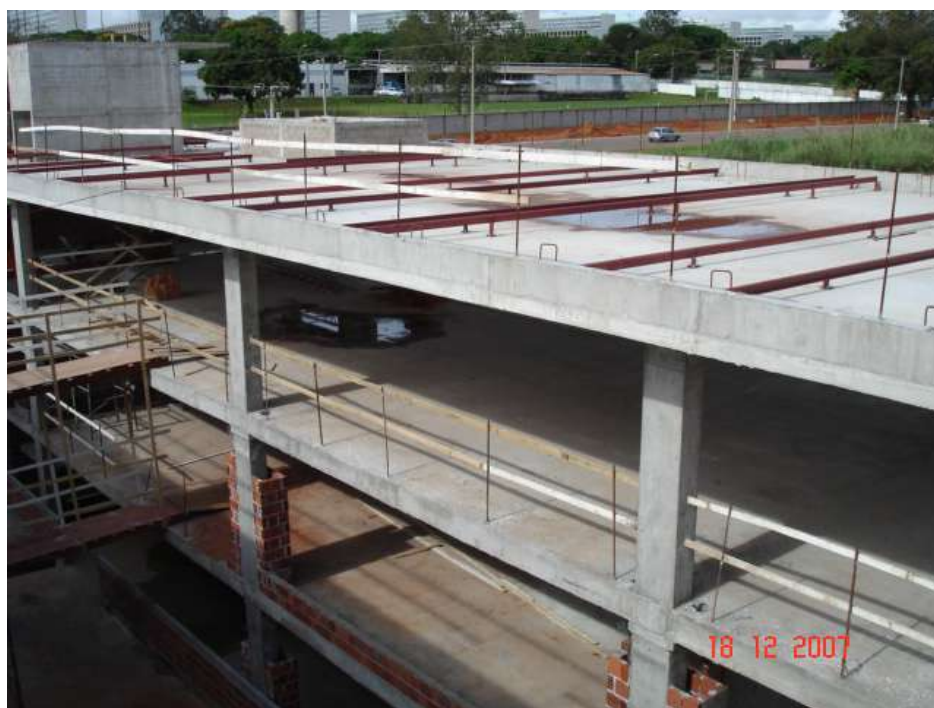
Imagem 48 - Obra de Impermeabilização (Ano 2007)