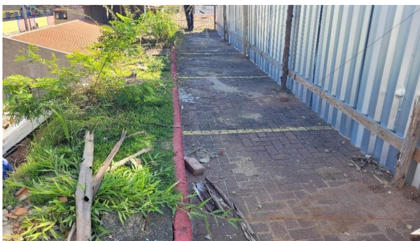
Foto 03 – Vista interna do muro lateral – face oeste, do nível do estacionamento da unidade escolar.