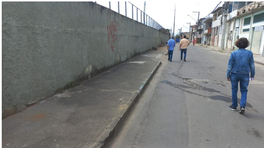
Foto 05 – Vista externa do muro pela face sul (Rua Boa Vista) e situação da calçada.

Notabilizou-se na parte interna do muro da face Sul, um talude que se encontra abarrotado de tocos de árvores que foram suprimidas, tornando o terreno aparentemente não propício ao plantio de outro tipo de cobertura vegetal, grama por exemplo.