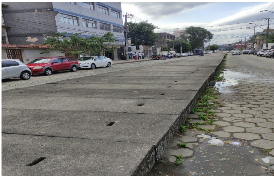
Figura 2: Vista das tampas da galeria

Na figura a seguir temos a situação atual da galeria com as tampas.