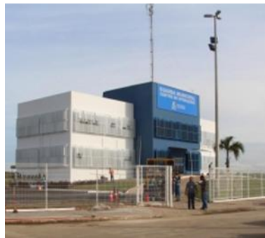
Portão de entrada e saída de veículos

Devido ao grande fluxo de entrada e saída de viaturas no COVV se faz necessário a construção de uma guarita (portaria) para controle de entrada e saída de veículos e de pedestres, que proporcione uma via para entrada e outra para saída de viaturas da Guarda Municipal do centro de operações, possibilitando mais controle e agilidade ao fluxo de viaturas e no atendimento a demandas operacionais.