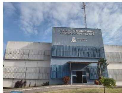
Estado atual da pintura do COVV