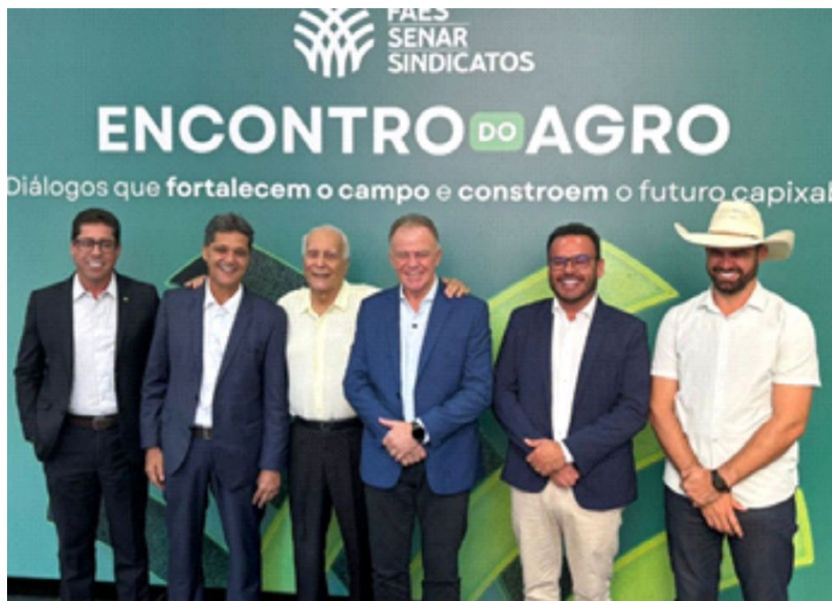
Parceria entre setor produtivo e Legislativo tem gerado resultados positivos

(União), ressaltou que a iniciativa tem gerado resultados concretos para o campo. "Primeiro, a integração, que é mais do que fundamental. Estamos celebrando mais um ano dessa parceria entre a Assembleia e a Federação. É a única parceria de uma Assembleia com uma Federação da Agricultura em que temos