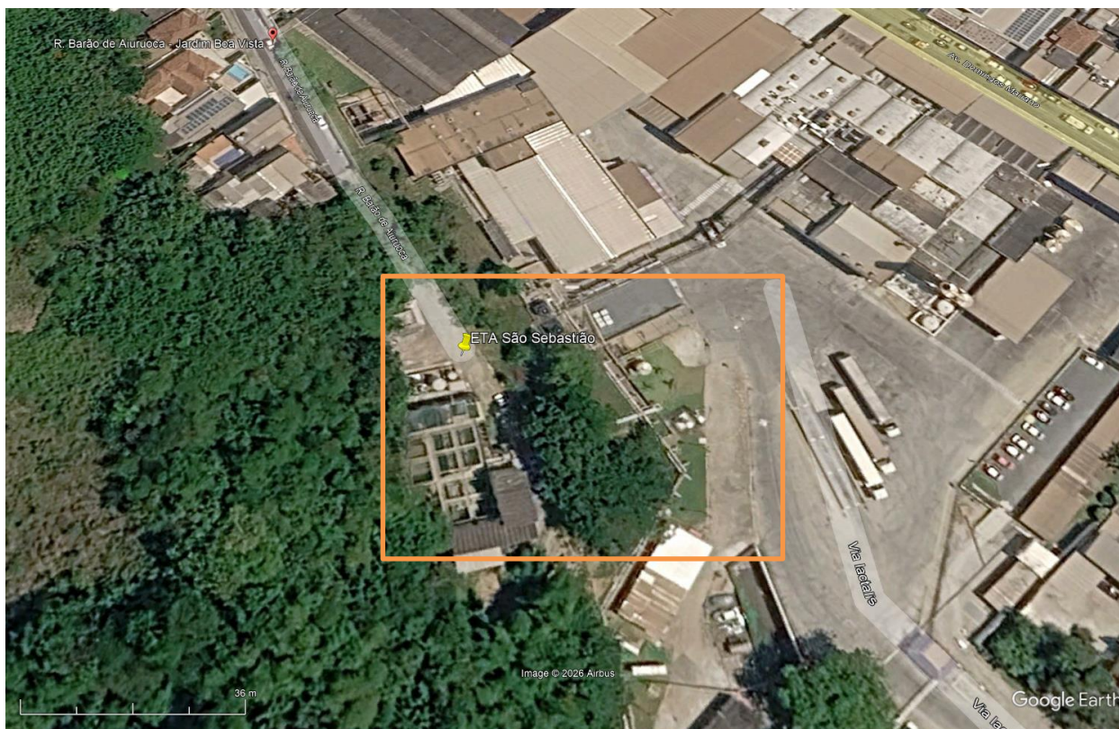
Figura 1: Localização ETA São Sebastião.