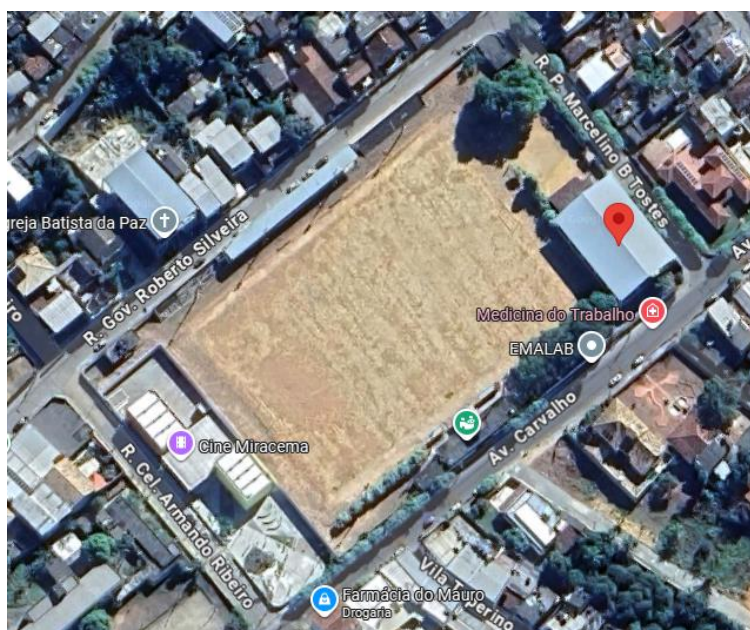
Imagem 02 – Localização da Quadra Jair Polaca, Bairro Santa Tereza.