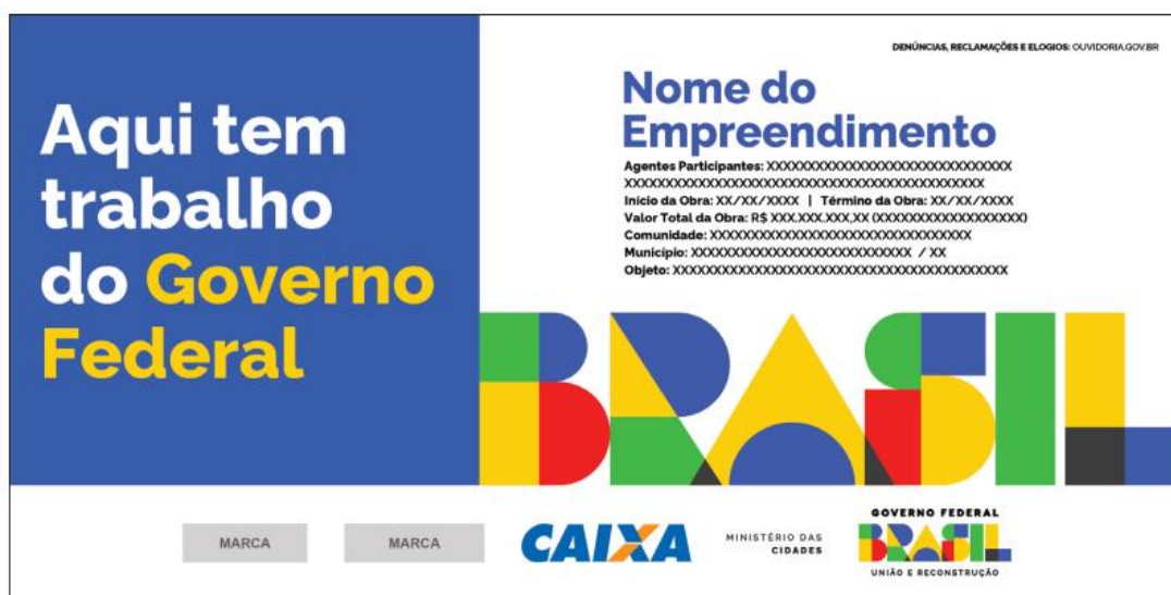
Imagem 03 – Modelo de placa de obra

A fixação da placa deverá estar de acordo com o projeto de situação fornecido, ou de acordo com orientação da Fiscalização da Contratante, sendo instalada em local visível, preferencialmente no acesso principal da obra ou voltada para a via que favoreça melhor sua visualização.