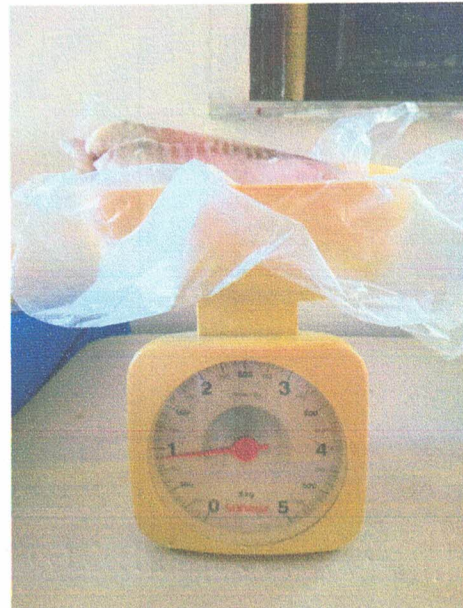
Item 05: Peso descongelado (0,9 g)