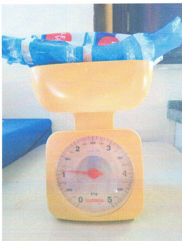
Item 06: Peso congelado (1,1 kg)