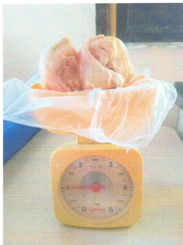
Item 06: Peso descongelado (1 kg)