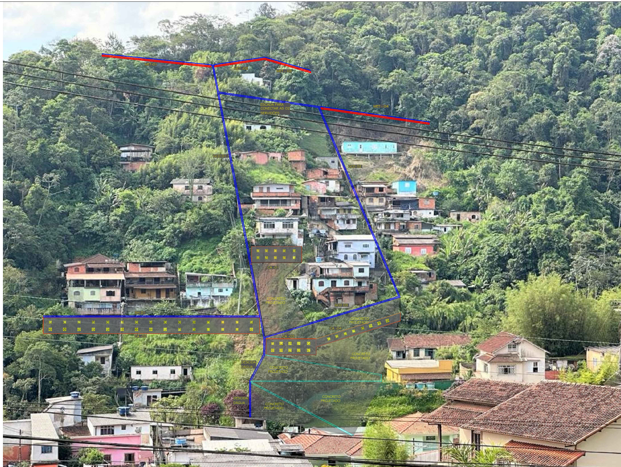
1 ESQUEMA DAS INTERVENÇÕES A SEREM EXECUTADAS NO LOCAL SEM ESCALA