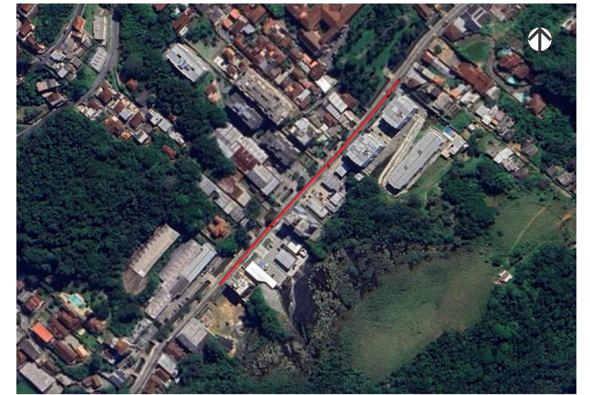
02 VISTA AÉREA - ÁREA DE INTERVENÇÃO GALERIA 09 ESCALA GRÁFICA