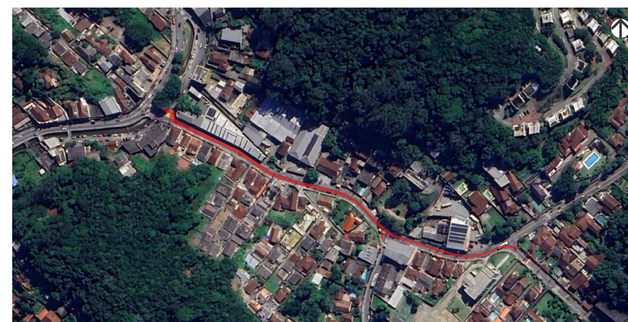
02 VISTA AÉREA - ÁREA DE INTERVENÇÃO GALERIA 08 ESCALA GRÁFICA