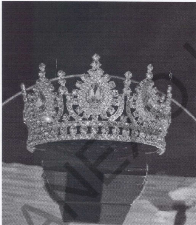
Imagem Meramente Ilustrativa da Coroa

14.3.7 Providenciar, a disponibilização de uma coroa metálica na cor prata com cristais, com medidas aproximadas de 11 cm de altura, diâmetro entre 33 cm e 43 cm e aproximadamente 18 cm entre as extremidades com strass, confeccionada em liga de zinco banhada a prata com aplicação de pedras de strass (segue abaixo imagem meramente ilustrativa):