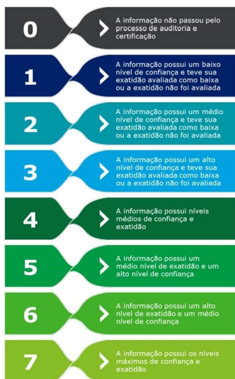
Figura 2 - Descrição das Certificações Atribuíveis às Informações do SINISA

3.9 Entende-se que, caso uma informação seja avaliada com o nível de confiança mínimo, essa não deve ter a sua exatidão avaliada (“N/A”), já que os controles internos não são capazes de gerar dados confiáveis para a execução dos testes substantivos. Assim, as informações com baixo nível de confiança são sempre certificadas com a nota de certificação 1, conforme indicado na matriz de certificação.