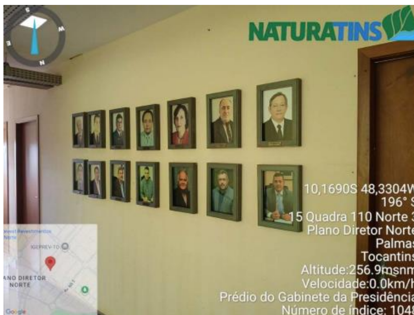
Local de execução do objeto