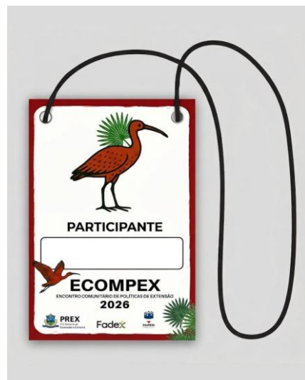
Crachá com o cordão