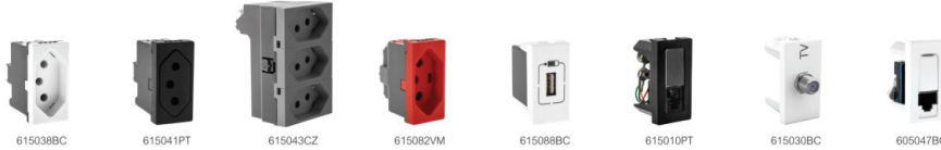
Dimensões p. 25 a 29 Esquema de ligação p. 29 a 33