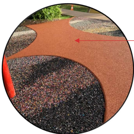
IMAGEM EM SBR