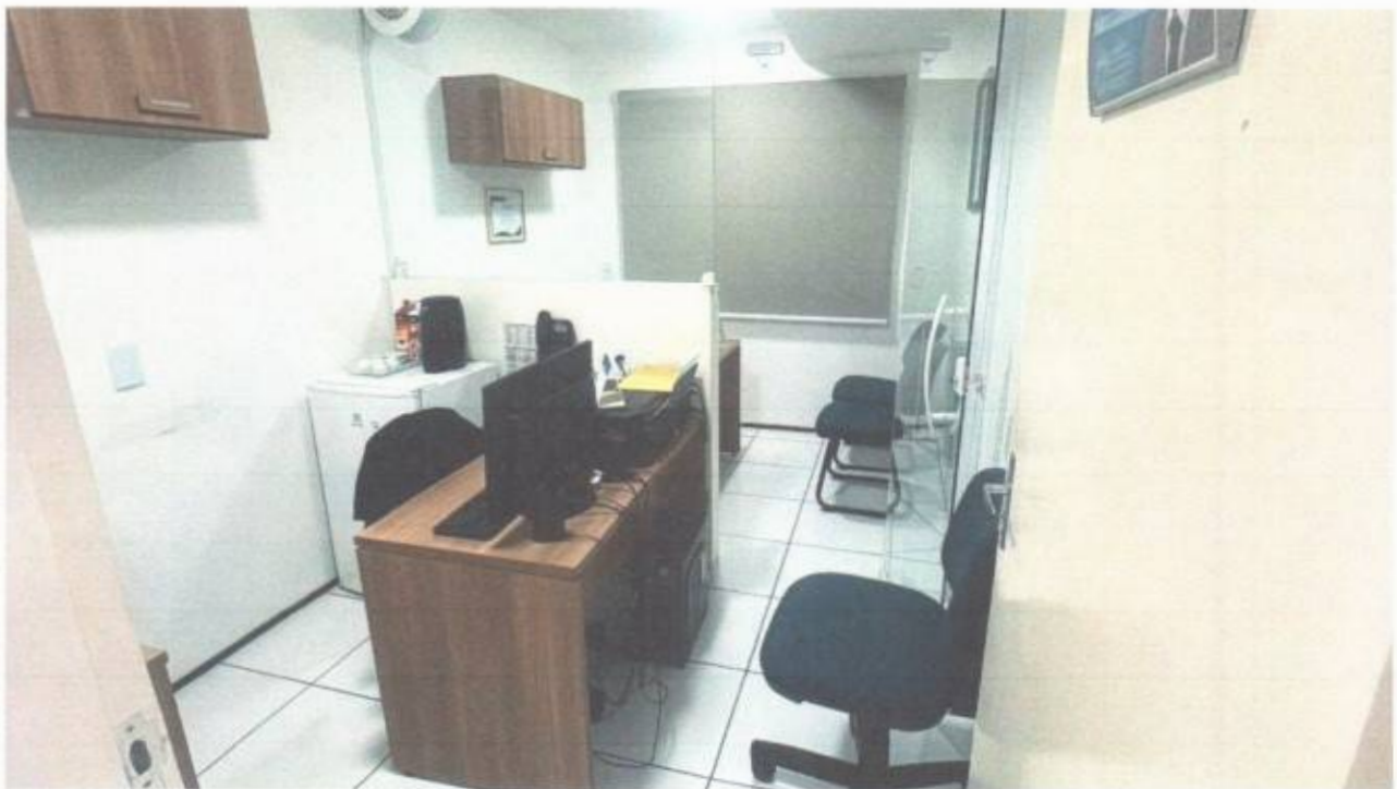
Vista do gabinete de vereador no pavimento superior do prédio da Câmara Municipal de São Gonçalo do Amarante-CE