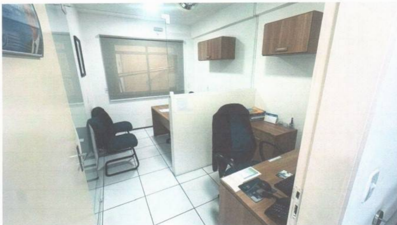
Vista do gabinete de vereador no pavimento superior do prédio da Câmara Municipal de São Gonçalo do Amarante-CE