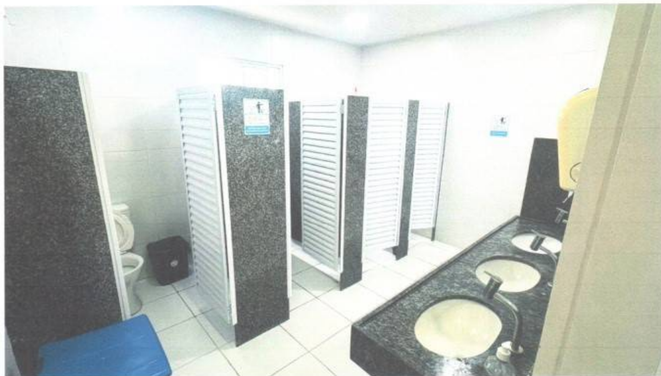
Vista interna do banheiro social masculino no térreo do prédio da Câmara Municipal de São Gonçalo do Amarante-CE