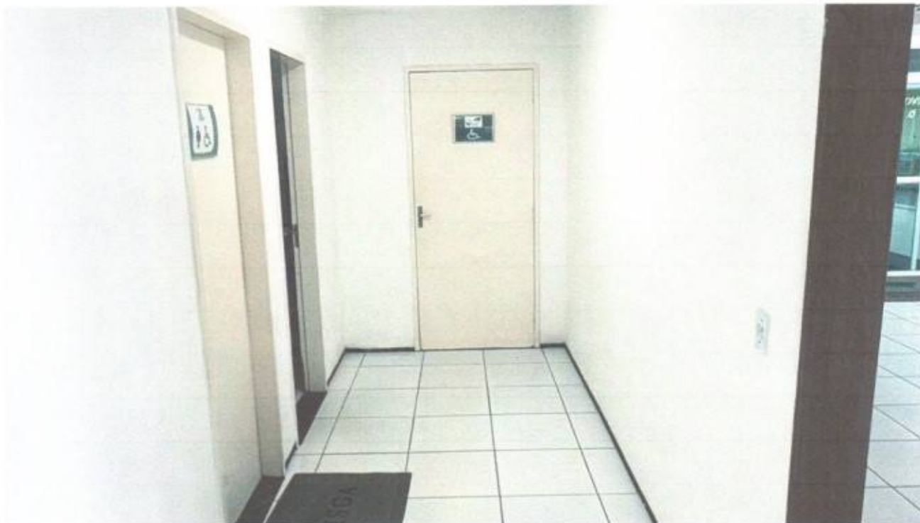
Vista do acesso aos banheiros no térreo do prédio da Câmara Municipal de São Gonçalo do Amarante-CE