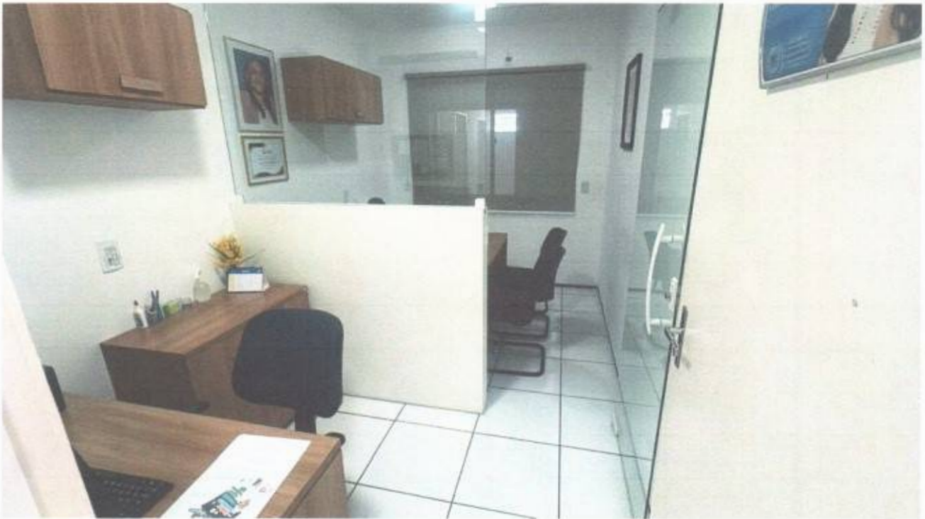
Vista do gabinete de vereador no pavimento superior do prédio da Câmara Municipal de São Gonçalo do Amarante-CE