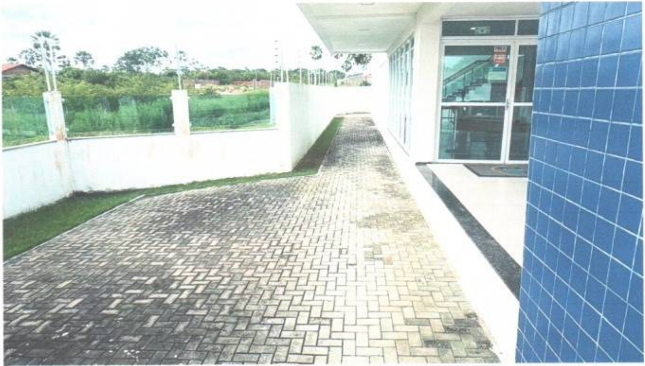
Vista do passeio interno do prédio da Câmara Municipal de São Gonçalo do Amarante-CE