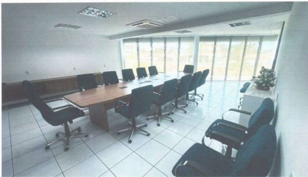
Vista da sala geral de reunião no pavimento superior do prédio da Câmara Municipal de São Gonçalo do Amarante-CE