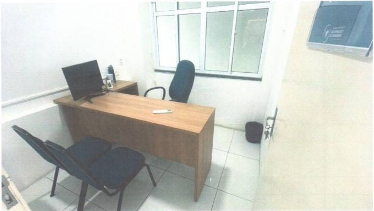
Vista da sala da ouvidoria no pavimento superior do prédio da Câmara Municipal de São Gonçalo do Amarante-CE