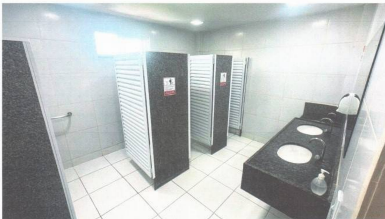
Vista do banheiro social feminino no pavimento superior do prédio da Câmara Municipal de São Gonçalo do Amarante-CE