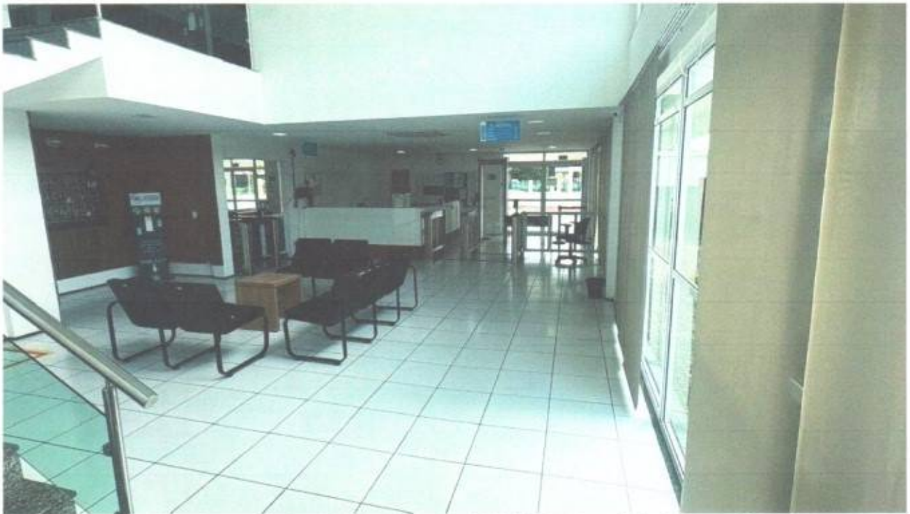
Vista da recepção do prédio da Câmara Municipal de São Gonçalo do Amarante-CE