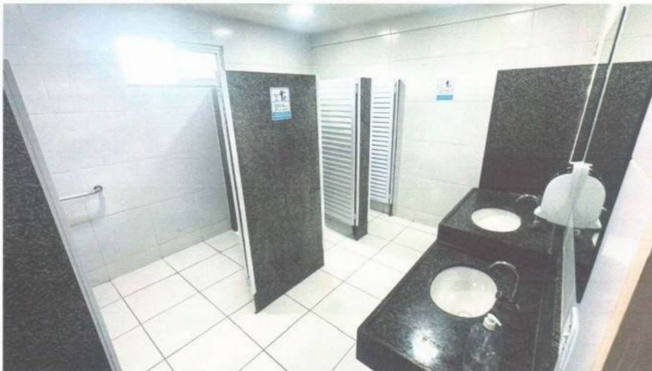
Vista do banheiro social masculino no pavimento superior do prédio da Câmara Municipal de São Gonçalo do Amarante-CE