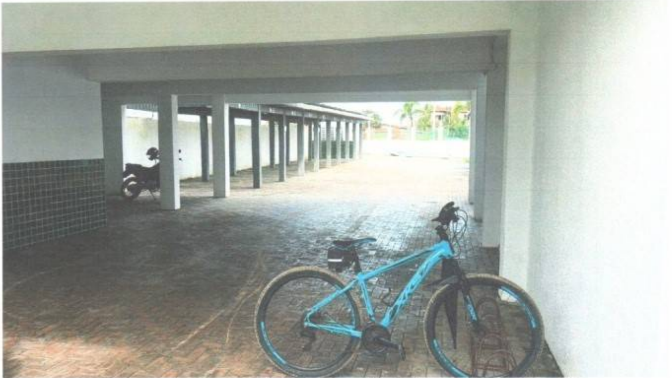
Vista do estacionamento do prédio da Câmara Municipal de São Gonçalo do Amarante-CE