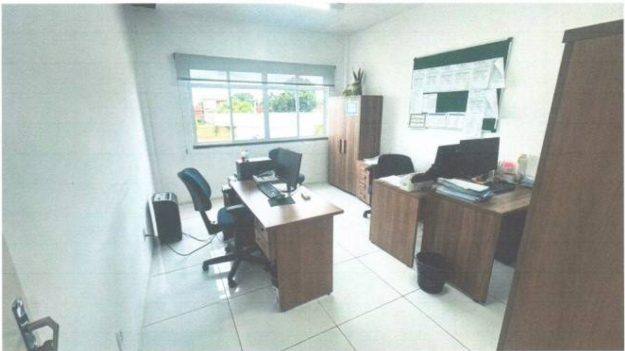
Vista da sala da diretoria legislativa no pavimento superior do prédio da Câmara Municipal de São Gonçalo do Amarante-CE