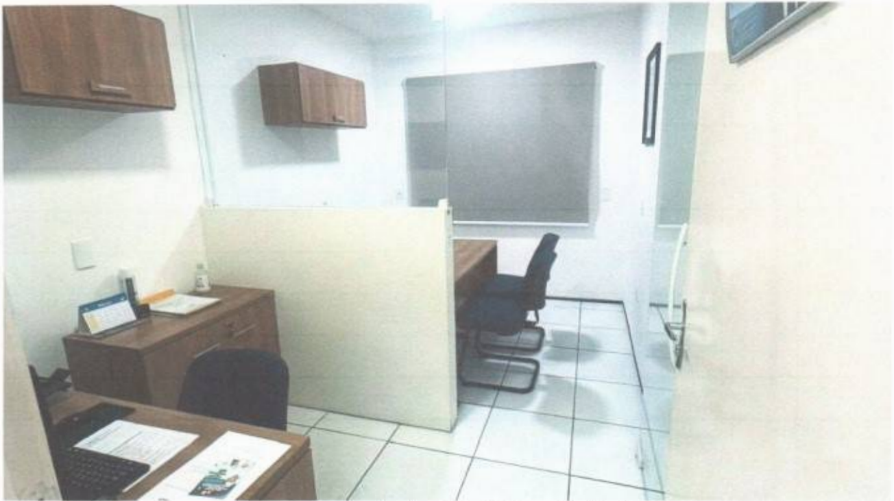
Vista do gabinete de vereador no pavimento superior do prédio da Câmara Municipal de São Gonçalo do Amarante-CE