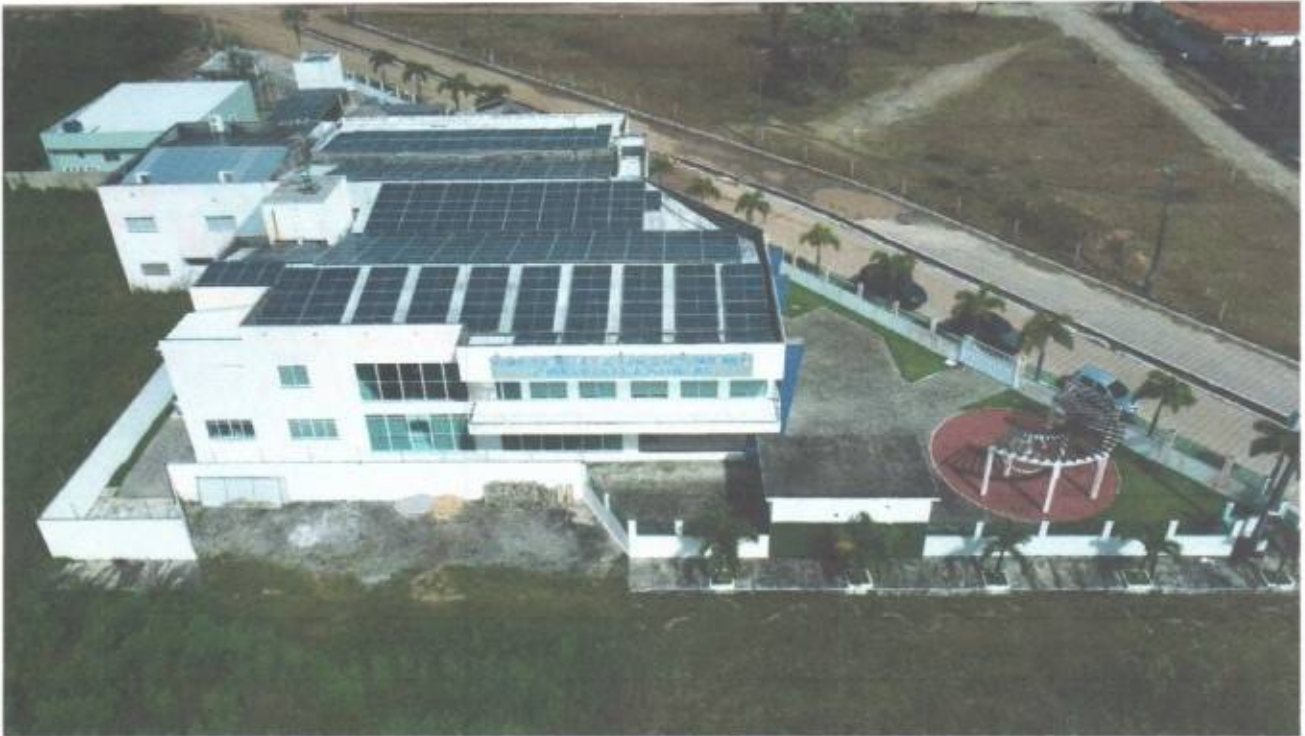
Vista aérea dos fundos da Câmara Municipal de São Gonçalo do Amarante-CE