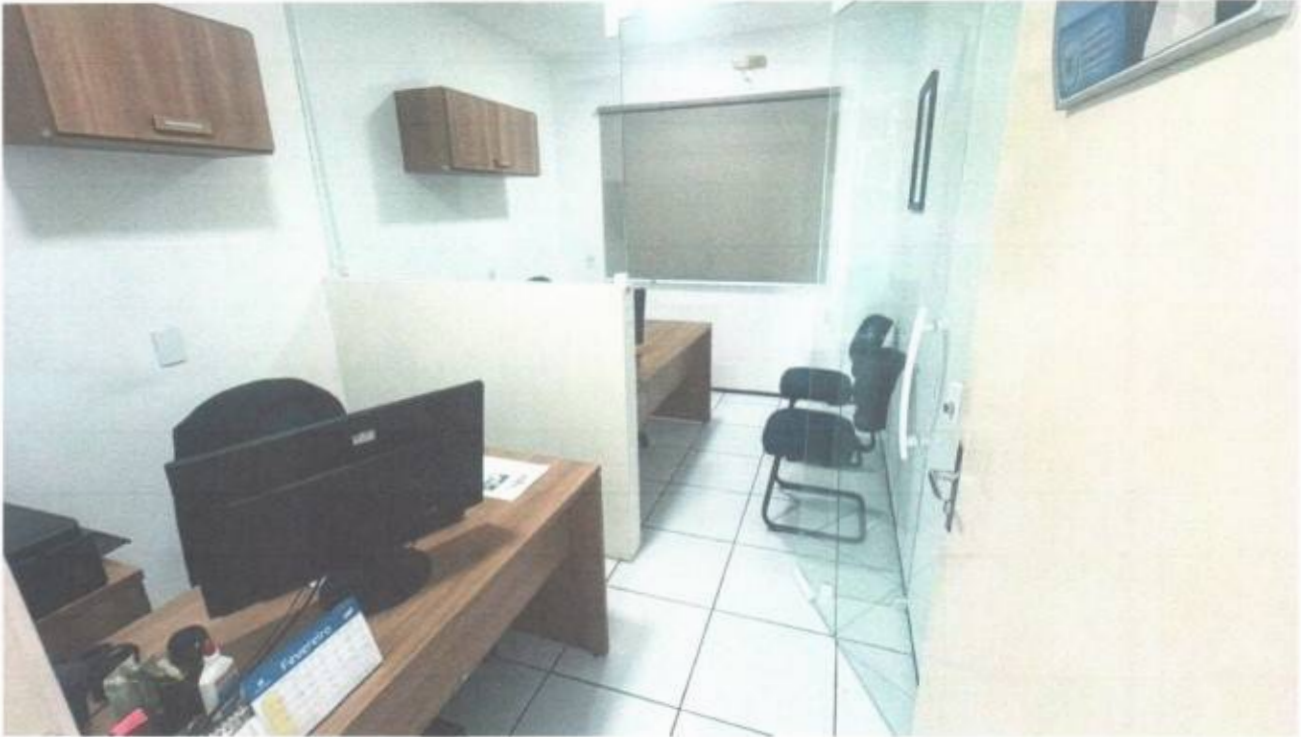
Vista do gabinete de vereador no pavimento superior do prédio da Câmara Municipal de São Gonçalo do Amarante-CE