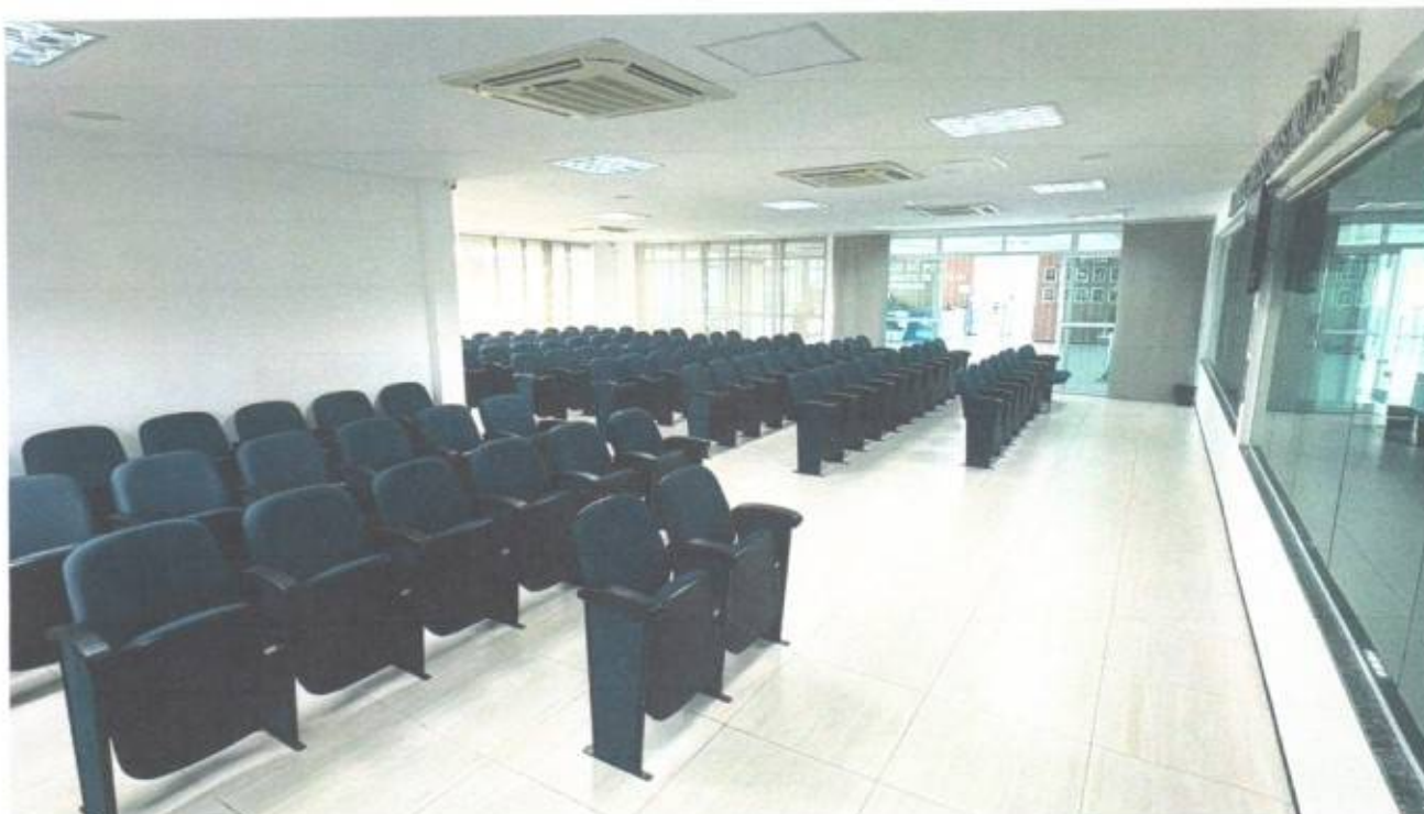
Vista do auditório do prédio da Câmara Municipal de São Gonçalo do Amarante-CE