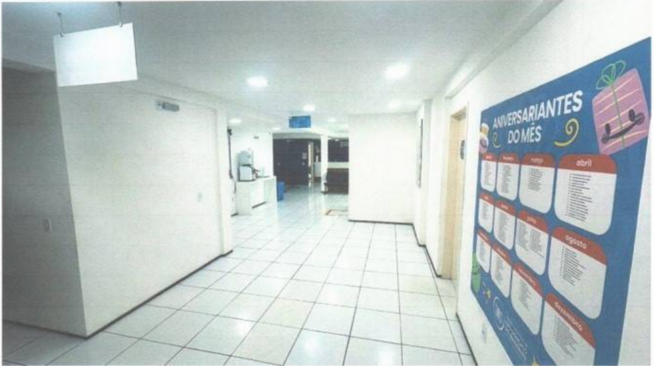
Vista da área de circulação no pavimento superior do prédio da Câmara Municipal de São Gonçalo do Amarante-CE