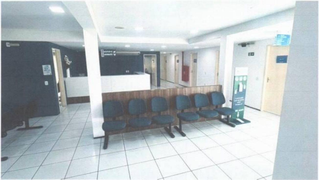
Vista da recepção do pavimento superior do prédio da Câmara Municipal de São Gonçalo do Amarante-CE

do prédio da Câmara Municipal de São Gonçalo do Amarante-CE