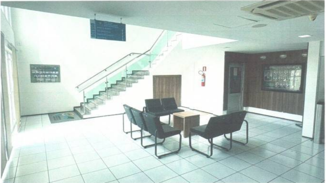
Vista da recepção do prédio da Câmara Municipal de São Gonçalo do Amarante-CE