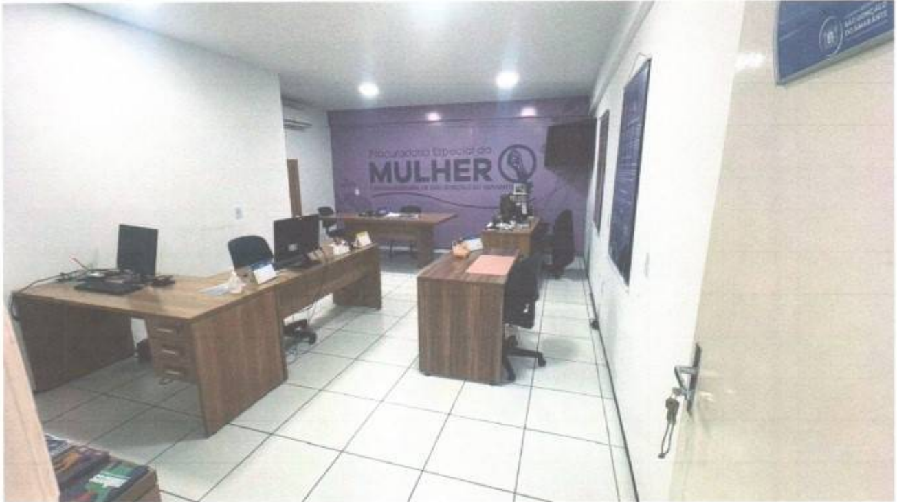
Vista da procuradoria da mulher no pavimento superior do prédio da Câmara Municipal de São Gonçalo do Amarante-CE