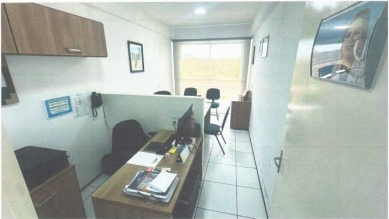
Vista do gabinete de vereador no pavimento superior do prédio da Câmara Municipal de São Gonçalo do Amarante-CE