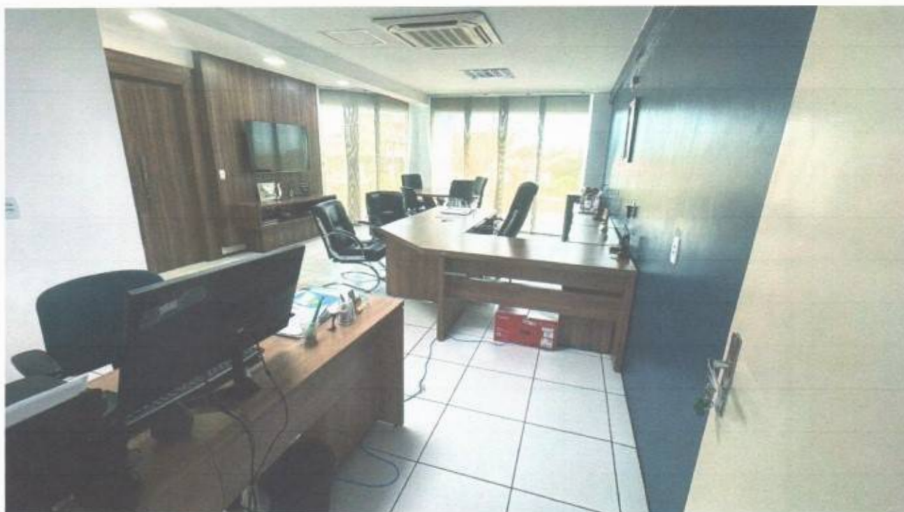
Vista do gabinete de presidente no pavimento superior do prédio da Câmara Municipal de São Gonçalo do Amarante-CE