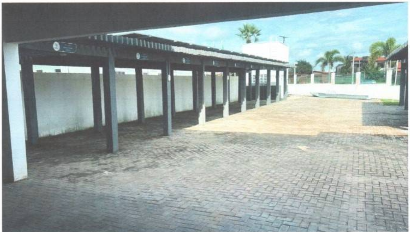
Vista do estacionamento do prédio da Câmara Municipal de São Gonçalo do Amarante-CE