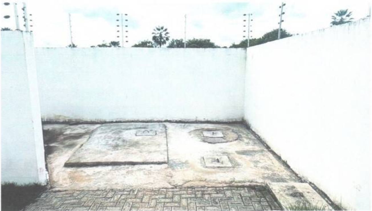
Vista dos fundos do prédio da Câmara Municipal de São Gonçalo do Amarante-CE