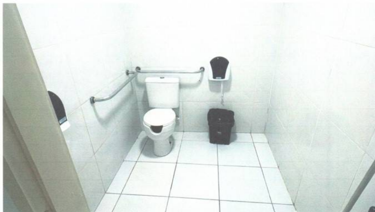
Vista interna do banheiro social para PCD no térreo do prédio da Câmara Municipal de São Gonçalo do Amarante-CE