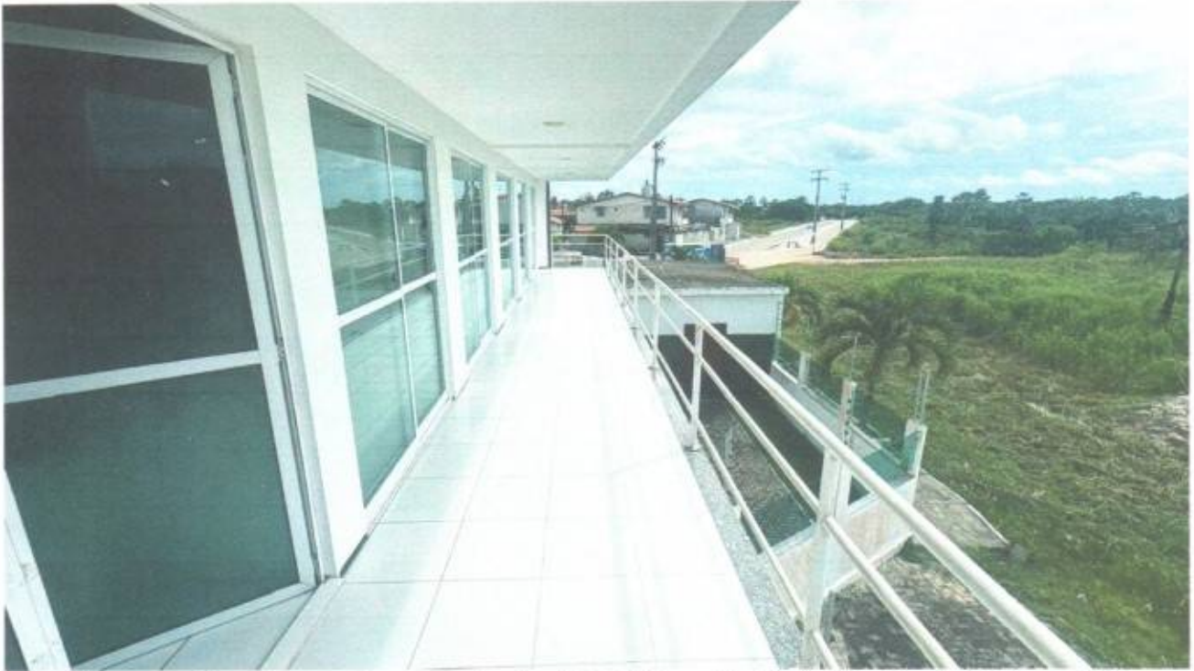
Vista externa da sacada no pavimento superior do prédio da Câmara Municipal de São Gonçalo do Amarante-CE