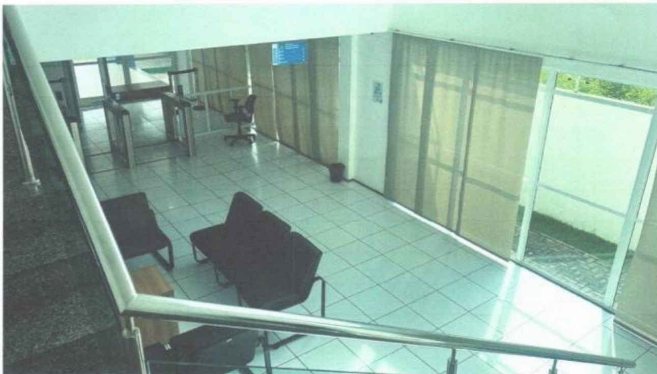
Vista do acesso pelas escadas ao pavimento superior do prédio da Câmara Municipal de São Gonçalo do Amarante-CE