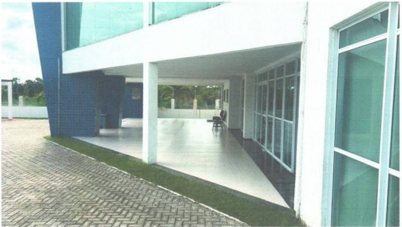
Vista lateral do prédio da Câmara Municipal de São Gonçalo do Amarante-CE