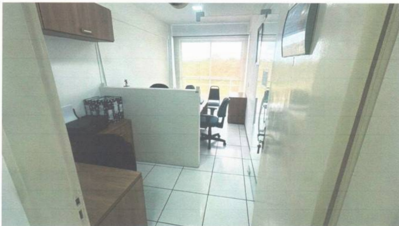
Vista do gabinete de vereador no pavimento superior do prédio da Câmara Municipal de São Gonçalo do Amarante-CE