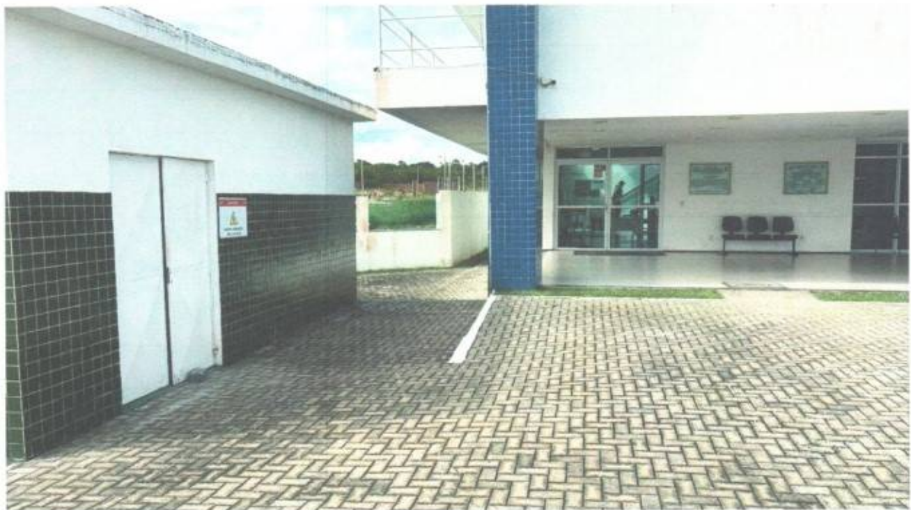
Vista frontal do prédio da Câmara Municipal de São Gonçalo do Amarante-CE