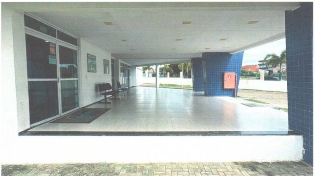
Vista lateral do prédio da Câmara Municipal de São Gonçalo do Amarante-CE