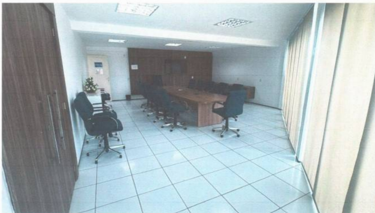
Vista da sala geral de reunião no pavimento superior do prédio da Câmara Municipal de São Gonçalo do Amarante-CE