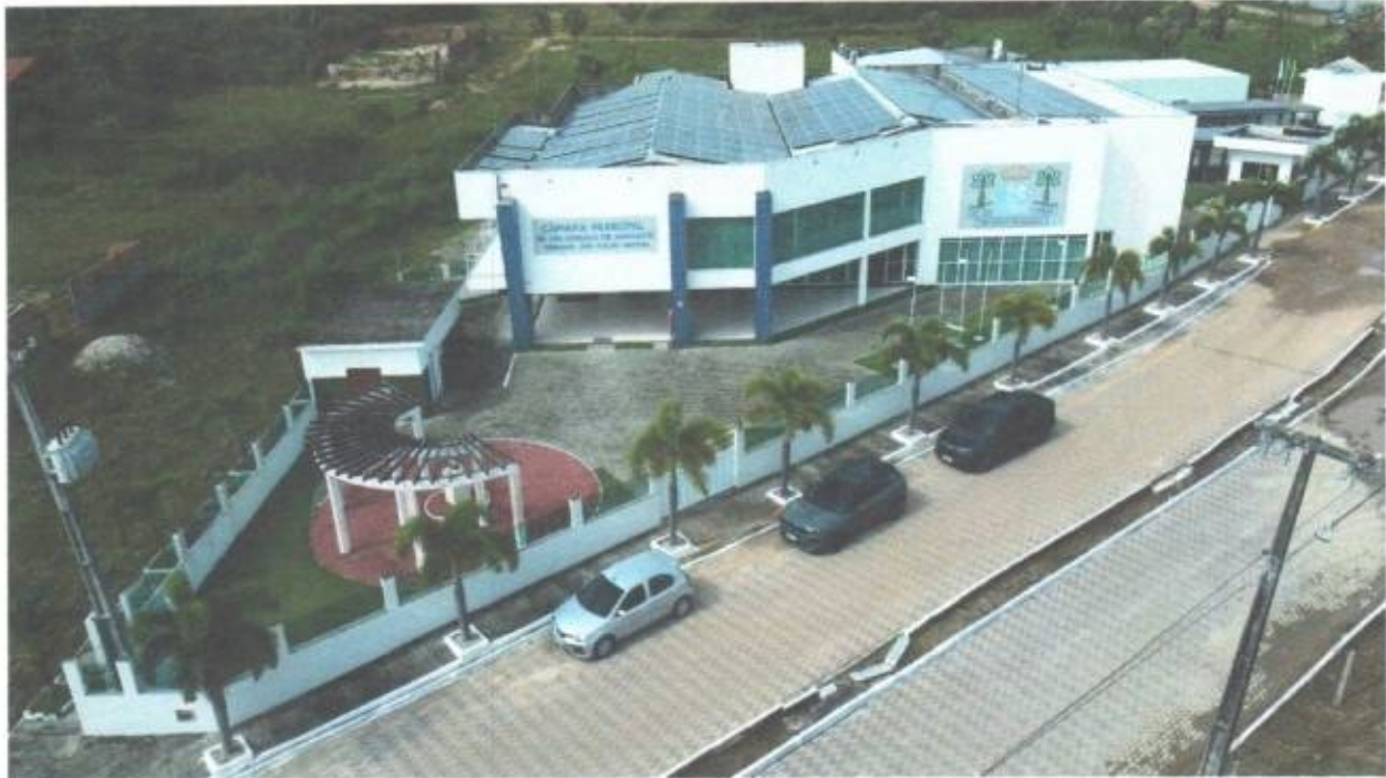
Vista aérea frontal da Câmara Municipal de São Gonçalo do Amarante-CE