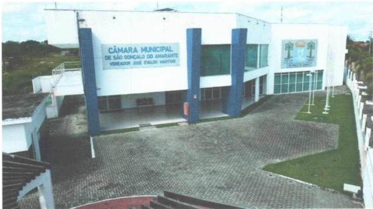
Vista aérea frontal da Câmara Municipal de São Gonçalo do Amarante-CE