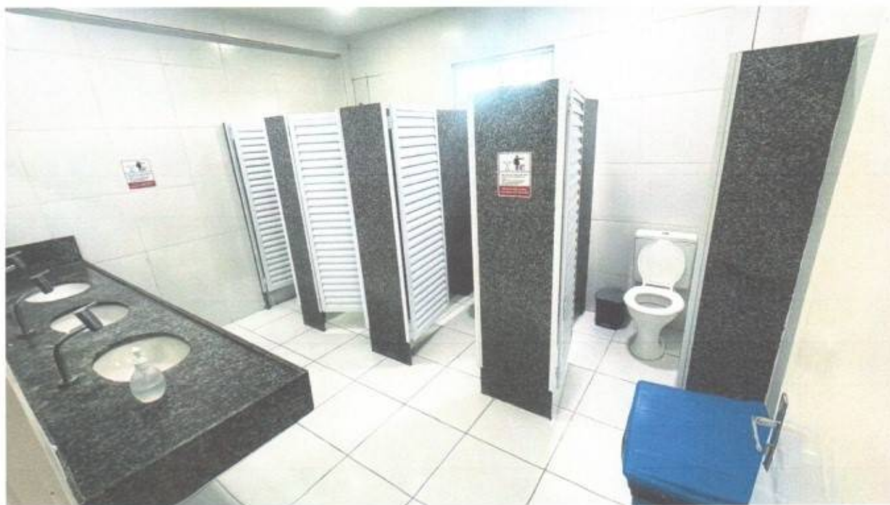
Vista interna do banheiro social feminino no térreo do prédio da Câmara Municipal de São Gonçalo do Amarante-CE