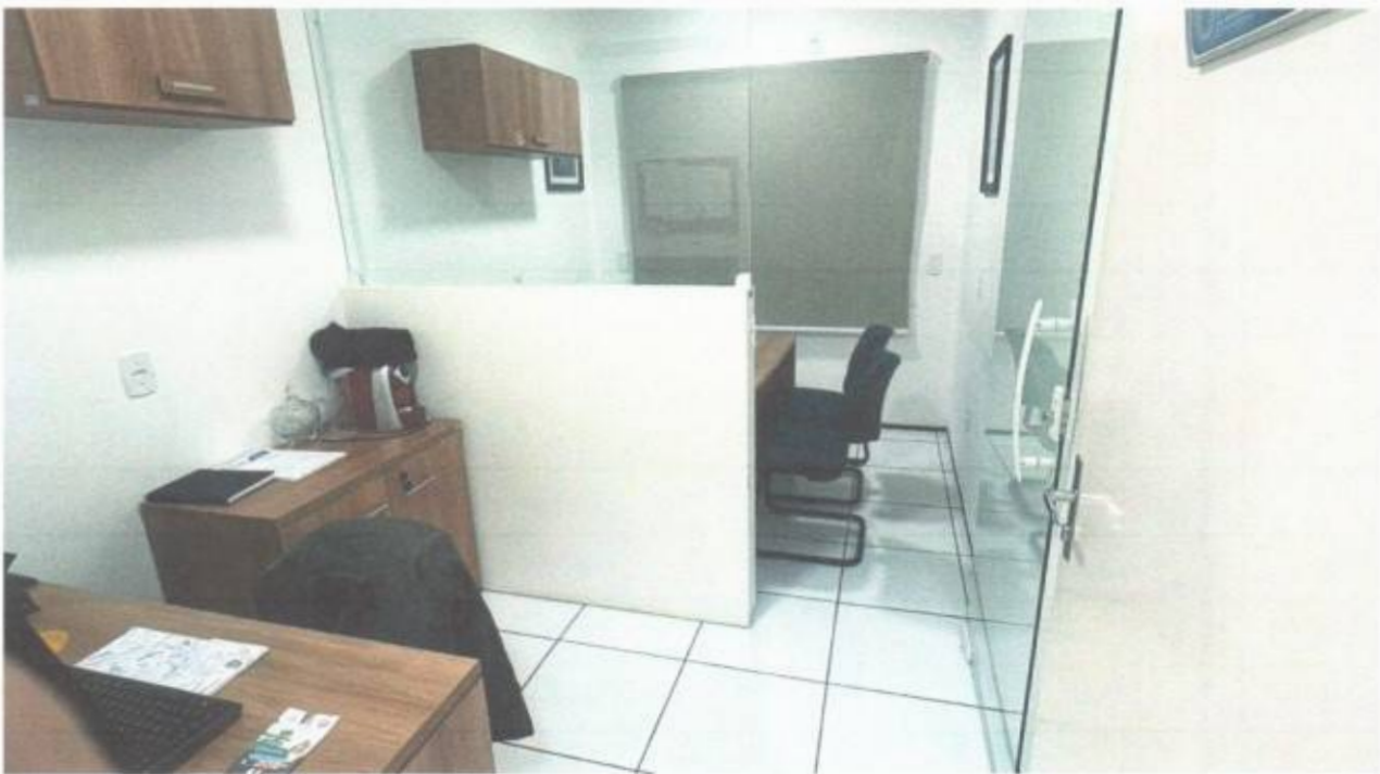
Vista do gabinete de vereador no pavimento superior do prédio da Câmara Municipal de São Gonçalo do Amarante-CE