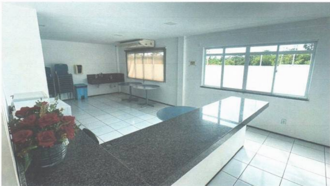
Vista do refeitório do prédio da Câmara Municipal de São Gonçalo do Amarante-CE