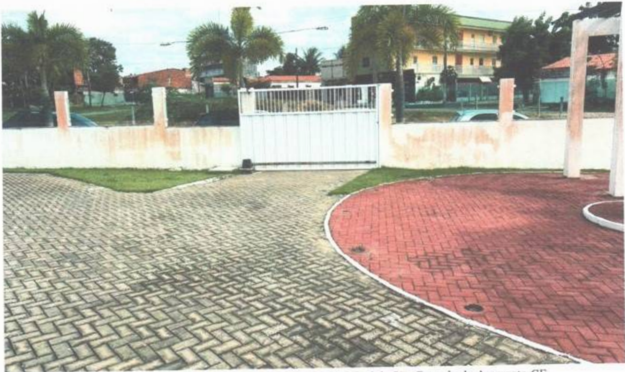
Vista do portão de acesso principal da Câmara Municipal de São Gonçalo do Amarante-CE