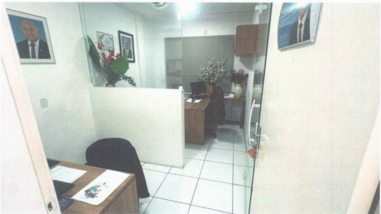
Vista do gabinete de vereador no pavimento superior do prédio da Câmara Municipal de São Gonçalo do Amarante-CE