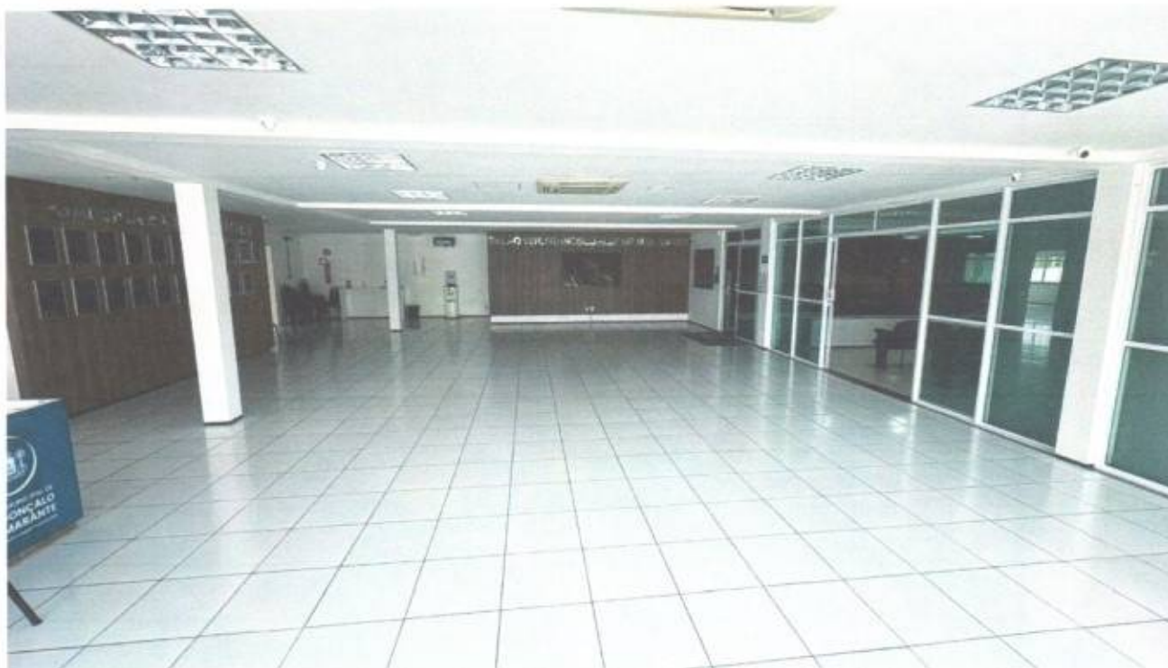
Vista do salão principal do prédio da Câmara Municipal de São Gonçalo do Amarante-CE