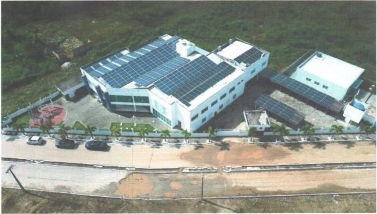
Vista aérea frontal e lateral da Câmara Municipal de São Gonçalo do Amarante-CE