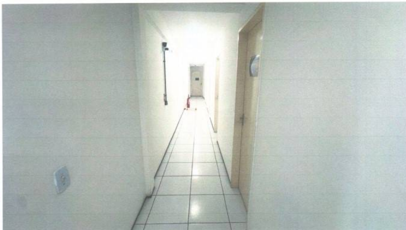
Vista do acesso aos gabinetes dos vereadores no pavimento superior do prédio da Câmara Municipal de São Gonçalo do Amarante-CE