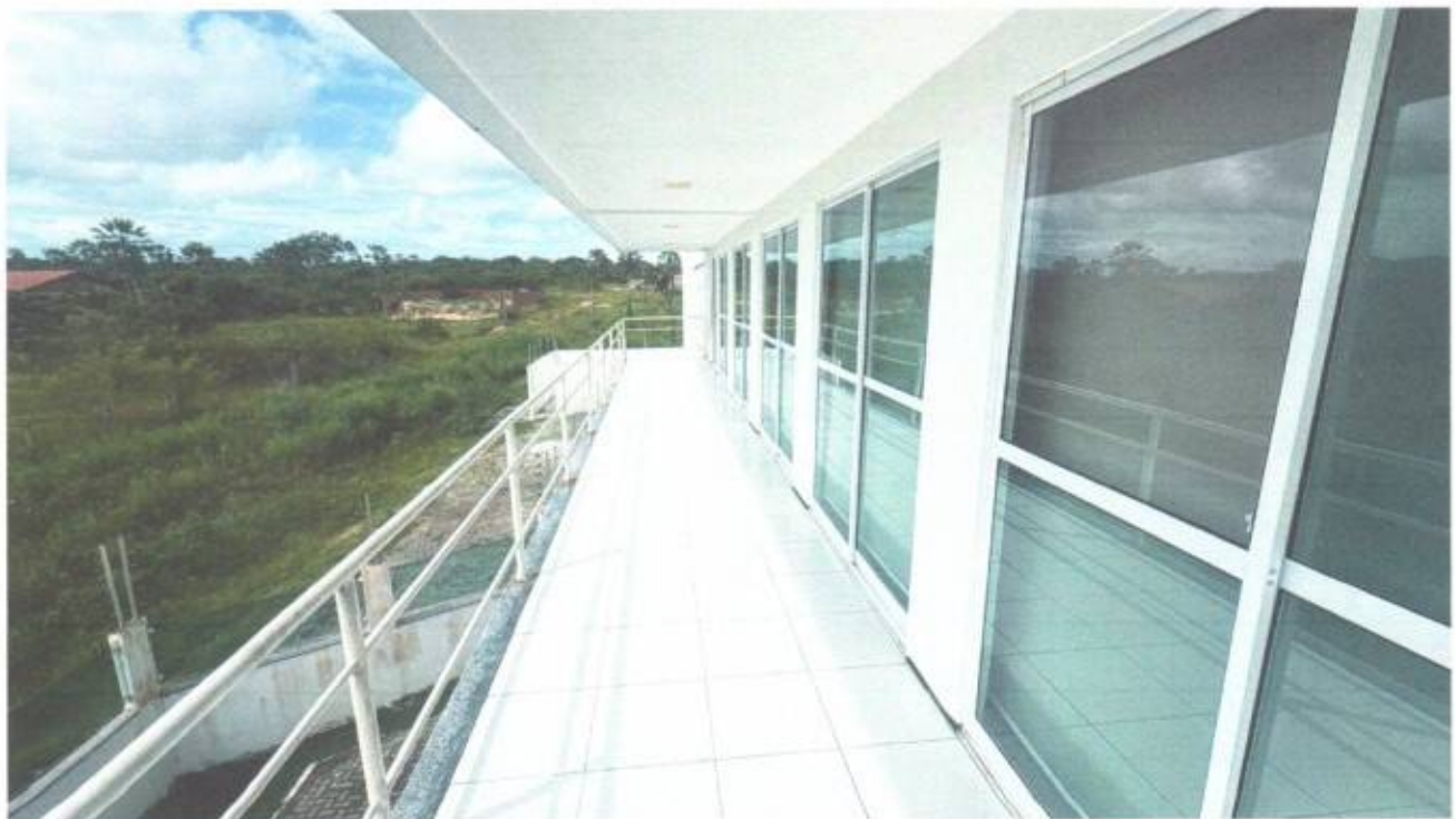
Vista externa da sacada no pavimento superior do prédio da Câmara Municipal de São Gonçalo do Amarante-CE