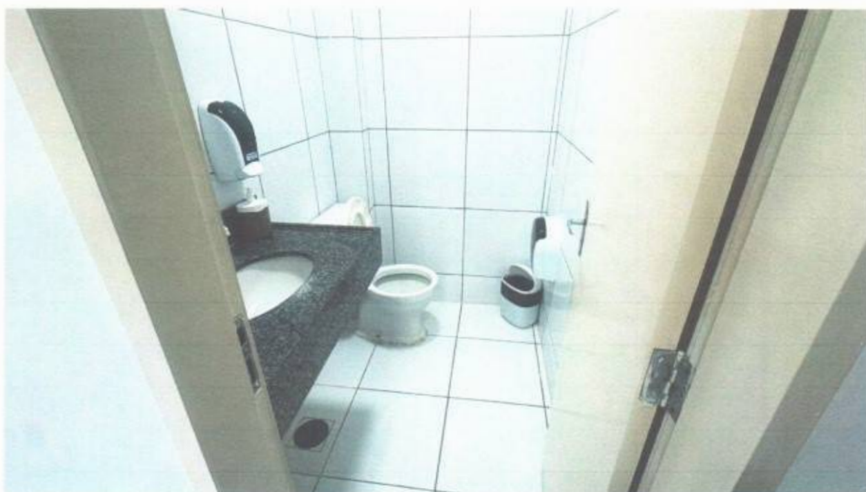
Vista do banheiro no gabinete de presidente no pavimento superior do prédio da Câmara Municipal de São Gonçalo do Amarante-CE