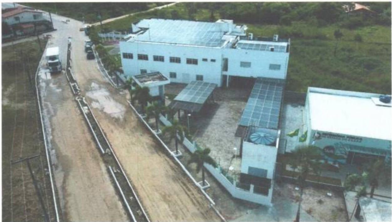
Vista aérea lateral e fundos da Câmara Municipal de São Gonçalo do Amarante-CE