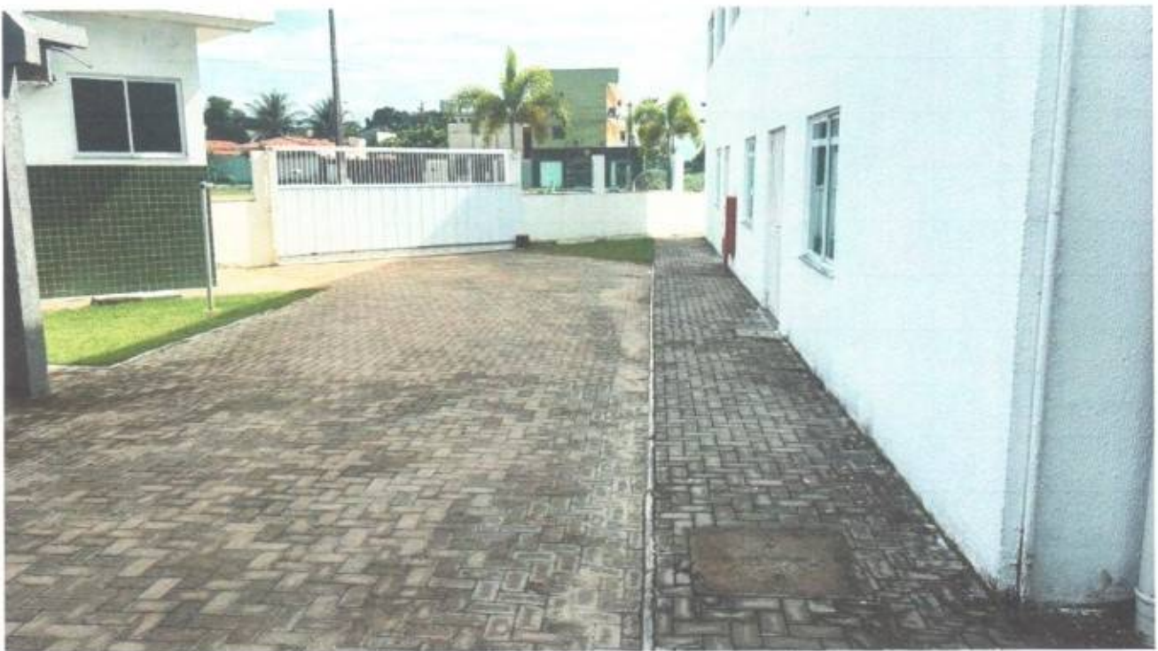
Vista do portão de acesso à garagem da Câmara Municipal de São Gonçalo do Amarante-CE