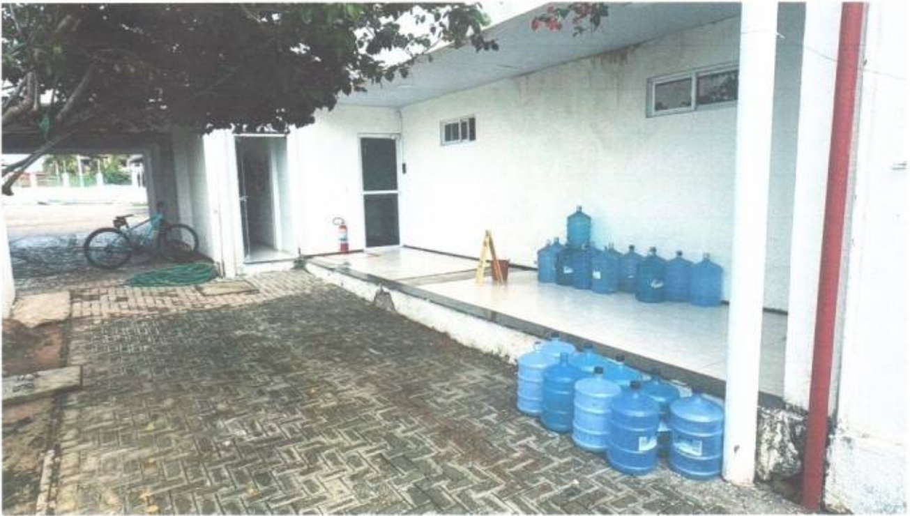
Vista dos fundos do prédio da Câmara Municipal de São Gonçalo do Amarante-CE