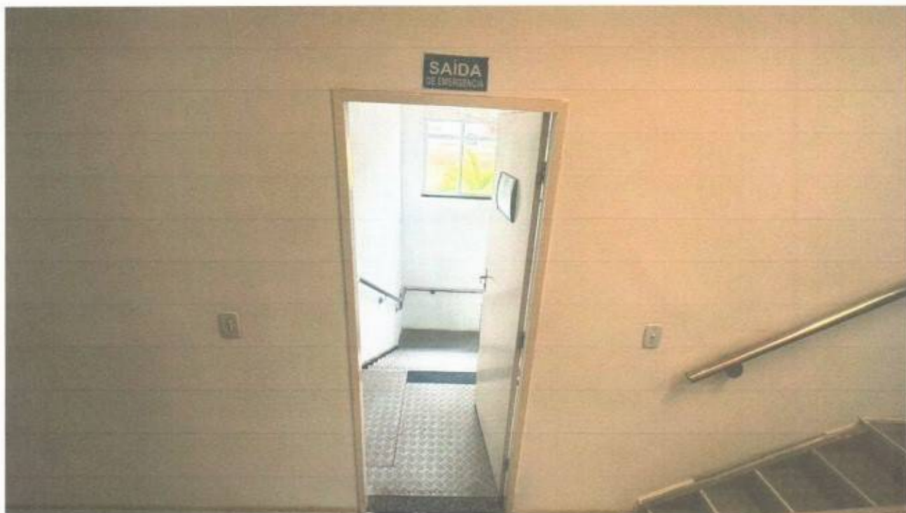
Vista da saída de emergência no pavimento superior do prédio da Câmara Municipal de São Gonçalo do Amarante-CE