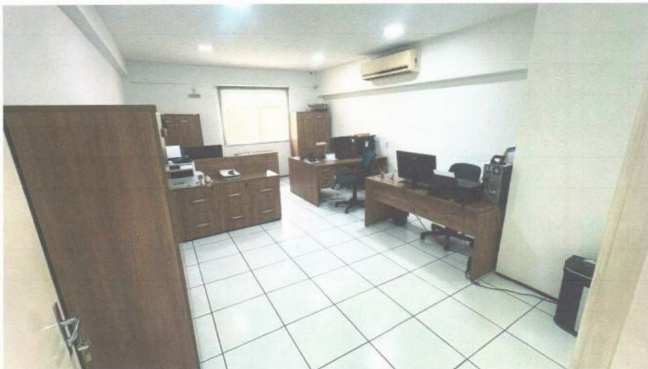
Vista da sala dos recursos humanos no pavimento superior do prédio da Câmara Municipal de São Gonçalo do Amarante-CE