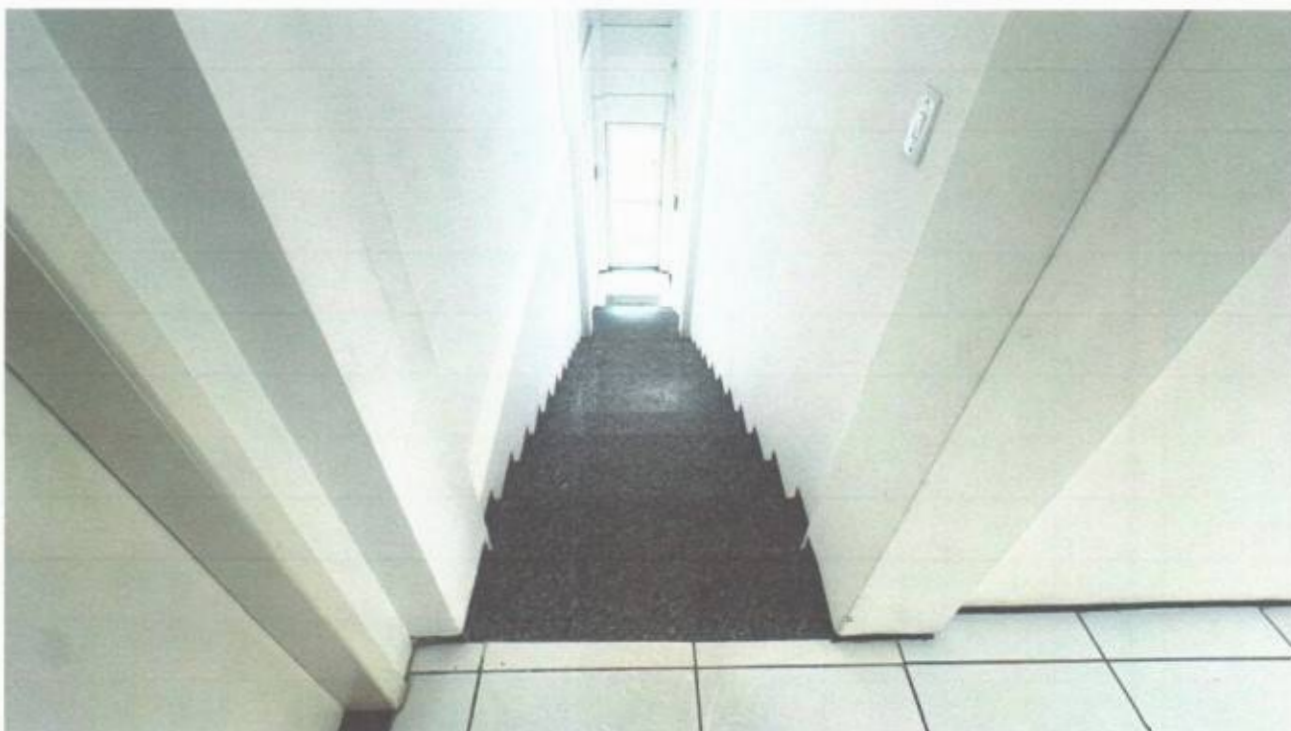
Vista do acesso pelas escadas ao pavimento superior pelo estacionamento