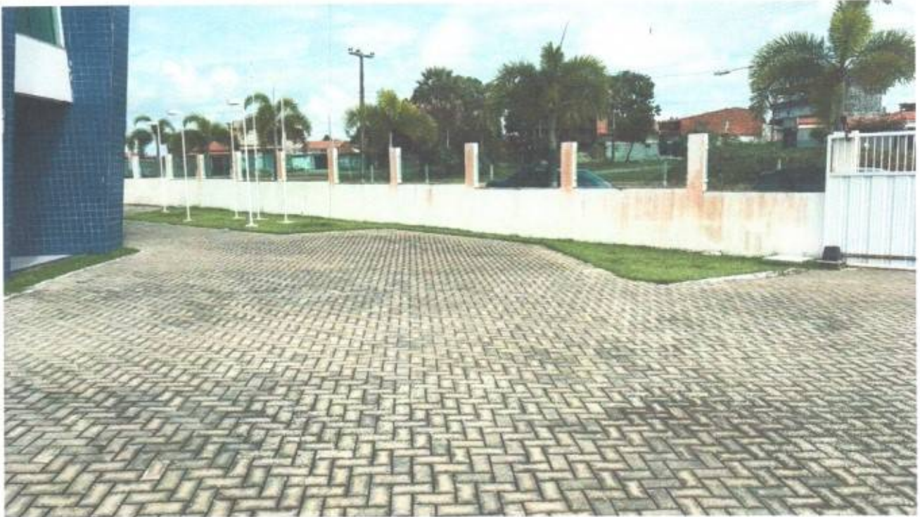
Vista da entrada externa da Câmara Municipal de São Gonçalo do Amarante-CE