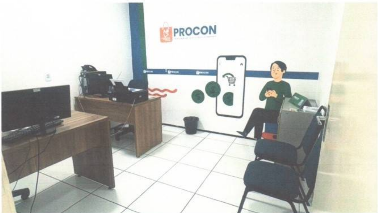
Vista da sala do PROCON no pavimento superior do prédio da Câmara Municipal de São Gonçalo do Amarante-CE