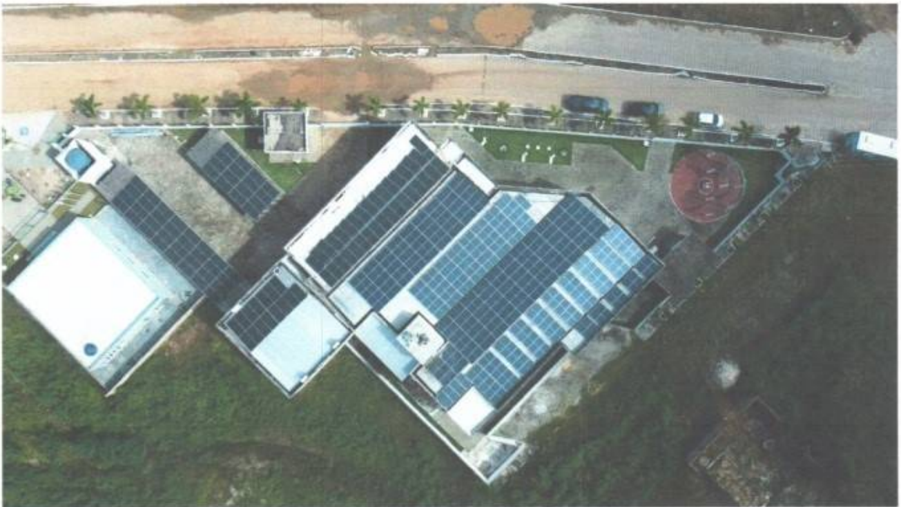
Vista aérea superior da Câmara Municipal de São Gonçalo do Amarante-CE