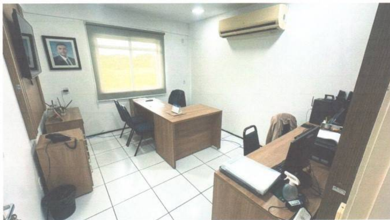
Vista do gabinete de vereador no pavimento superior do prédio da Câmara Municipal de São Gonçalo do Amarante-CE