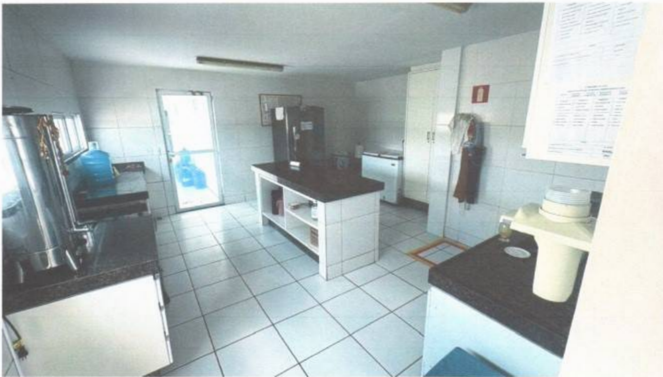
Vista da copa do prédio da Câmara Municipal de São Gonçalo do Amarante-CE