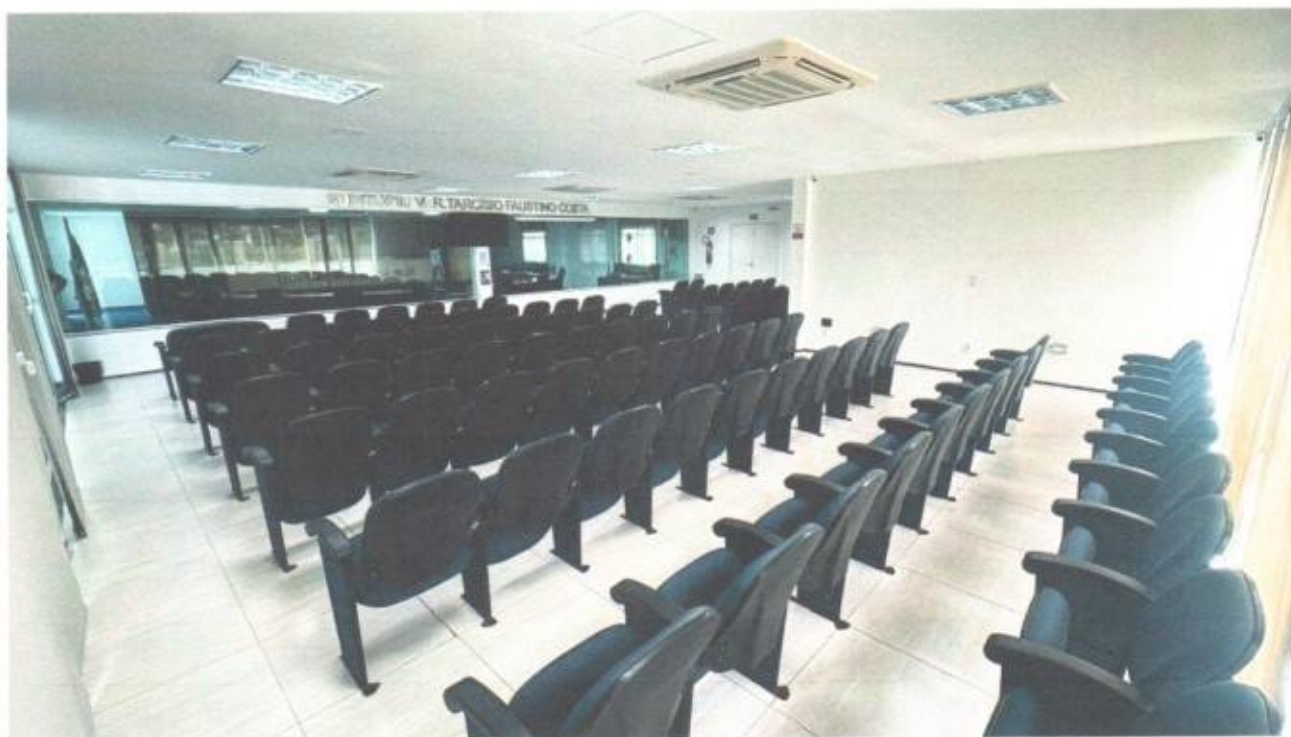
Vista do auditório do prédio da Câmara Municipal de São Gonçalo do Amarante-CE