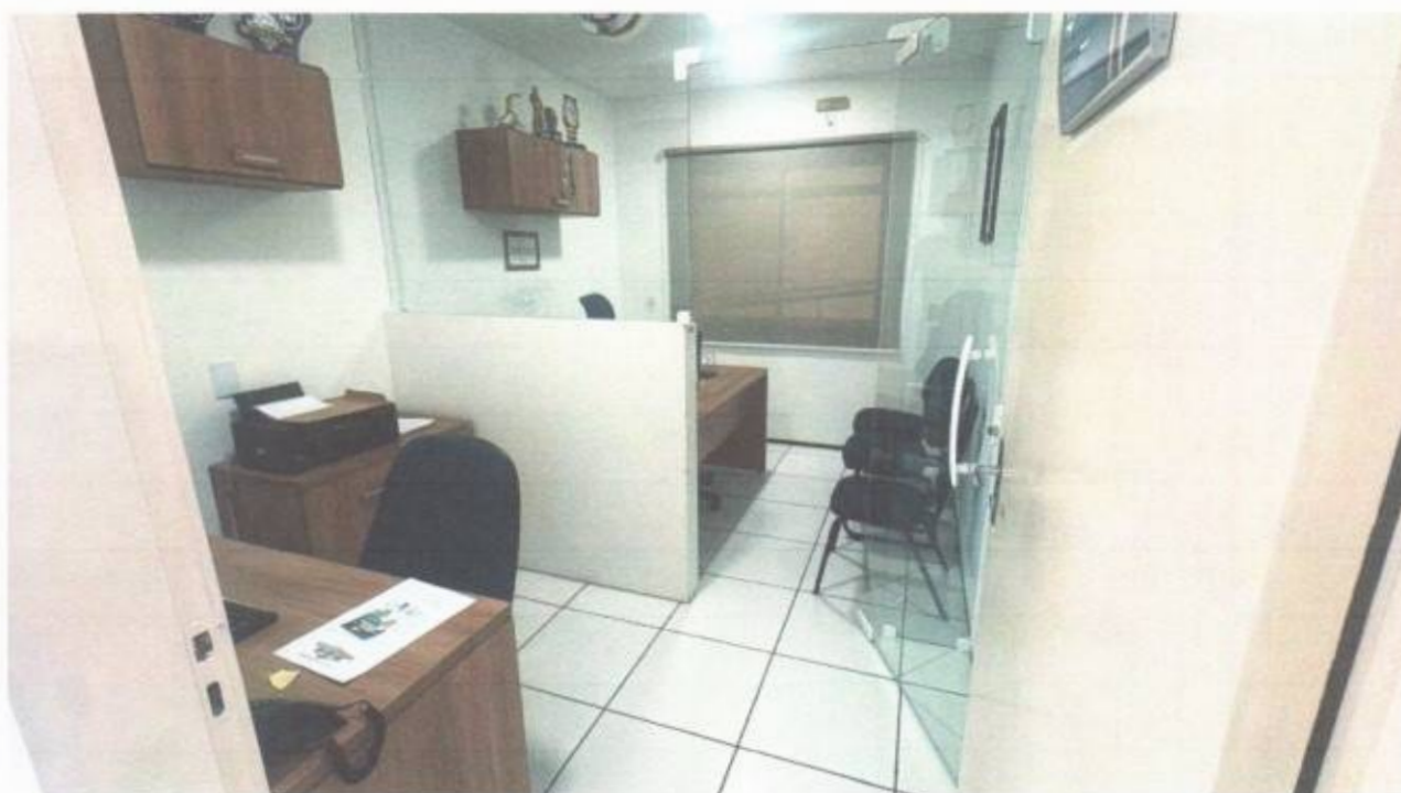
Vista do gabinete de vereador no pavimento superior do prédio da Câmara Municipal de São Gonçalo do Amarante-CE