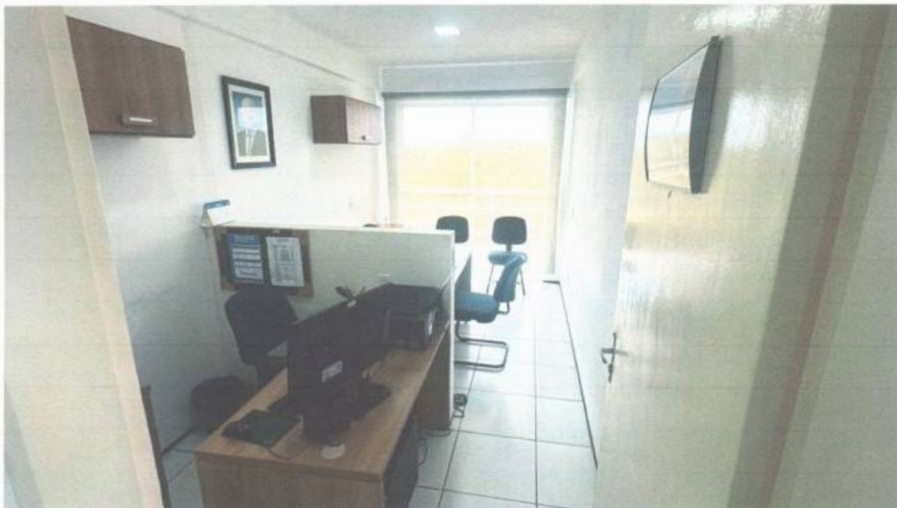
Vista do gabinete de vereador no pavimento superior do prédio da Câmara Municipal de São Gonçalo do Amarante-CE