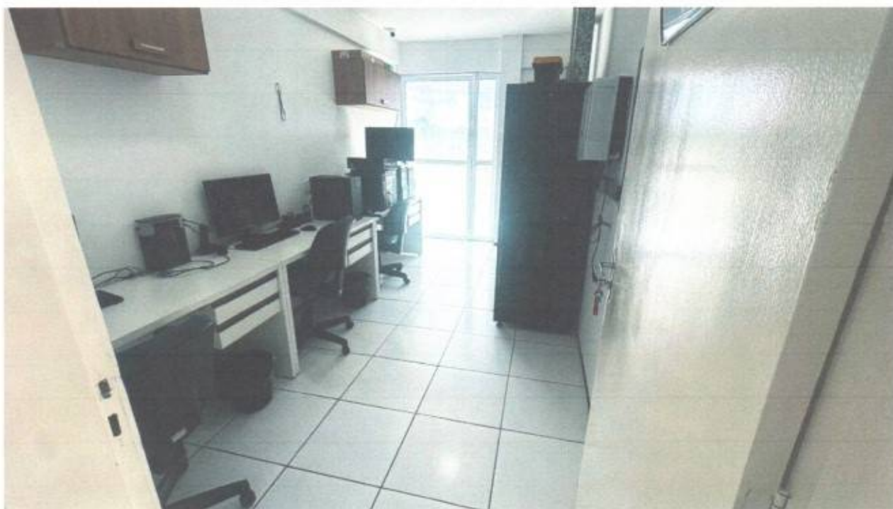
Vista da sala do setor de TI no pavimento superior do prédio da Câmara Municipal de São Gonçalo do Amarante-CE