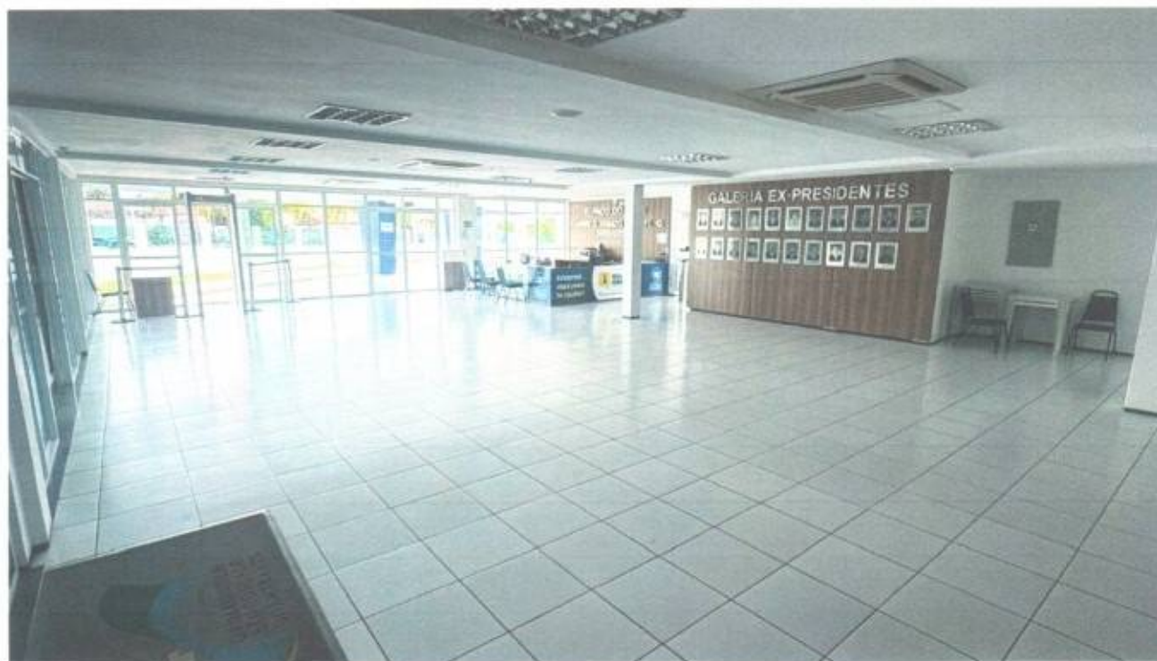
Vista do salão principal do prédio da Câmara Municipal de São Gonçalo do Amarante-CE