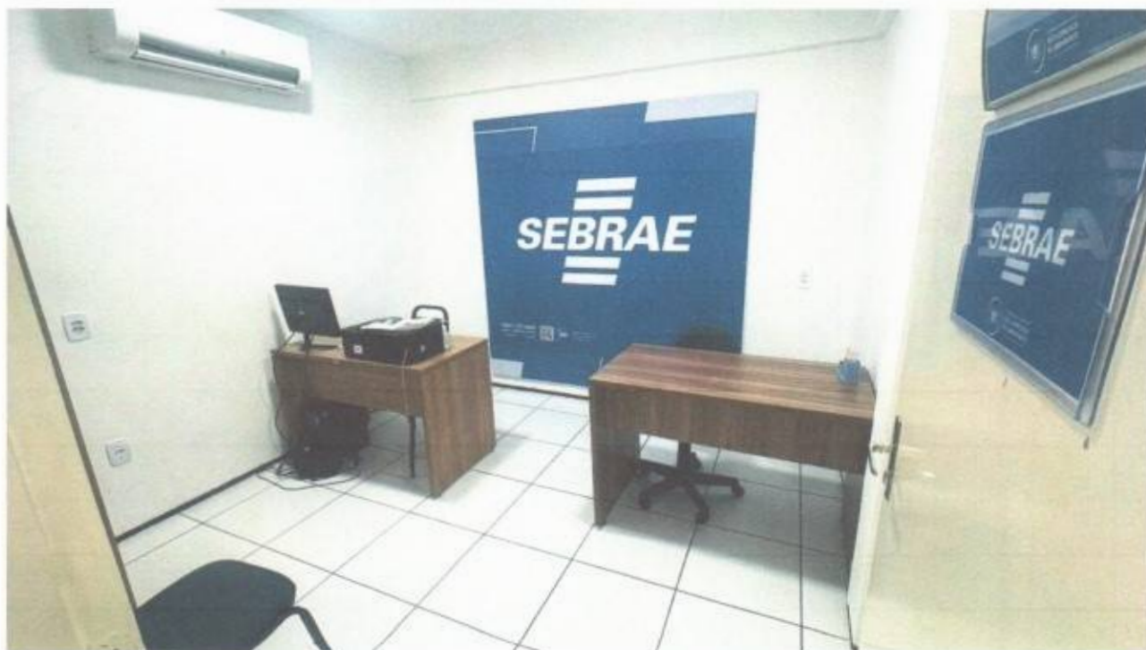
Vista da sala do SEBRAE no pavimento superior do prédio da Câmara Municipal de São Gonçalo do Amarante-CE