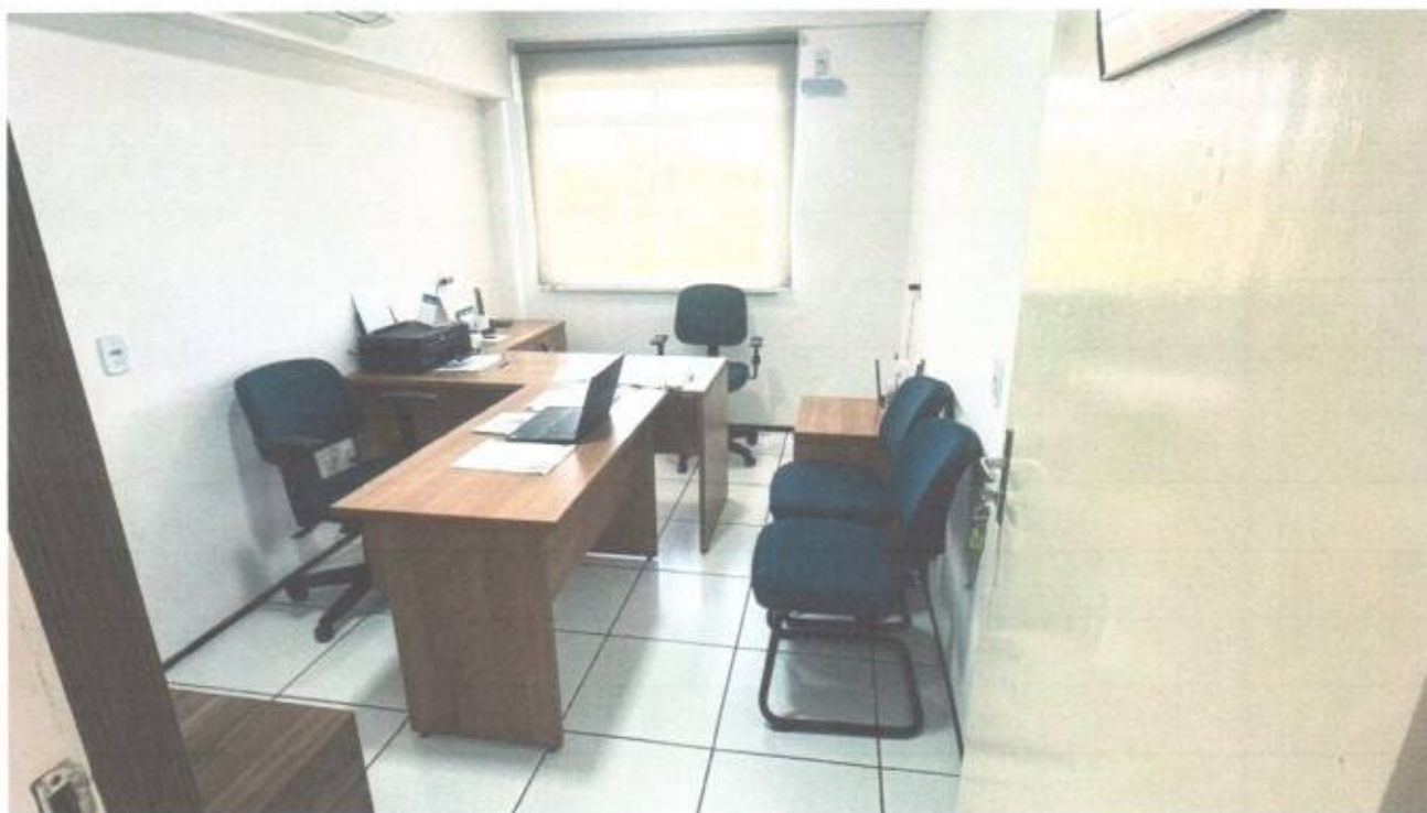
Vista da sala setor financeiro no pavimento superior do prédio da Câmara Municipal de São Gonçalo do Amarante-CE