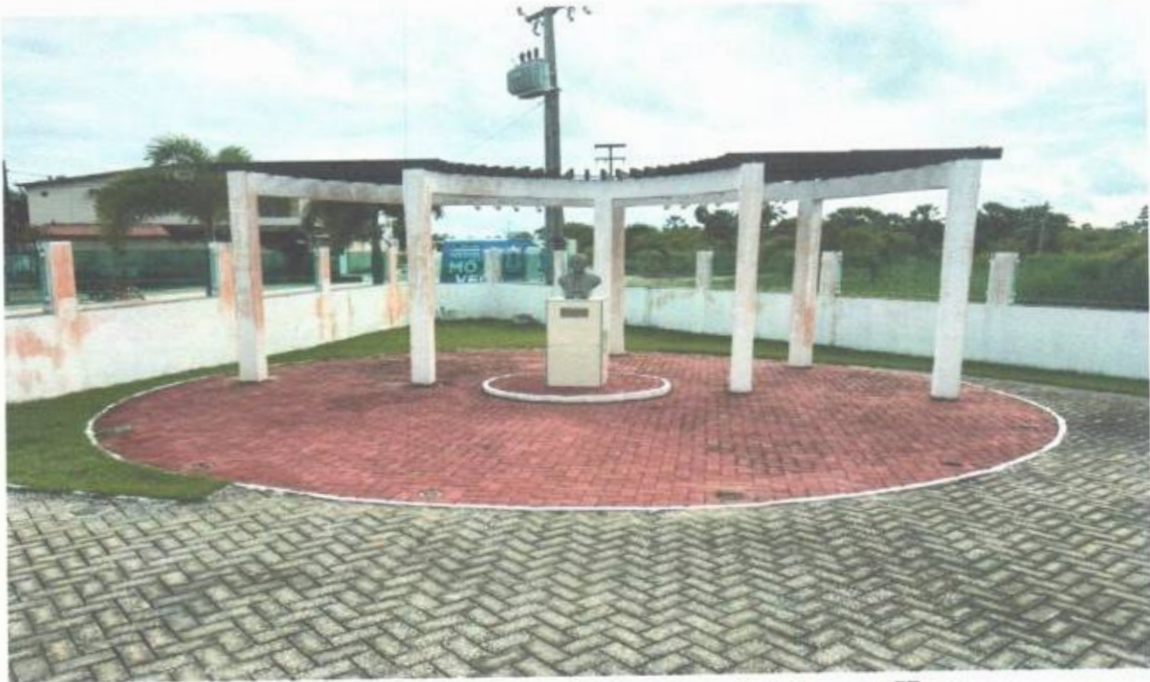
Vista da entrada da Câmara Municipal de São Gonçalo do Amarante-CE