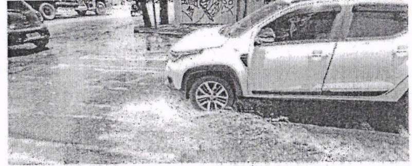
ALAGAMENTOS são cotidiano no local |

KAILO PIMENTEL ESPECIAL PARA O POVO kai.oliveira@opovo.com.br