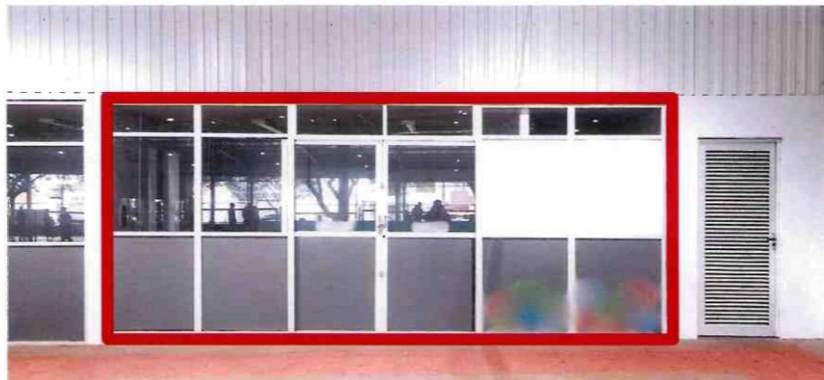
13.1.6. ITEM 5 – SALA 6 (39,10m 2 )