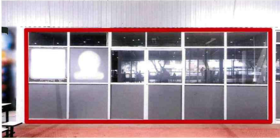
13.1.5. ITEM 4 – SALA 05A/05B - (21,17m 2 )