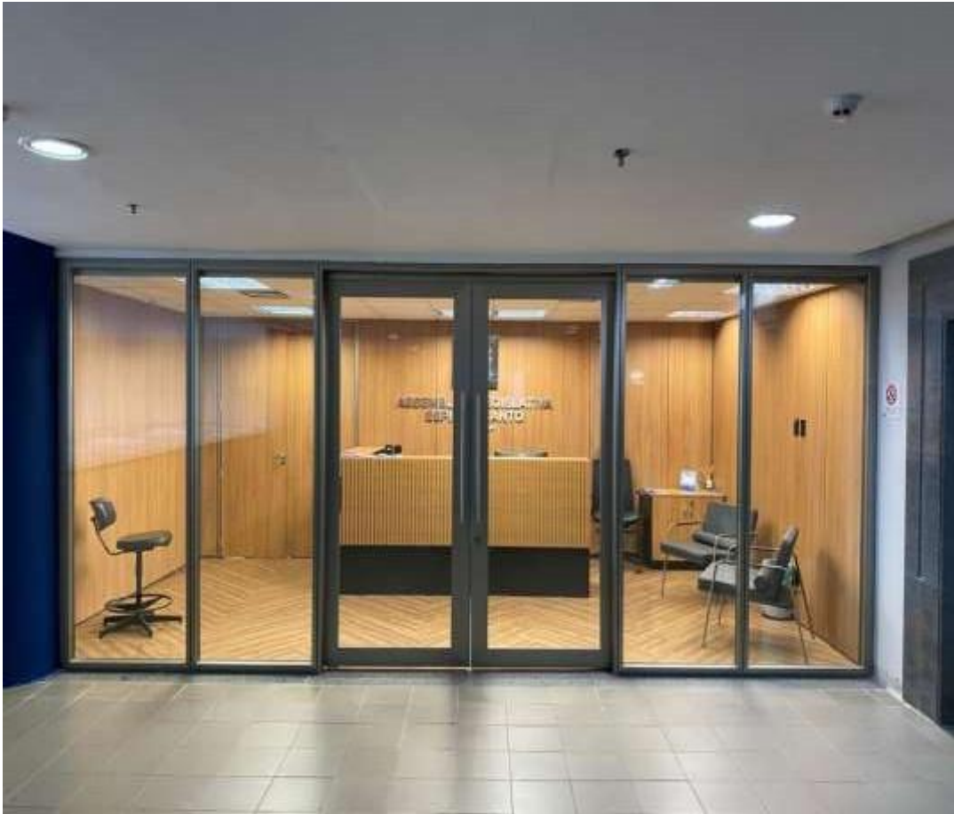
Imagem 02: Imagem Porta 01- Entrada