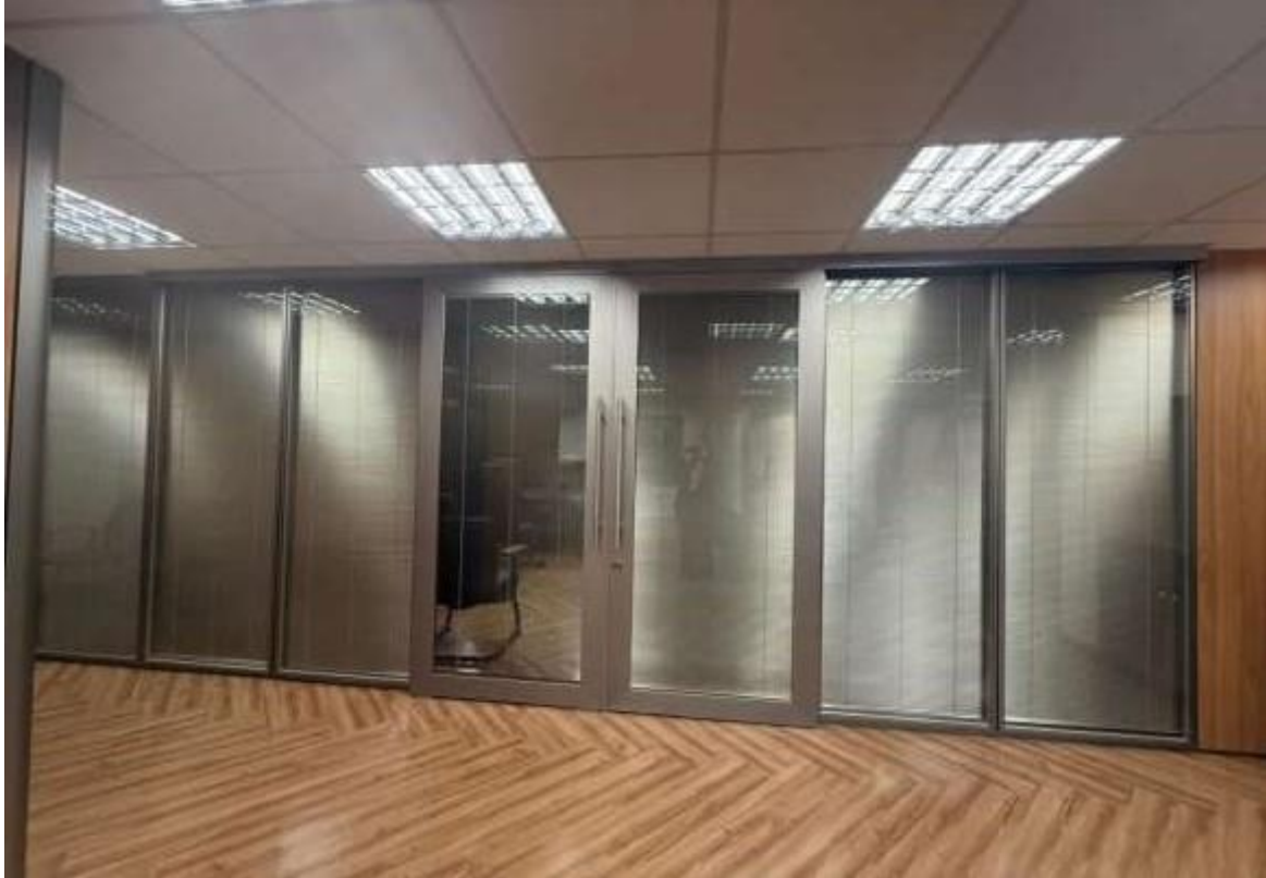
Imagem 03: Imagem Porta 02 – Sala de reunião.