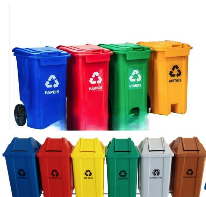
Figura 1 - Modelo de contentores de resíduos sólidos, de 240 L e 100L, com indicação do tipo de resíduo armazenado.

7.9. A indicação do tipo de resíduo deve vir nos contentores de resíduos diretamente da fábrica.