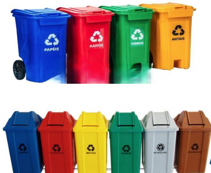
Figura 1 - Modelo de contentores de resíduos sólidos, de 240 L e 100L, com indicação do tipo de resíduo armazenado.

3.4 - Os contentores de 240L (duzentos e quarenta) litros deverão ter a indicação do tipo de resíduo no tamanho mínimo de 35x45cm, e o de 100 litros, no tamanho mínimo de 15x20cm, conforme ilustração da Figura 1.