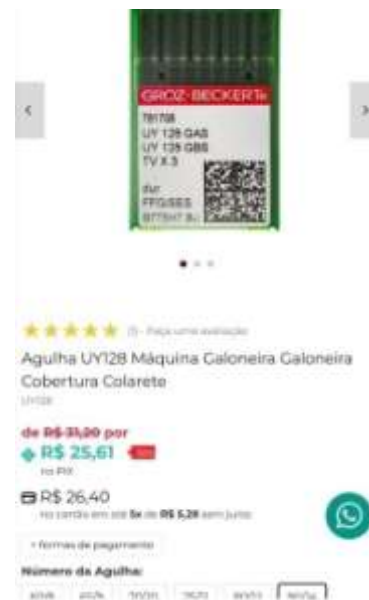
UY 128 – 90/14