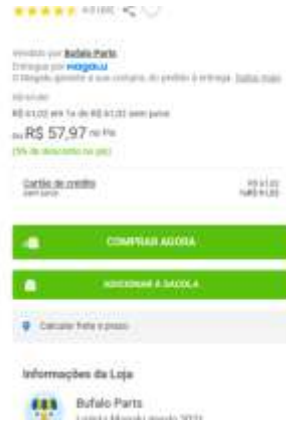
Lixeira cesto balde com tampa 100 litros preta