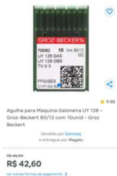
UY 128 – 80/12