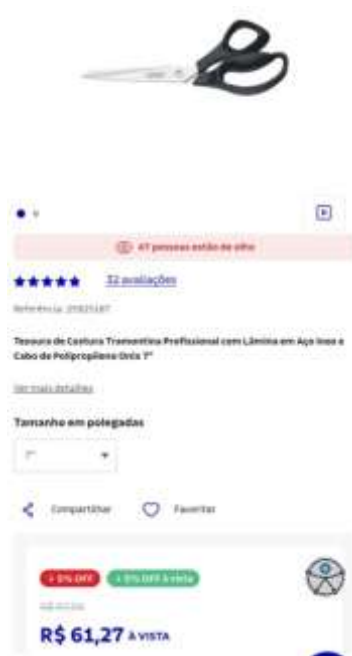
Tesoura de costura 7”

Av. Governador Bley, n.º 236, Edifício Fábio Ruschi, 7º andar, Ala Mar CEP 29.010-150 - Centro - Vitória/ES - www.sejus.es.gov.br