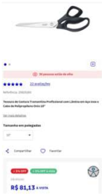
Tesoura de costura 10”