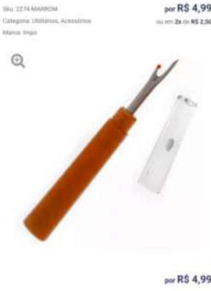
Abridor de casa (grande)