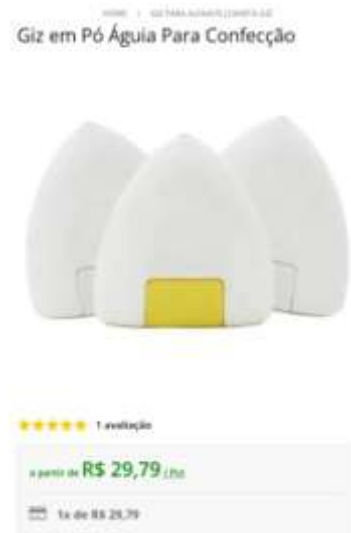
Giz em pó - Água