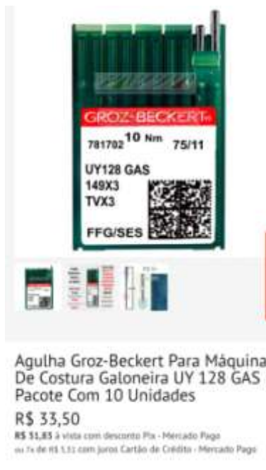
UY 128 – 75/11

Av. Governador Bley, n.º 236, Edifício Fábio Ruschi, 7º andar, Ala Mar CEP 29.010-150 - Centro - Vitória/ES - www.sejus.es.gov.br