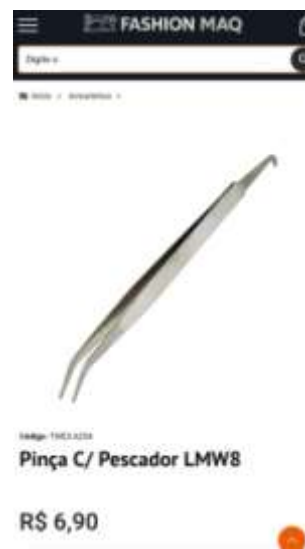
Pinça c/ pescador