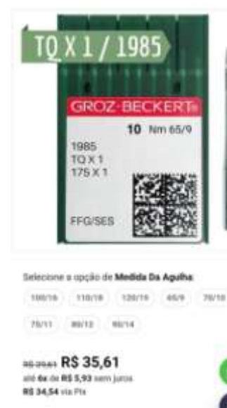
TQ X 1 80/12