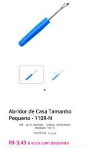
Abridor de casa (pequeno)