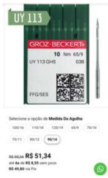
UY 113 90/14