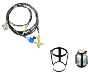
Suporte Botijão De Gás 13kg + Kit Gás Caminhão Motorhome