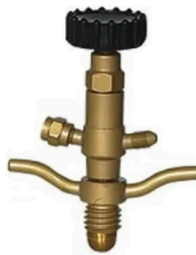
Maçarico Orca Registro Rosca Grossa Para Botijão Gas 5 E 13k