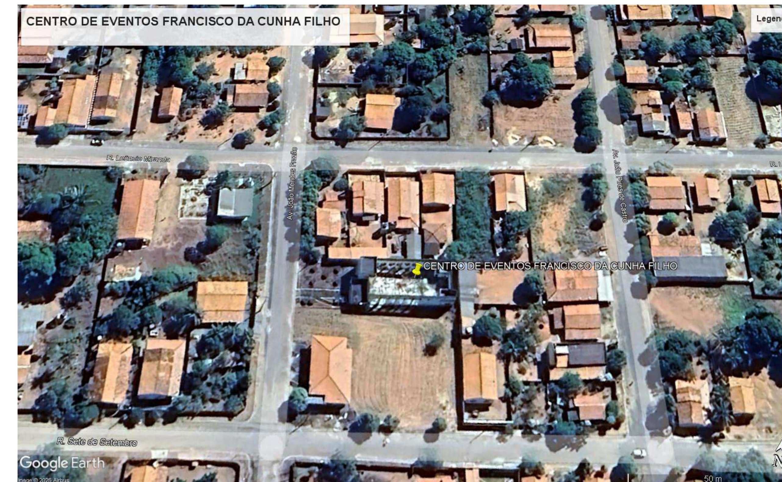
PLANTA SITUAÇÃO 1:1