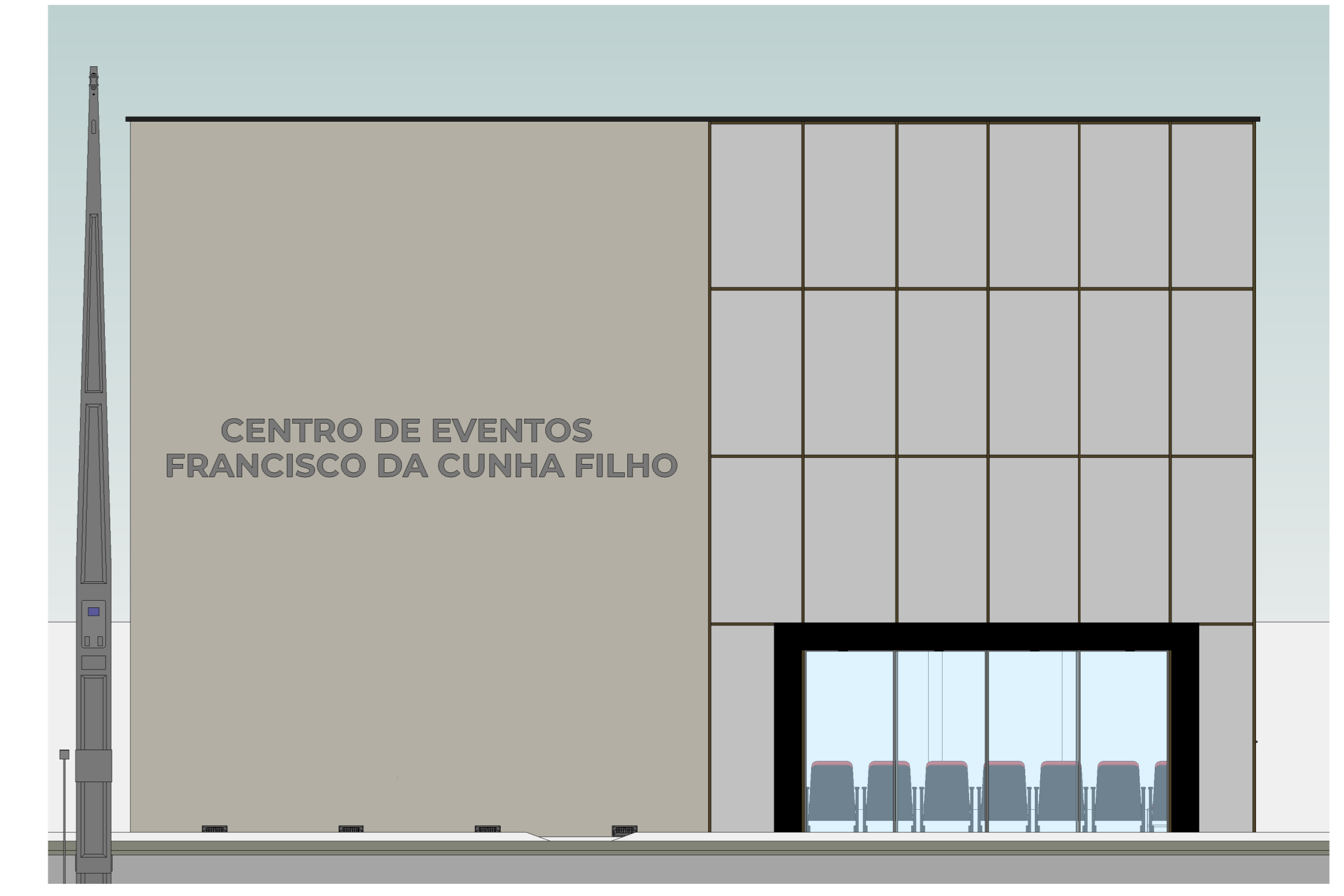
PERSPECTIVA 2 FACHADA 1:1