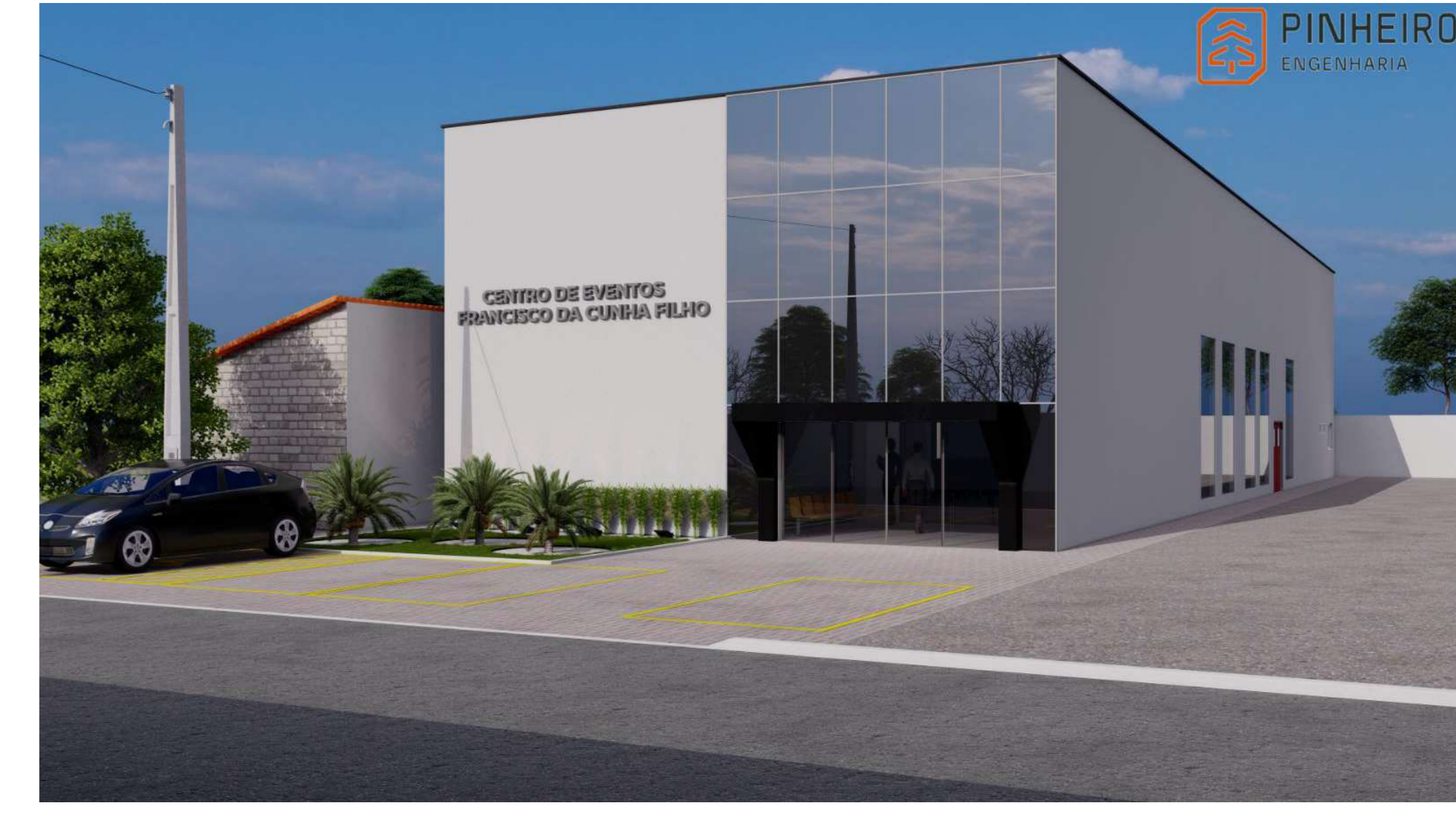
PERSPECTIVA 4 1:1