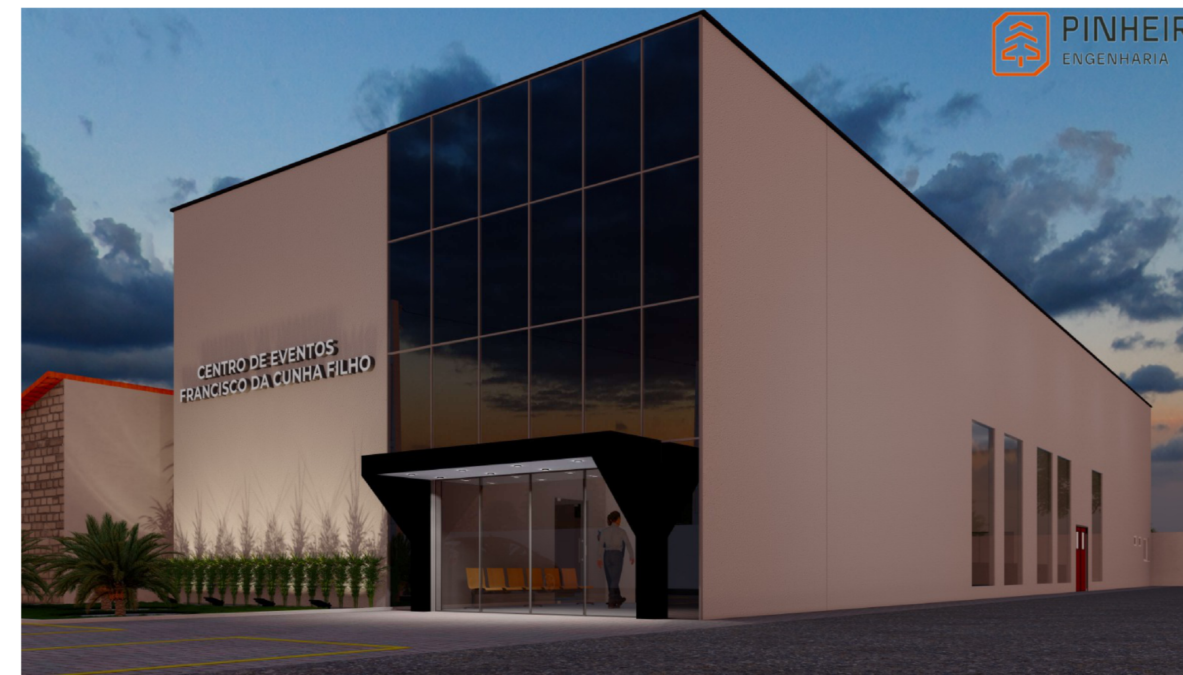
PERSPECTIVA 3 1:1