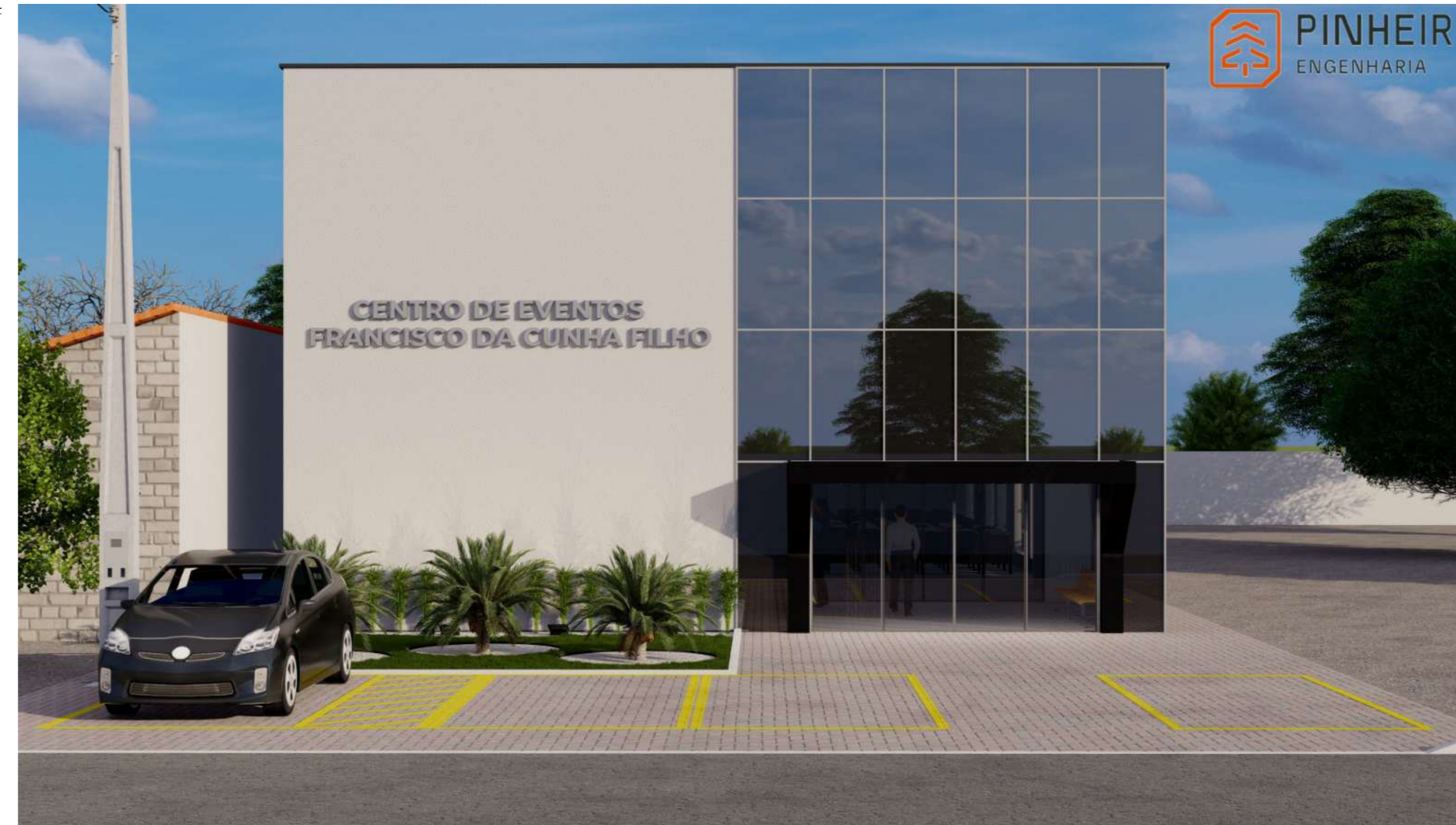
PERSPECTIVA 1 1:1