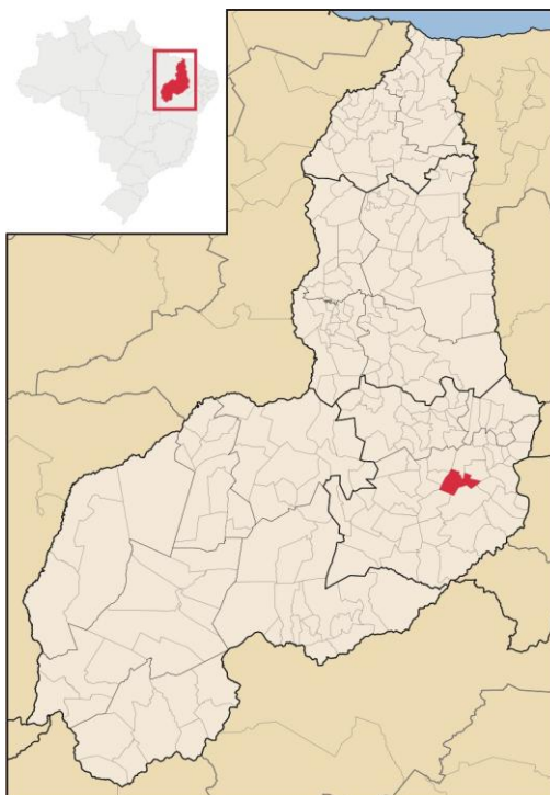
Figura 1 - Mapa de localização do município de Patos Piauí (PI)

A sede municipal tem as coordenadas geográficas de 07º 40'03" de latitude sul e 41º 14'37" de longitude oeste de Greenwich e dista cerca de 399 km de Teresina.