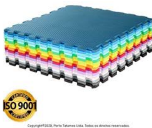
Foto do produto empilhado: www.portotatames.com.br/tatame-profissional-1x1x40mm-encaixe-universal

As placas devem ser de fácil montagem, com encaixe perfeito, de fácil manejo e transporte, com fácil higienização, e devem possuir validade indeterminada, para este último item citado, depende principalmente das formas adequadas de manuseio, higiene e armazenagem do produto, e que estas devem ser devidamente expressas pelo fabricante do produto.