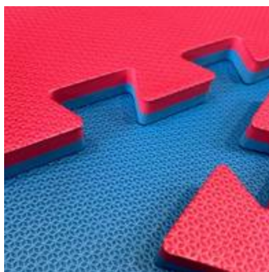
Foto em detalhe do produto: https://www.lojadecoratec.com.br/tatame-eva/tatame-eva-40mm-azul-royal-e-vermelho-1x1

Foto do produto empilhado: www.portotatames.com.br/tatame-profissional-1x1x40mm-encaixe-universal