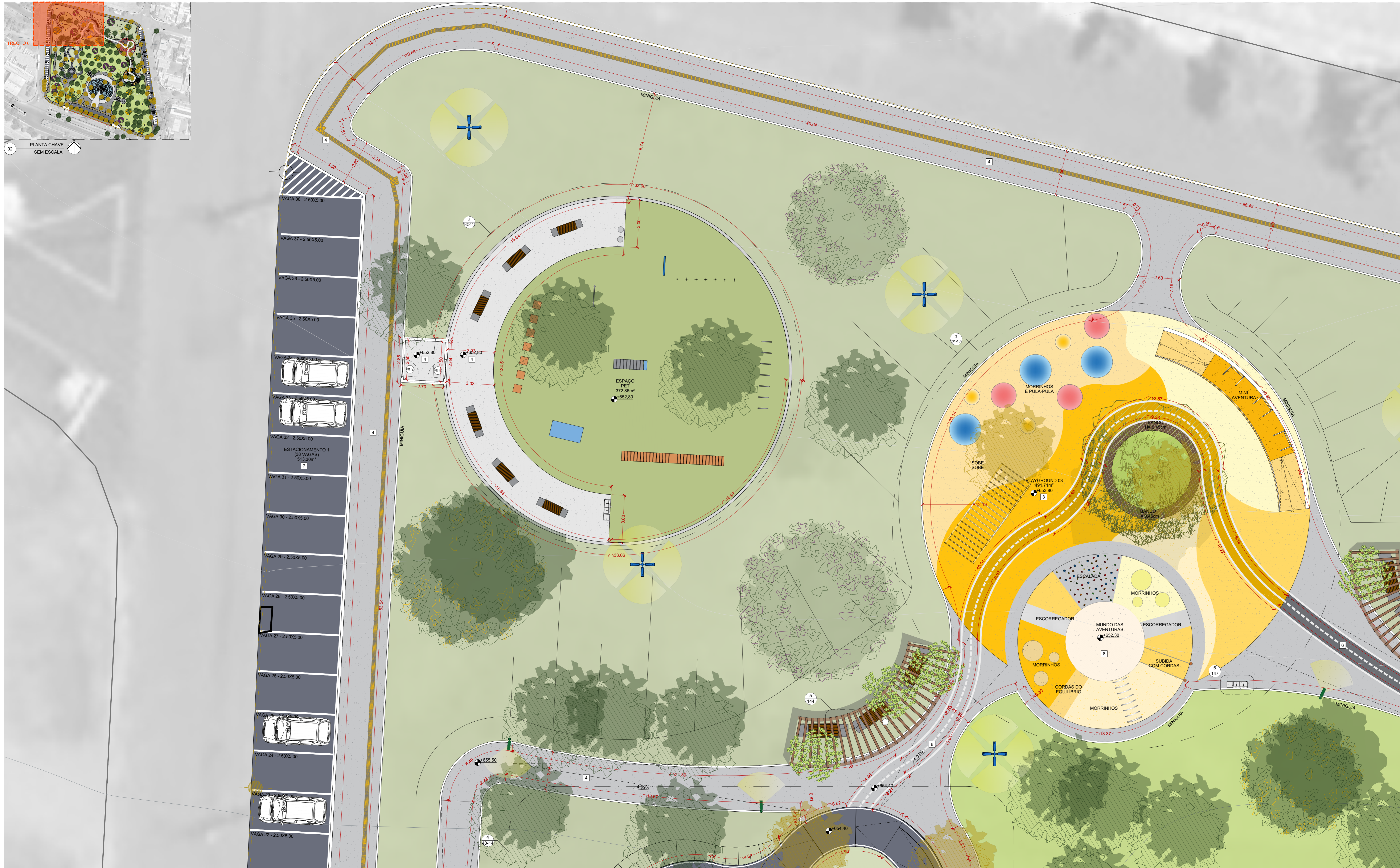
02 PLANTA CHAVE SEM ESCALA