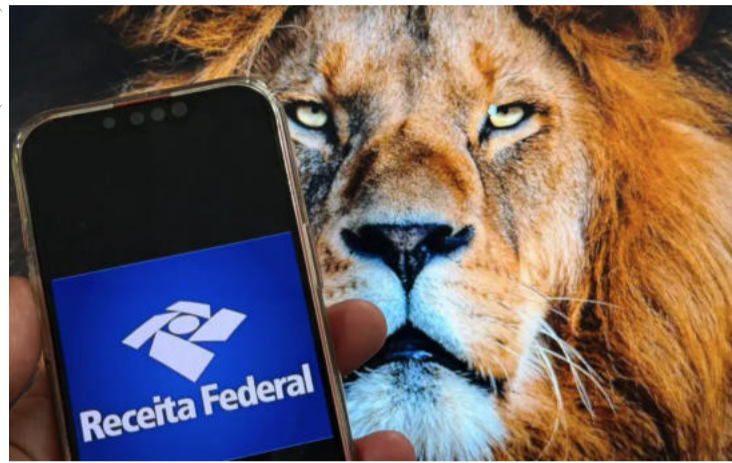
Do total de declarações recebidas até o momento, 42,7% foram pré-preenchidas, 57,3% foram simplificadas e 1,3% foram retificadoras.