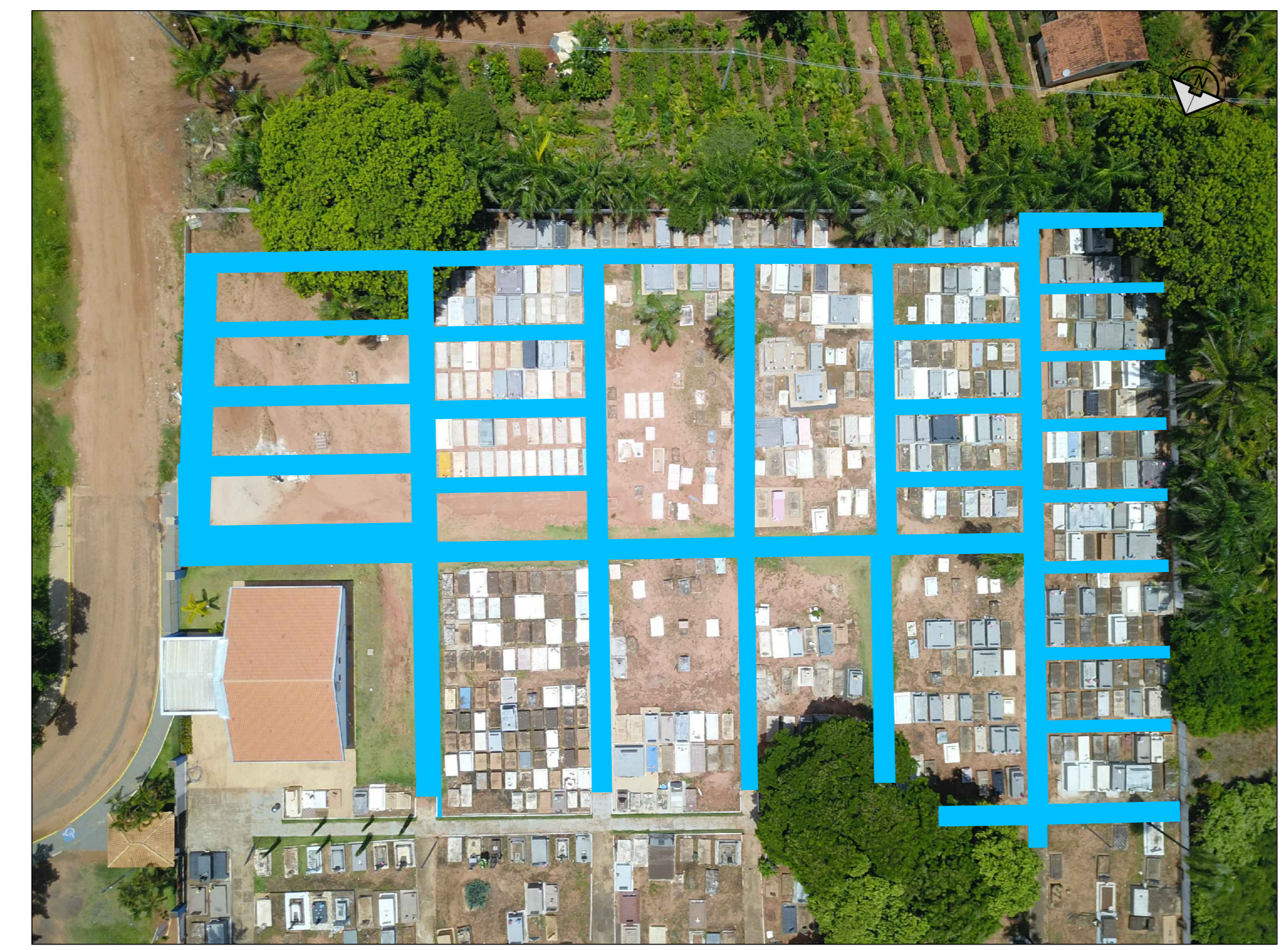
IMAGEM DO LOCAL PROJEÇÃO DAS CALÇADAS