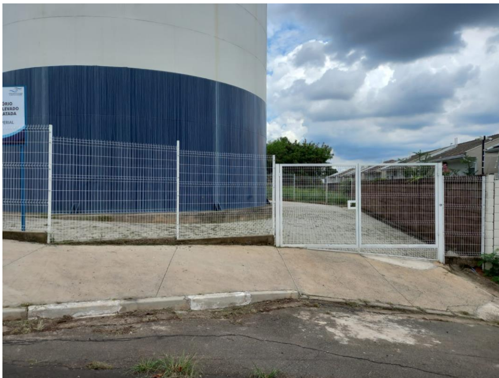
Foto ilustrativa do portão e gradil

O entorno da Estação Elevatória será todo concretado com espessura de 0,07m com tela de aço e com juntas de dilatação.