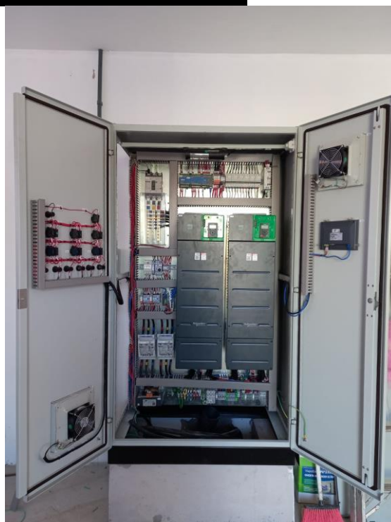
Foto ilustrativa da bomba in line e painel de controle