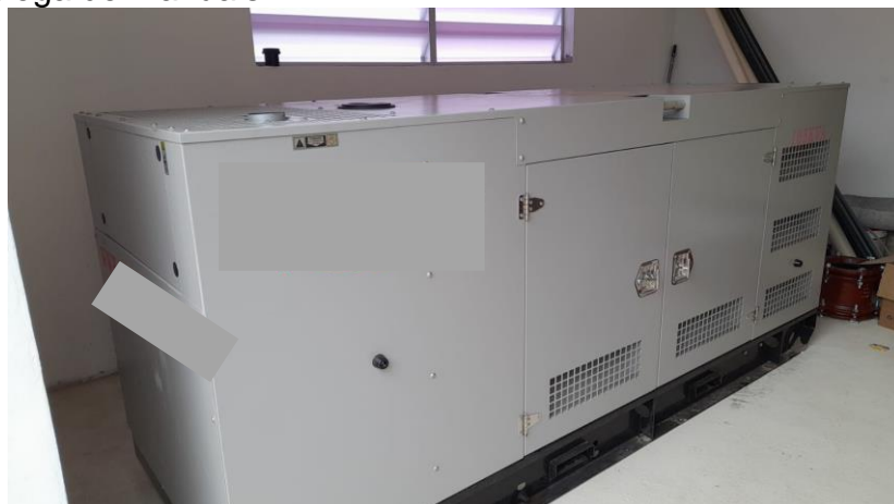
Foto ilustrativa do gerador