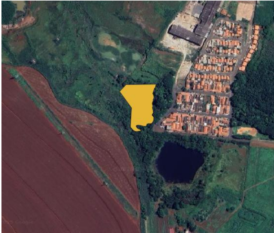
Figura 6: Área Pública: lat – 22.475873°, lon -47.372342°