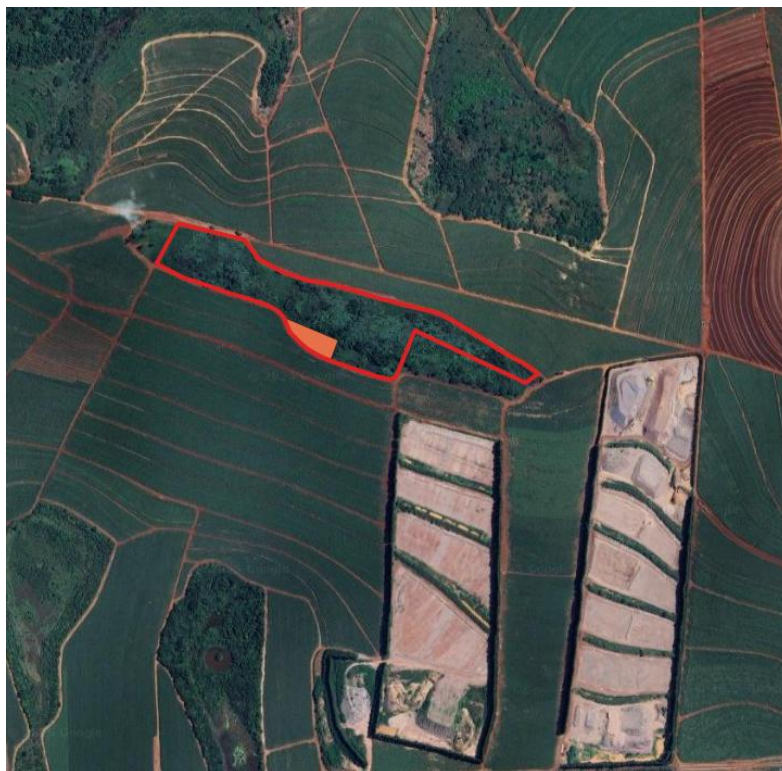
Figura 7: Fazenda Belo Horizonte: lat – 22.421632°, lon -47.457398°