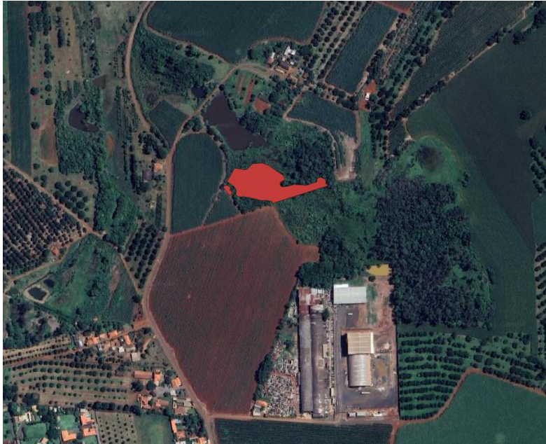
Figura 1: Sítio Santa Candida: lat – 22.457696°, lon -47.433496°