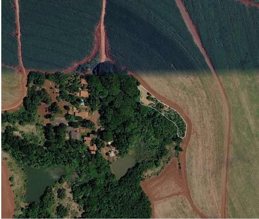
Figura 3: Nascente 44: lat – 22.502274, lon - 47.410144° - Google Earth