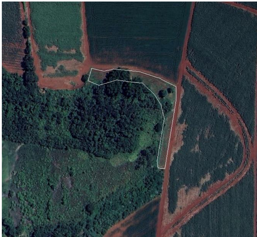
Figura 4: Nascente 19: lat – 22.478002, lon - 47.404790°