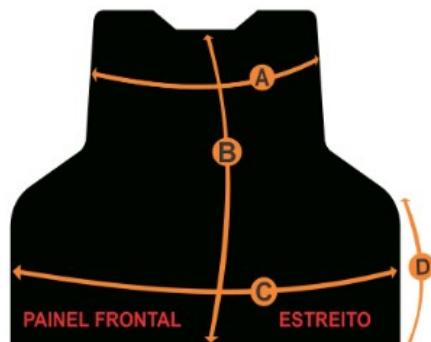
TABELA DE MEDIDAS DAS PLACAS NO PADRÃO ESTREITO (SENASP)