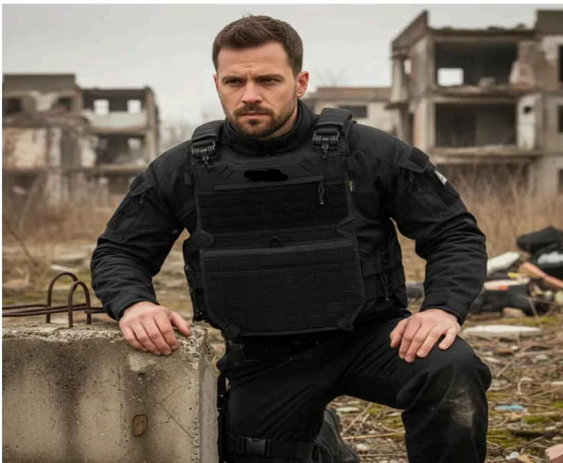
IMAGEM RELACIONADA AO DESCRITIVO: