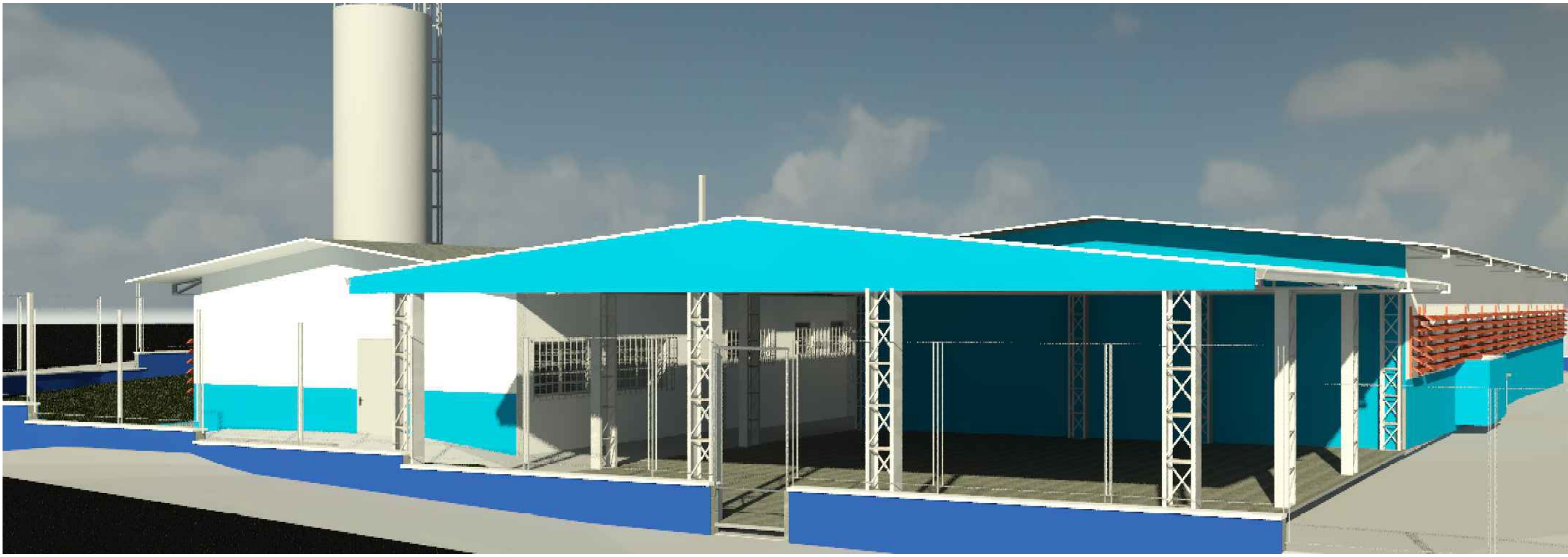
4 VISTA 04