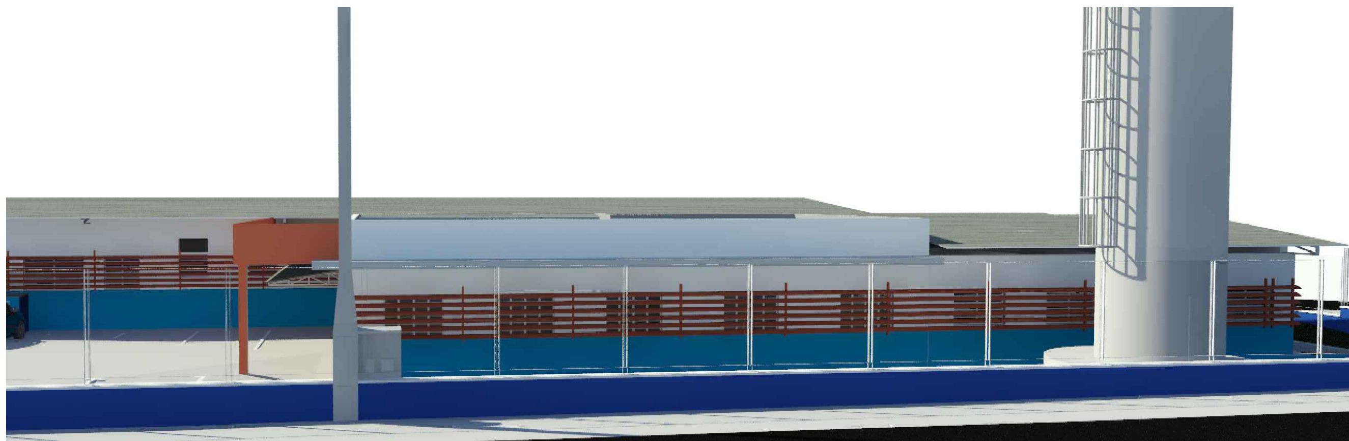
2 VISTA 02