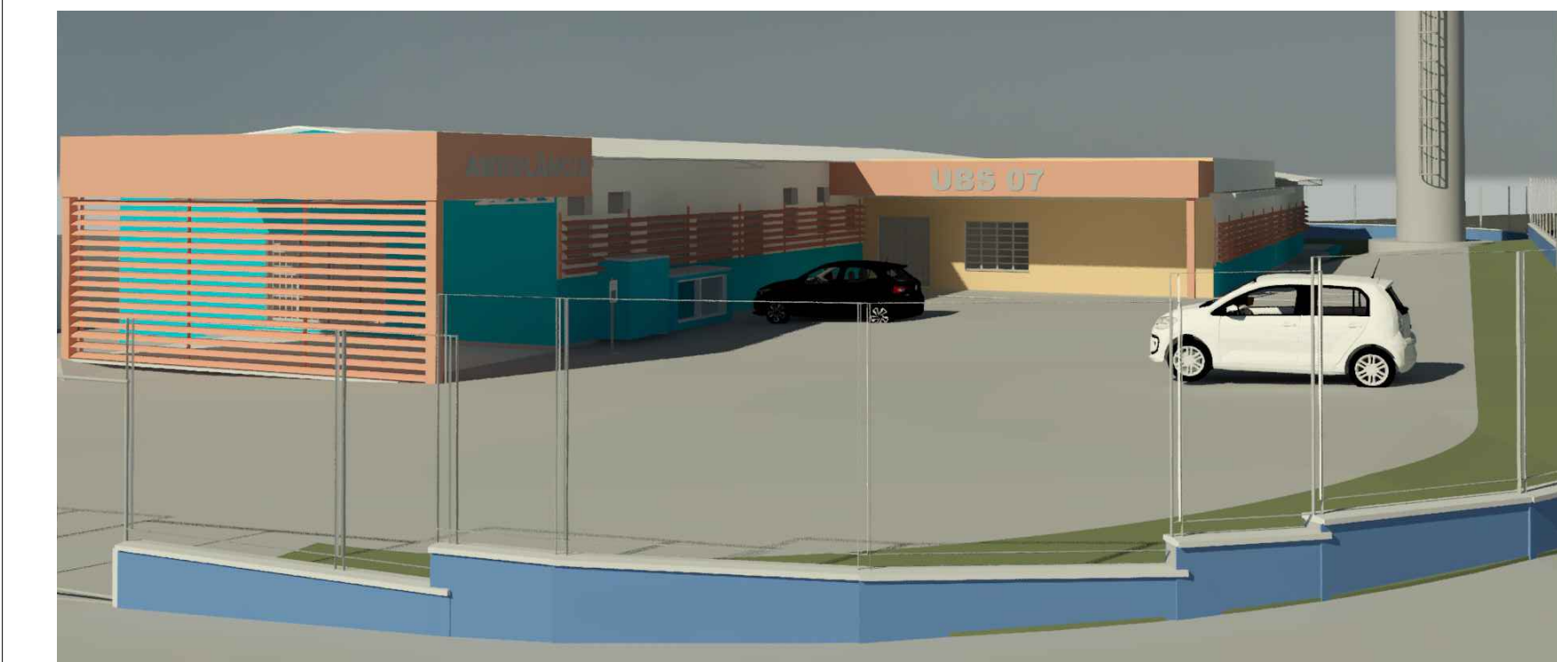
1 VISTA 01