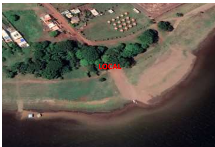
Figura 1 Croqui de localização.

A figura abaixo indica o local de implantação sobre imagem de satélite.