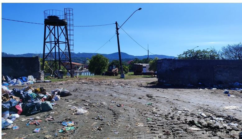
Pátio de recebimento, a ser reformado ampliado, reformado e coberto