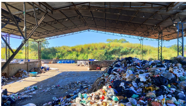
Área atual do pátio de transbordo, a ser reformado