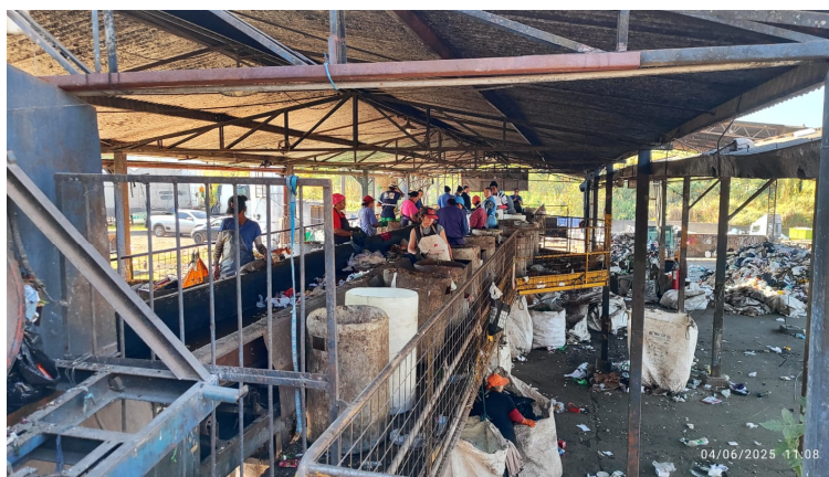
Área atual da esteira de catação