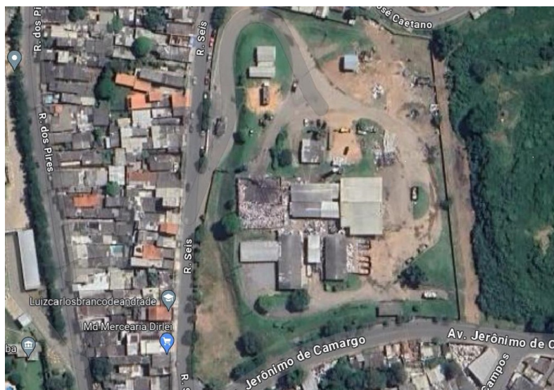
Vista aérea das atuais instalações e entorno