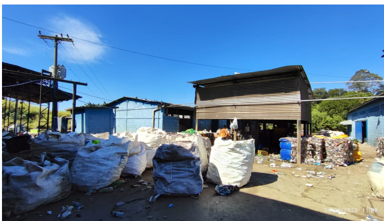
Área atual das prensas verticais da Cooperativa São José