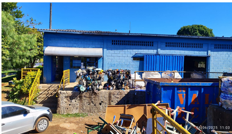
Área atual do escritório da Cooperativa, a ser reformado