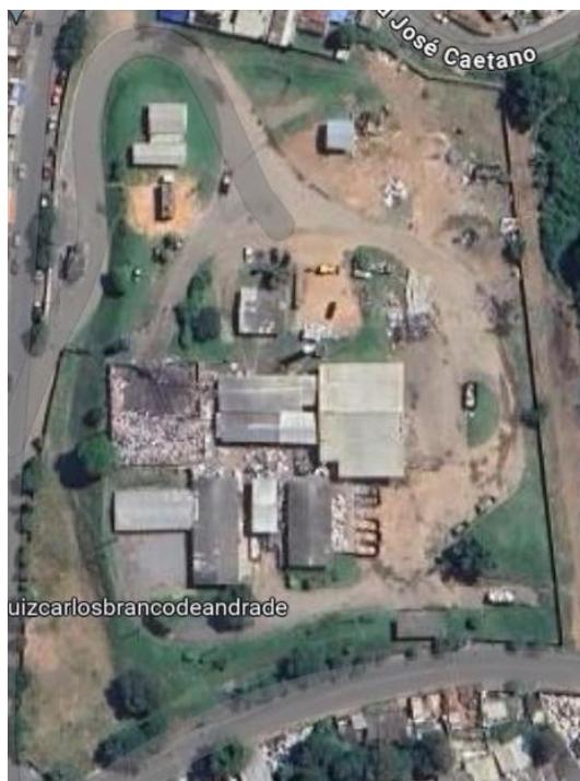
Vista aérea das atuais instalações