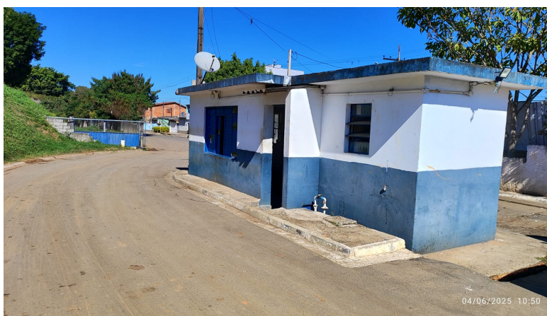
Área da paisagem - entrada da CTT