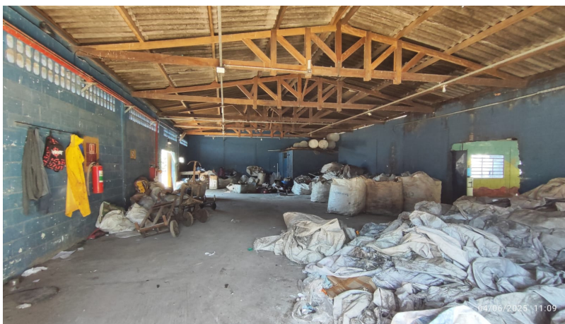
Área atual de Triagem de papel da Cooperativa São José