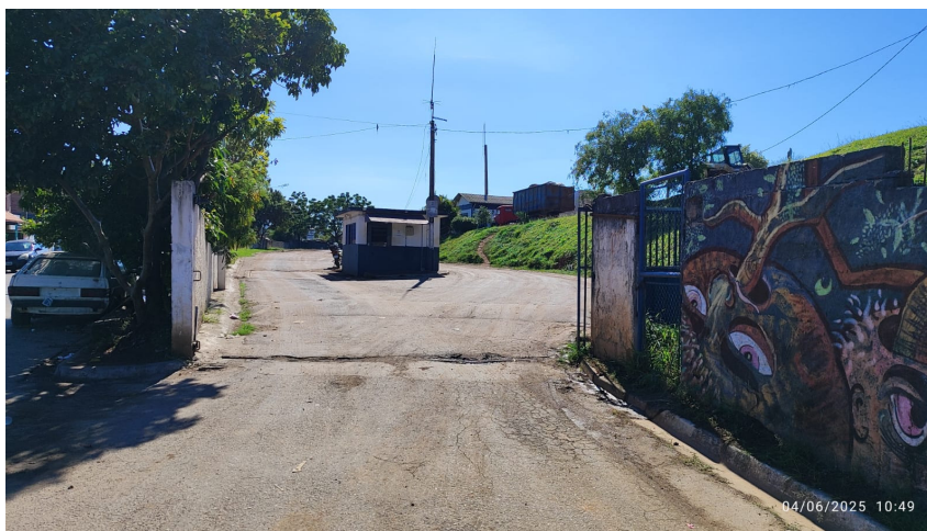
Entrada da CTT - guarita a ser construída para controle de acesso