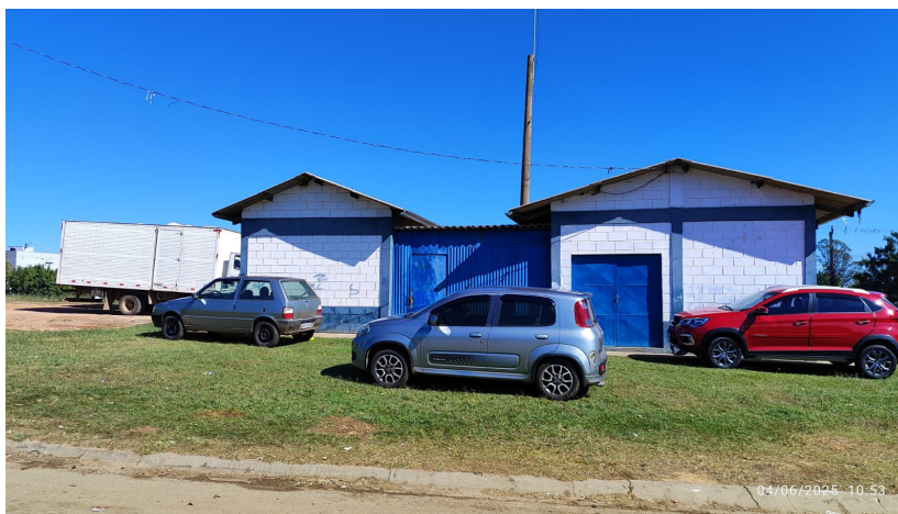
Escritório e Refeitório da SAAE, a ser reformado