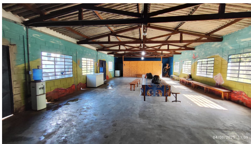
Área atual de descanso e vestiário da Cooperativa São José