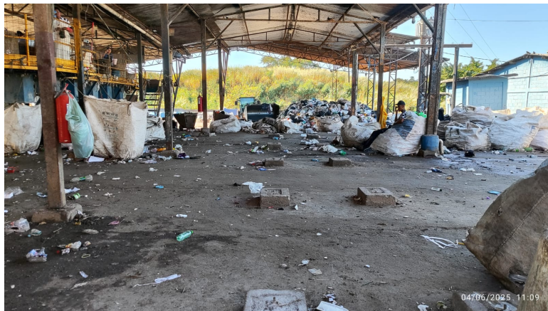
Área para instalação da esteira de catação