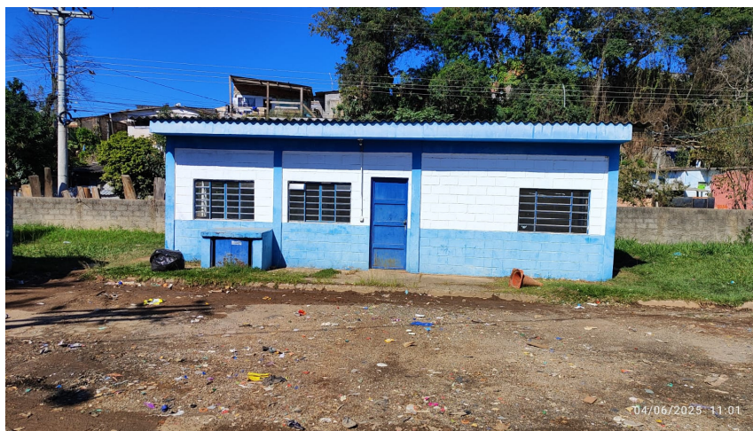
Área atual do refeitório da Cooperativa, a ser reformado